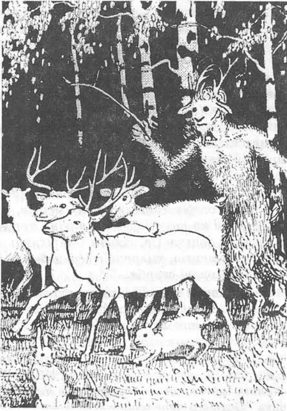
Кульчицька О. Лісовик. Туш, перо, пензель.

рити образ демонічних постатей на підставі матеріалів, записаних із уст народу, але не вдаватися при тім у такі інтерпретації, пояснювання та здогади, яких повно у міфологів, та з яких досі мало що устоялося. Найвірніший вийде образ тоді, коли буде чисто описовий і я сього тримався" 16 . Це засадниче методологічне положення наголосив учений і в стислому резюме своєї розвідки, вміщеної в "Хроніці НТШ" Вказує, що на основі фольклорних матеріалів він прагне відтворити "образ поодиноких демонічних постатей, тримаючися при тім описової методи і не вдаючися у міфологічні інтерпретації, які все мусять виходити суб'єктивні" 17