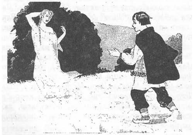
Кульчицька О. Нявка заманює парубка. Туш, перо, пензель.

міфологічних уявлень та вірувань і пізнішої їх еволюції та змін під впливом християнської ідеології. Простота і доступність викладу вміло поєднана з науковістю, вказівками на джерела кожної конкретної інформації, на відповідні аналогії і паралелі в традиційній культурі інших народів. Ці останні відомості підсилюються відсилками до кращих і найбільш ґрунтовних праць із слов'янської та світової міфології. Прикінцевий список таких праць при окремих статтях — досить значний.