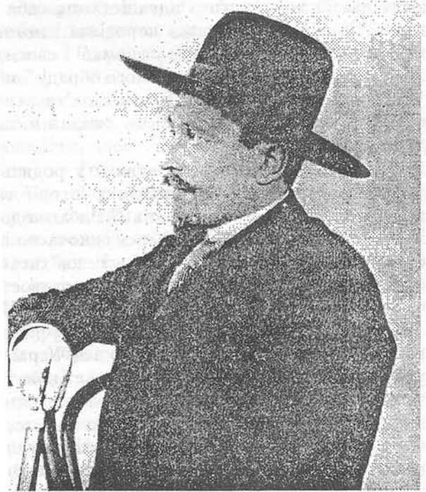
Володимир Гнатюк (1871-1926)

і етнографічних відомостей з народної міфології: "Звичайно записувачі звертають найбільшу увагу на пісні та казки, а інші матеріали, між тим і такі, як обняті сим томом, записують лише випадково. Тим часом, якраз такі матеріали мають спеціальну ціну для нас і то не лише тому, що їх зібрано відповідно дуже мало, але й з тої причини, що в них міститься багато елементів, властивих лише нашому народові, а не перебраних із загальнолюдської скарбниці фольклорної, як се, приміром, із казками. Розуміється, що тими словами не хочу я приписувати сим матеріалам цілковитої оригінальності; звертаю на них лише більшу увагу, якої вони заслуговують вповні" 3