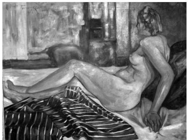
Павло Громницький. Оголена. 1939 р.