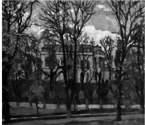
Павло Громницький. Осінній пейзаж. Прага, 1931 р.