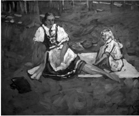
Павло Громницький. Портрет дружини з донькою. 1939 р.