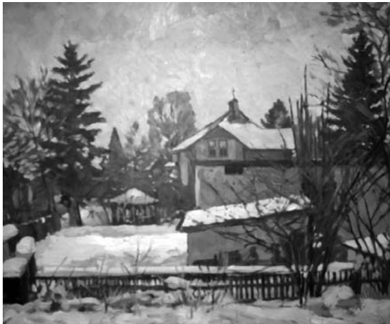
Павло Громницький. Зимовий пейзаж. 1960-ті рр.