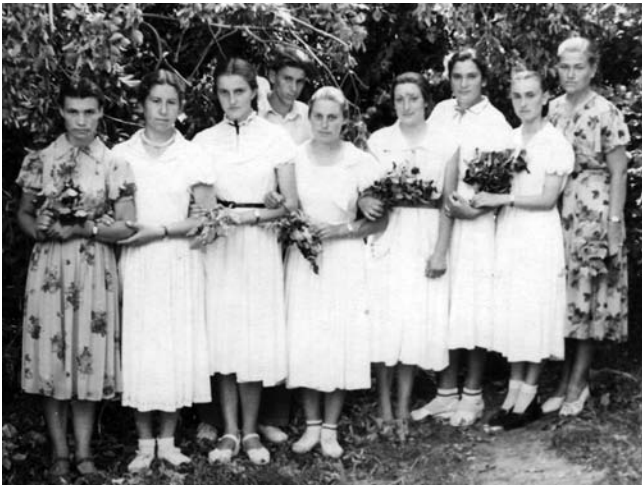
Після останнього дзвінка. Село Мостове на Миколаївщині. 1958 р.