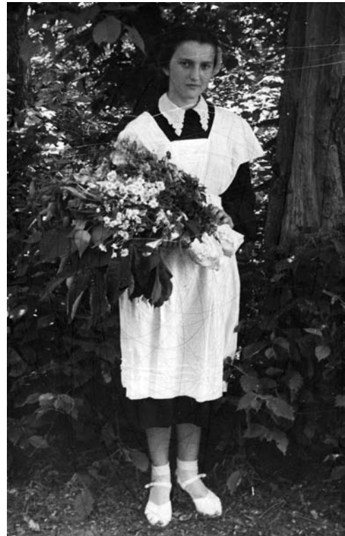
Випускниця Мостівської СШ Доманівського району. 1958 р.

Зав’язані якимось по-особливому, так щоби тільки відкритою була щілина для очей. Таке вже наше жіноцтво: оберігають свою красу від сонця, пороху. Усі вони вдови або наречені, яким щастя родинне забрала війна, а вони залишаються і далі жінками і бережуть свою вроду. Ці картини реального життя ніколи не забуду, вони не тільки для історика, тут новеліста треба, а насамперед – живої пам’яті кожного суцього.