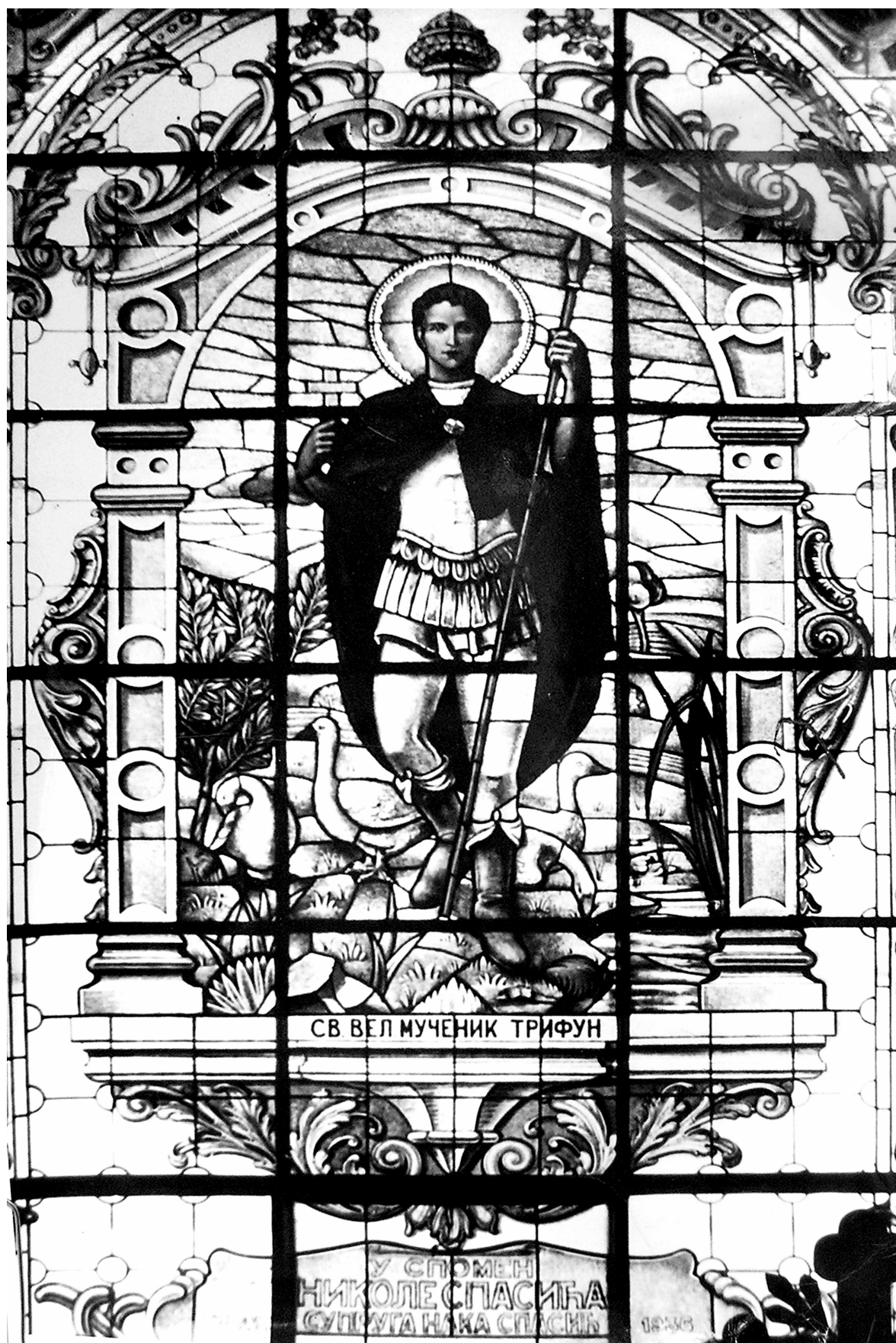
Святий великомученик Трифун. Вітраж Соборної церкви Св. Архистратига Михаїла у Белграді. Петро Карплюк 1936 р.