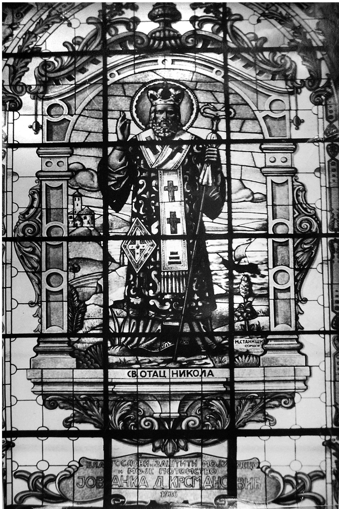
Святой Миколай. Вітраж Соборної церкви Св. Архистратига Михаїла у Белграді. Петро Карплюк 1936 р.