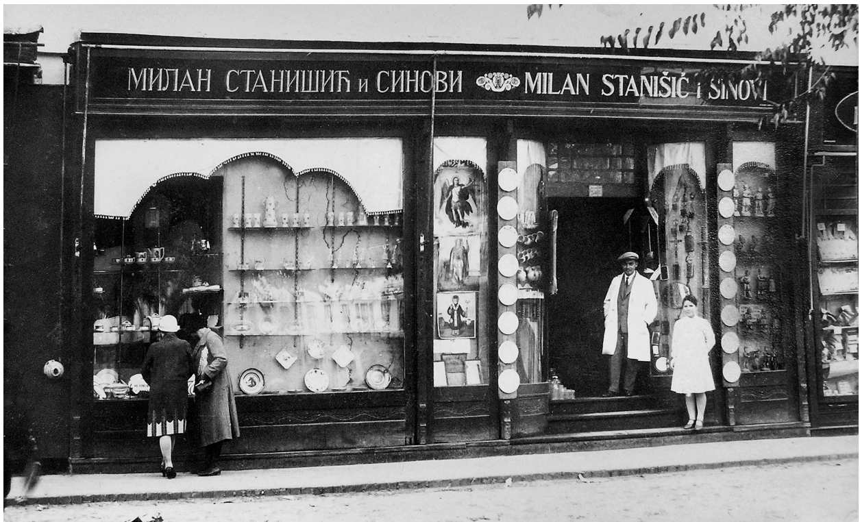
Ательє Станішич і сини. 1930-ті рр.