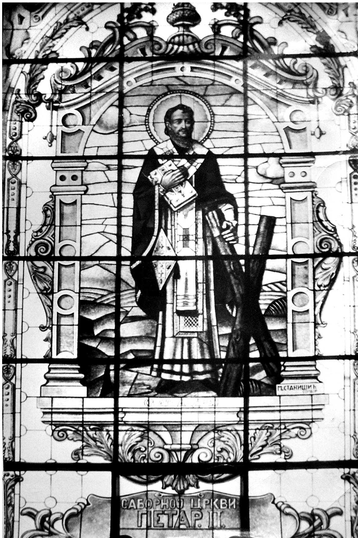
Святий апостол Андрей. Вітраж Соборної церкви Св. Архистратига Михаїла у Белграді. Петро Карплюк 1936 р.