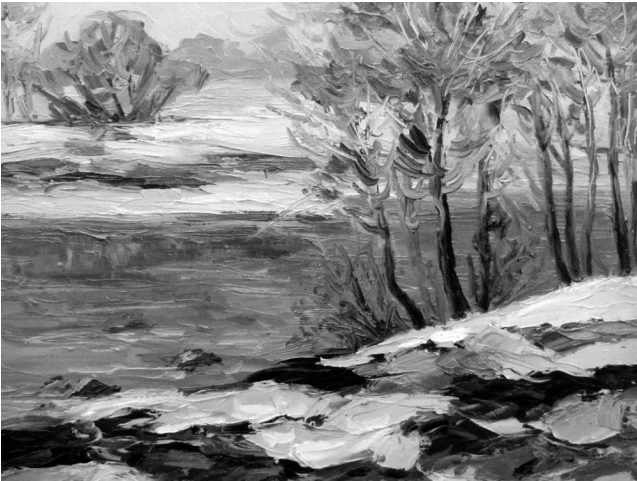
Юрій Скорупський. Зима. Замерзла ріка. 2004 р., олія, пол.