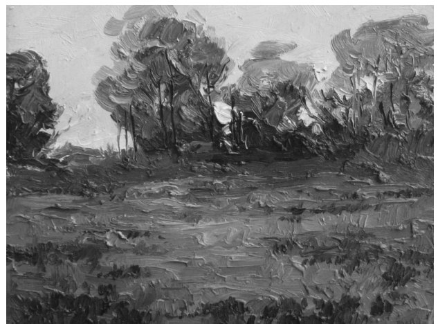
Юрій Скорупський. Літній день. 2008 р., олія, пол.