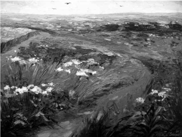
Юрій Скорупський. Поле квітів. 2003 р., олія, пол.