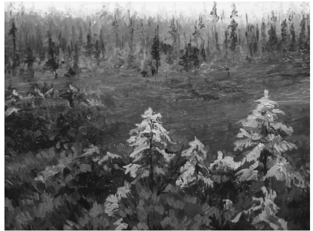
Юрій Скорупський. Ранок. 2008 р., олія, пол.

“Зима в Колорадо” є своєрідним твором. Він ніби знаходиться на межі стилів, в якому, окрім російської школи ХІХ ст., також відчувається і вплив традицій західноукраїнського (прикарпатського) живопису кін. ХІХ – серед. ХХ ст. Навіть є дещо імпресіоністична відвертість кольорів. Ті ж самі якості ми бачимо і в “Сніговій зимі” – чудовому творі, побудованому за певними законами пірамідальної композиції, з активним рухом по діагоналі, трикутними казковими засніженими ялинками, кущами із збереженими під снігом осінніми ягодами й листям, та ніжними барвами низького зимового неба.