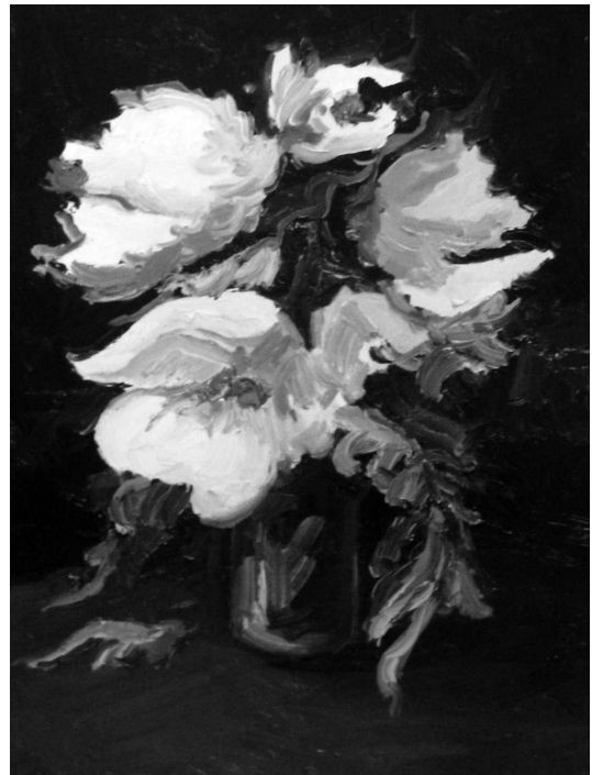
Юрій Скорупський. Квіти у вазі. 2007 р., олія, пол.