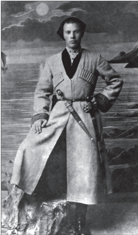
Іл. 5. Козак 1-го Гайдамацького куреня військ Центральної Ради в Одесі. Кін. 1917р. Національний музей історії України. Фонди. Інв. № ТКВ-11573/339/152