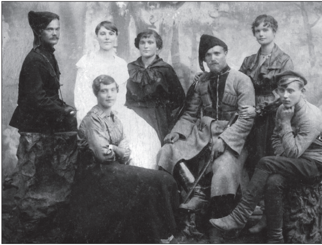
Л. 2. Старшини кінного полку Чорних запорожців з членами родин. 1919 р. Національний музей історії України. — Фонди. — Інв. № ТКВ-11573/33. Публікується вперше

останнім часом колекція світлин періоду Визвольних змагань, яку отримав на початку ХХІ ст. від української митниці Національний музей України у числі іншого конфіскату, затриманого на кордоні. Серед них фото старшин кінного полку Чорних запорожців з членами родин (1919 р.). Перший вояк зліва одягнений в традиційний чорний однострій полку, а на другому зліва — поверх чорного жупана (бешмета) під портупею — товста черкеска зі світло-сірого вовняного сукна з нагрудними нашивками, які імітують газирі. Бешмет має не тільки світлу облямівку по верху та низу коміра-стійки, а й подвійну стрічку, що охоплює шию, опускаючись до пояса. Неперевершений ансамбль однострою завершують українська чорна папаха з чорним шликом і чорні штани бридж до високих хромових чобіт. Ця унікальна світлина — напевно єдина серед оприлюднених, що так яскраво демонструє уніформу чорношличників.