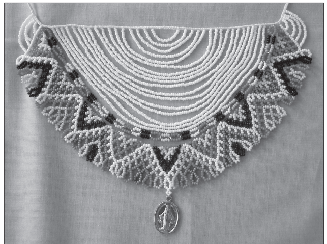
Сілянка. Бісер, нитки, набирання в разки, нанизування. 2007 р., Львів, творча студія Ірини Білик

бик, творчі пошуки яких базуються на спадщині українського народного мистецтва.