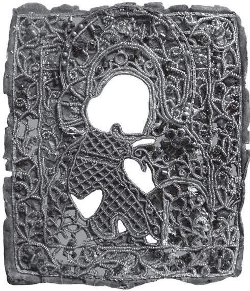
Шата ікони «Богородиця з дитям». Кінець XIX ст., Україна. Полотно, бісер, «шиття у прикріп по біллі». Національний Києво-Печерський історико-культурний заповідник, Т-5360