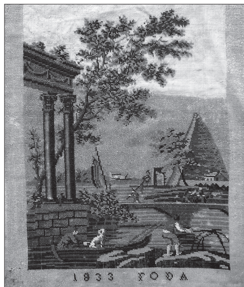
Картина (незавершена). Полотно, бісер, вишивання півхрестиком. 1833 р., Україна. Національний музей історії України, Т-5825