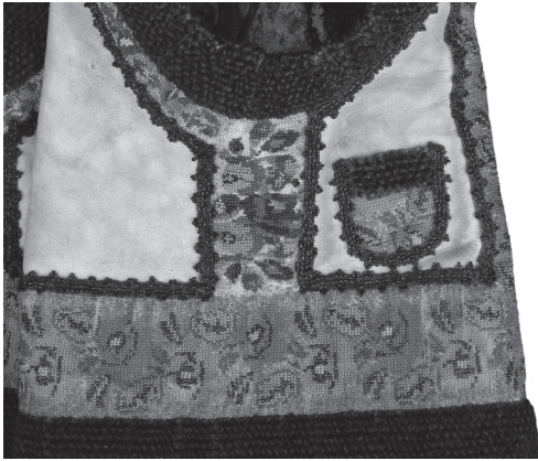
Хутряна безрукавка «кептарик». Вигляд збоку. 1930-ті рр., с. Великий Кучурів Сторожинецького р-ну Чернівецької обл. Овчина, бісер, січка, вишивання півхрестиком. Чернівецький обласний музей народної архітектури та побуту, ОДВ-1135

ся поширенням прийомів, запозичених із досвіду вишивання нитками («уперед голкою», «пів хрестиком»). Вишивання нитками й бісерними матеріалами розвивалося паралельно; ті і ті твори мали аналогічні композиційні схеми.