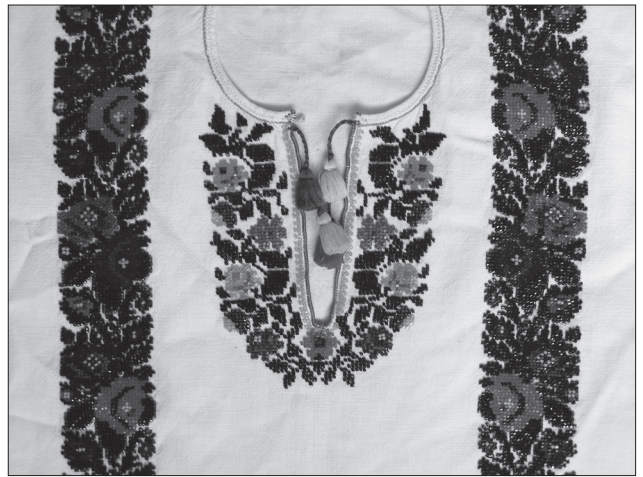
Сорочка жіноча. Фрагмент. Полотно, січка, бісер, вишивання півхрестиком. Кінець 1940-х рр., с. Звенячин Заставнівського р-ну Чернівецької обл. Чернівецький краєзнавчий музей, III—17001