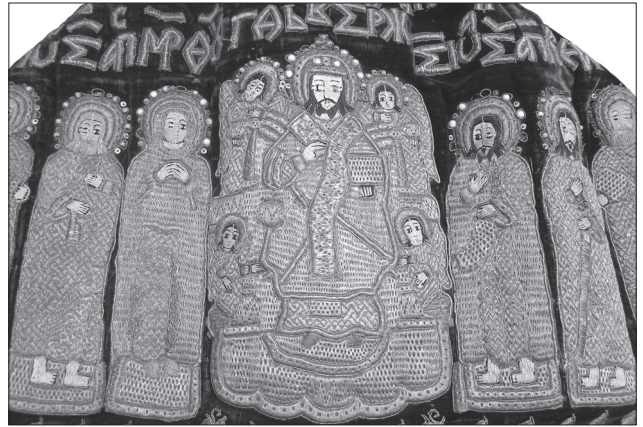
Фелон. Опліччя. Зелений оксамит, металеві та шовкові нитки, перли, лелітки, бісер, гаптування, шиття перлами та лелітками. XVII ст., Україна. ЧІМ, І-1197

XIX — середина XX ст. У першій половині XIX ст. продовжувала розв'язуватися дворянська маєткова культура, що природно пов'язувалася із загальними настроями романтизму. Зокрема, в українських помістях бісер та склярус використовували у виготовленні предметів обстави, які мали сприяти облаштуванню затишку та комфорту осель. Чимало вцілілих пам'яток, що нині зберігаються в музейних колекціях, географічно віддалених, Львова, Києва, Чернігова та інших українських міст, засвідчують поширеність, як також багатогранність явища: вишиті бісером картини [3; 11; 2; 18], панно, чохла на меблі [55, іл. 39—42], вишиті та вив'язані з бісеру чохла для побутових речей [12], обкладинки для записників та книжок [7; 13], подушечки для голок [6] тощо. Найтипівішими для цілого століття творчості з бісером стали картини з вишитими романтизованими пейзажами або сюжетними композиціями на тлі тих таки пейзажів,