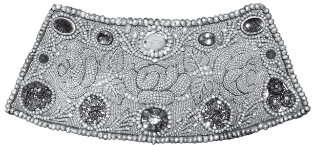
Поруч. Тканина, перли, золото, діаманти, рубіни, сапфіри, аметисти, скло, шиття по формі «у прикріп по карті». Кінець XVII ст., Україна. Музей історичних коштовностей України, ДМ-5983