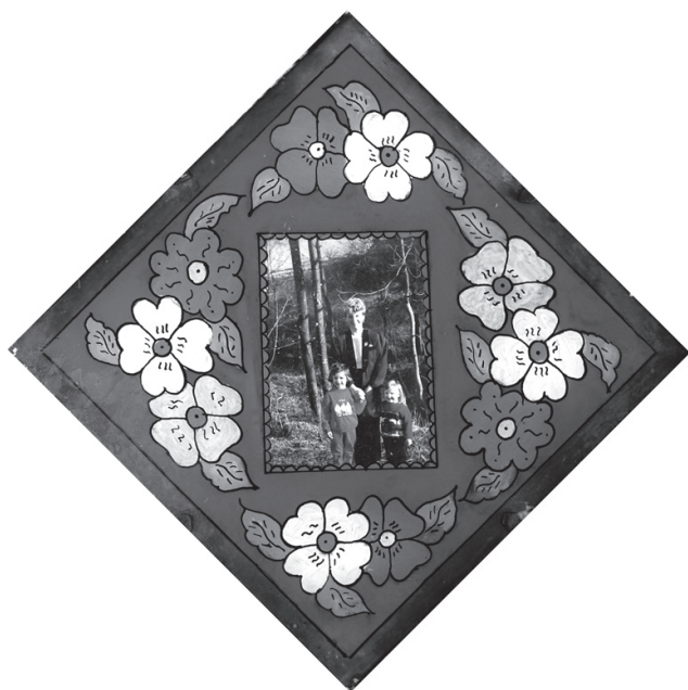
Грицовляк Дмитро Васильович. Скляна рамка з декоративним розписом. 1950-ті рр. С. Річка Міжгірського р-ну Закарпатської обл. 2010 р.