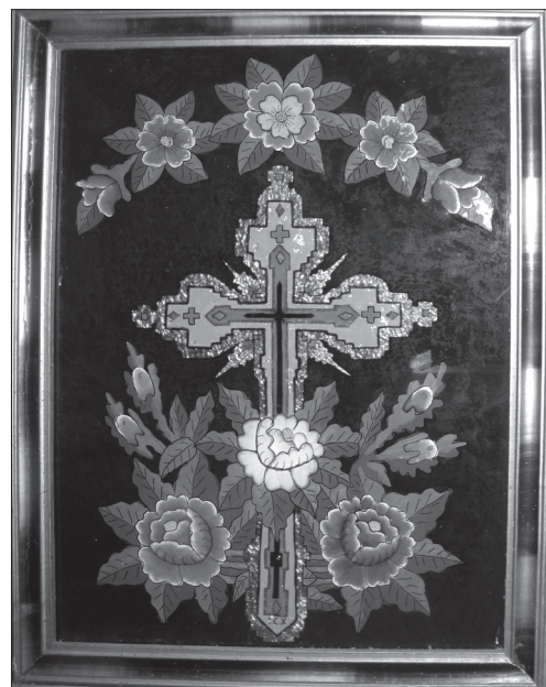
Ікона на склі «Хресту Твоєму поклоняємося, Владико...». Середина — друга половина ХХ ст. зі с. Рудники Підгаєцького р-ну. Підгаєцький районний краєзнавчий музей.