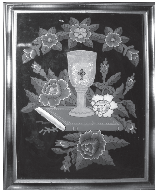
Ікона на склі «Пресвята Євхаристія» («Чаша і Євангелія»). Середина — друга половина ХХ ст. зі с. Рудники Підгаєцького р-ну. Підгаєцький районний краєзнавчий музей. 2011 р.