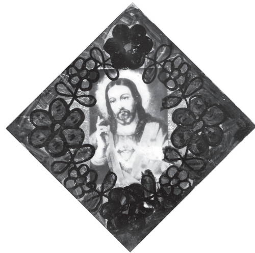
Скляна рамка з декоративним розписом — обрамлення для ікони-фотокопії «Пресвяте Серце Ісуса Христа». Середина — друга половина ХХ ст., с. Монастирок Борщівського р-ну Тернопільської обл. Фото автора 2011 р.

звідти, — як Коломия, як Косів» 40 ; «привозили, певно, з Франківщини» 41 .