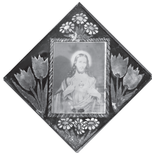
Скляна рамка з декоративним розписом — обрамлення для ікони-фотокопії «Пресвяте Серце Ісуса Христа». Привезена у 1945—1946 рр. зі с. Хотинець Ярославського повіту (тепер — територія Польщі), с. Трійця Борщівського р-ну Тернопільської обл. Фото автора 2011 р.

Крім фіксації артефактів, важливу частину польових досліджень складають результати опитування місцевих мешканців, що дають змогу уточнити хронологічні межі та особливості розвитку «вторинної етномистецької традиції». Її появу респонденти датують кінцем 1930-х — 1940-ми рр. Це підтверджується згадками про продаж творів малярства на склі у 1935—1940 рр. у крамницях міста Бережан 20 ,