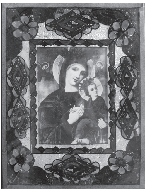
Скляна рамка з декоративним розписом — обрамлення для ікони-фотокопії «Божа Мати Неустанної Помочі». Середина — друга половина ХХ ст., с. Монастирок Борщівського р-ну Тернопільської обл. Фото автора 2011 р.

були такі образки. Се... обмальовували кругом і прикладали образок, і фольга була» 23 . Серед інформа-