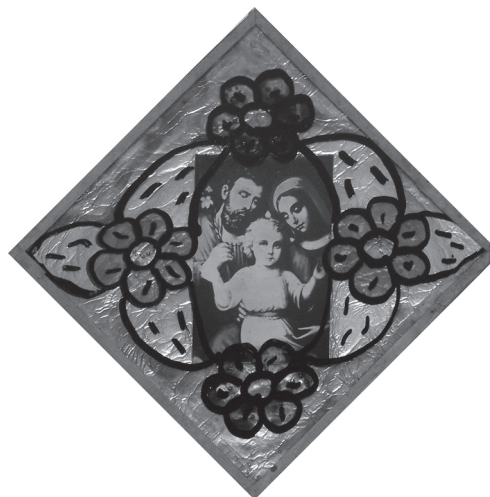
Скляна рамка з декоративним розписом — обрамлення для ікони-фотокопії «Свята Родина». Середина — друга половина ХХ ст., с. Губин Бучацького р-ну Тернопільської обл. Фото автора 2011 р.