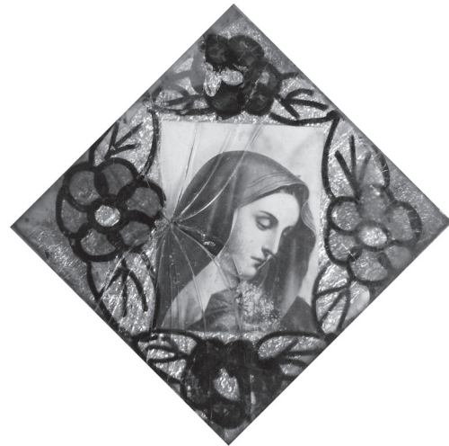
Скляна рамка з декоративним розписом — обрамлення для ікони-фотокопії «Страждальна Мати». Середина — друга половина ХХ ст., с. Шутроминці Заліщицького р-ну Тернопільської обл. Фото автора 2011 р.