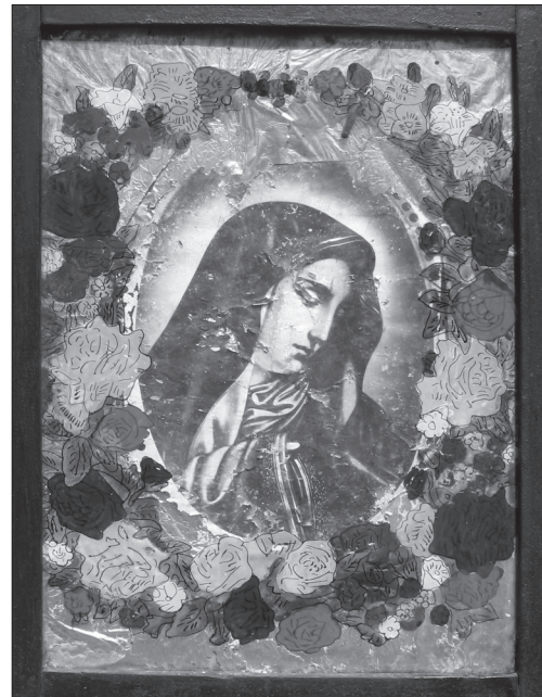
Скляне декоративне обрамлення з розписом для ікони-фотокопії «Страждальна Мати». Середина — друга половина ХХ ст., с. Щепанів Козівського р-ну Тернопільської обл. Фото автора 2011 р.

на плаче...» (1970—1980-ті); «Різдво Христове», «Свята Родина» (2007—2008) та інші.