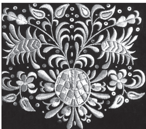
Гаптована торбинка з виставки «Кримський стиль» (2007)

мування творчості професійних митців і в майбутньому становлення сучасної національної художньої школи. Виставка показала органічну єдність форми і декору у виробках з глини, металу і дерева, продемонструвала багатство тканих орнаментальних тканин, поліхромні вишиті та гаптовані вироби, що вирізнялися самобутнім колоритом, яскраво вираженою національною своєрідністю.