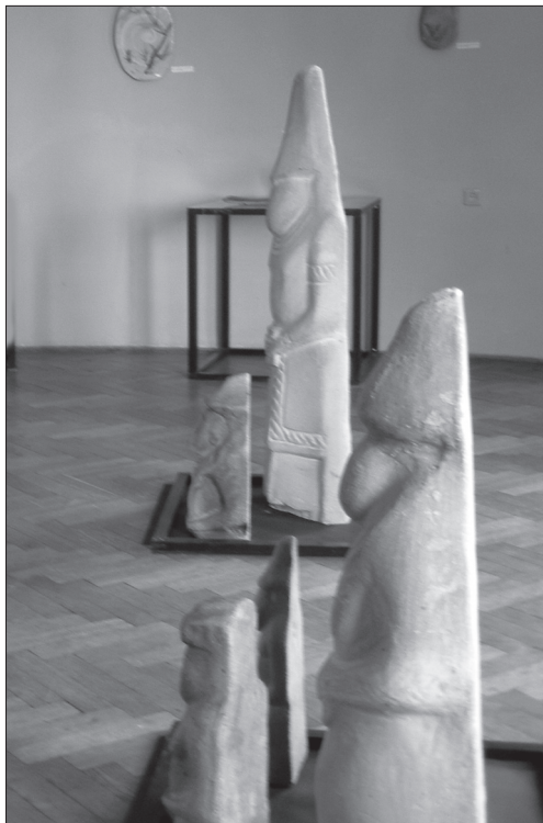
Фрагмент експозиції «Половецькі баби» (2009)

Огляд виставкової роботи 1992—2011 рр. дає змогу стверджувати, що сучасне професійне декоративно-ужиткове мистецтво не втрачає актуальності. На рівні з іншими видами пластичних мистецтв воно прагне усвідомити свою важливу роль у сучасній культурі як суттєвого фактора гуманізації середовища, намагається гнучко реагувати на тенденції, що з'являються у сучасному мистецтві [42, с. 25].