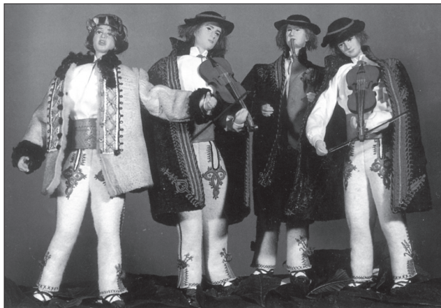
Фрагмент експозиції «Ляльки Польщі. Ляльки світу» (Польща, 2003)