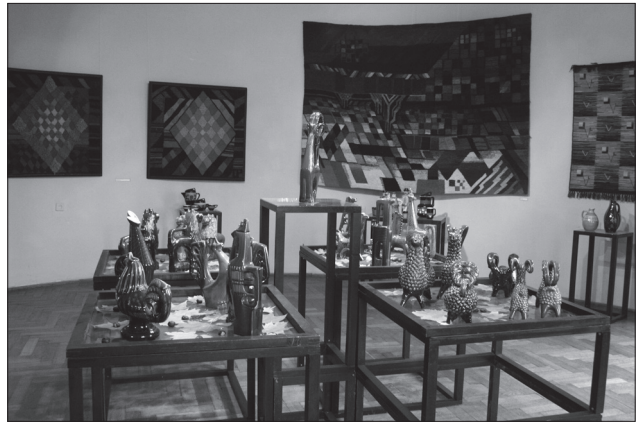
Фрагмент експозиції «Львівський феномен» (2006)

Львів'яни та багаточисельні гості нашого міста мали змогу побачити в експозиційних залах Музею справжню перлину музейної збірки, сформованої по-