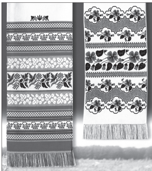
Вишивані рушники Г. і С. Махонюків на виставці «Нев'янучий сад» (2007)