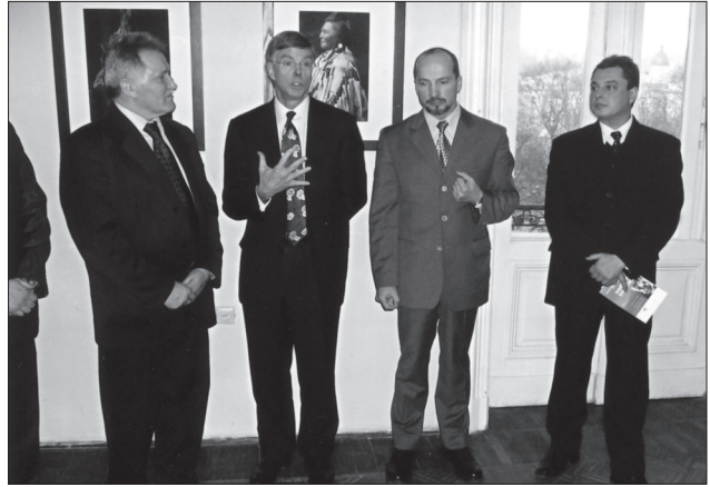
Відкриття виставки «Священна спадщина: Едвард С. Куртіс і північно-американські індіанці» за участю посла США в Україні Вільяма Тейлора (2008)

Окремо виділимо виставку молодих чернівецьких фотографів, організовану українсько-австрійським центром співробітництва з питань науки, освіти та культури та фондом Роберта Боша (Україна — Австрія, 2006). Характер плідного співробітництва відображали експозиції — «По обидві сторони кор-