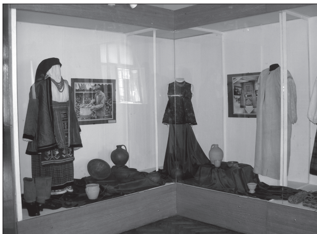
Фрагмент експозиції «Біль Чорнобиля: роки і долі» (2006)

на якій демонструвалися високомистецькі церковні обрядові твори [5, с. 533].