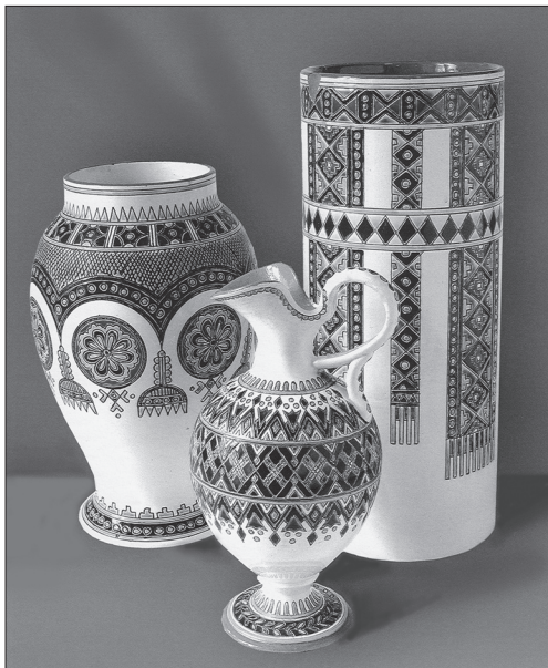
Фрагмент експозиції виставки «Іван Левинський і його час» (1993)