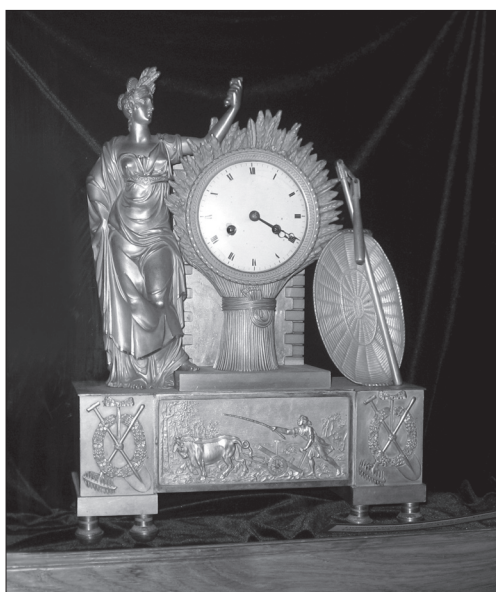
Фрагмент експозиції «Європейські годинники XVI—XX ст.» (2006)

Високо мистецькі зразки народів Арабського Сходу, Ірану та Центральної Азії, зібрані у музеях Львова — МЕХП (переважна більшість творів), ЛІМ, ЛГМ та ЛМІР було представлено на великій атракційній виставці «Мистецтво Ісламу» (2001, куратор — Олександр Ляшенко). Демонструвався одяг XVIII—XX ст. з Аравії та Узбекистану, вишукані зразки іспано-мавританської, іранської та турецької кераміки, народної кераміки з Єгипту та Сирії. Привертали увагу ткані вироби мусульманського світу, де часто орнамент поєднаний з написом арабською вязю. Витонченим оздобленням виділялися вироби з металу і, зокрема, зброя, інкрустована сріблом і золотом та декорована карбуванням, гравіруванням, орнаментальними вставками з кістки і коралу. Фрагменти