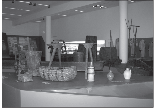
Фрагмент експозиції «Чорнобиль. Експедиція в загублений край» (Фрайбург, Німеччина, 2011)

Досвід останніх двадцяти років підтверджує, що виставкова робота є одним з важливих напрямів діяльності МЕХП ІН НАН України. В умовах незалежної держави, активізації її спілкування з навколишнім світом особливого значення набули підготовлені на основі багатих фондів збірок міжнародні проекти, презентації яких здійснювалися у багатьох країнах світу, а, з іншого боку, по-