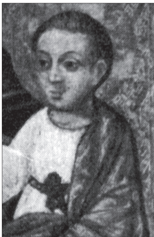
Іл. 8. Фрагмент неіснуючої ікони з с. Ріпнів Буського р-ну Львівської обл.

льовані рукою одного майстра, вправленого в авторських пропорціях. Спостерігаємо певні іконографічні розбіжності в розміщенні гіматія в зображенні Дитяти Ісуса. На ріпнівській і монастирській