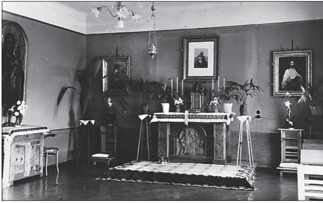
Лл. 13. Вигляд відновленої в 1936 році каплиці при промисловій школі сестер Василянок на вул. Длугуша, 17 у Львові