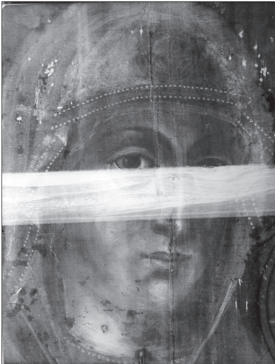
Іл. 4. Фрагмент ікони з Львівського монастиря сестер ЧСВВ (відбитка рентгенівського знімка)