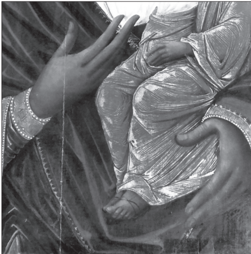
Іл. 10. Фрагмент ікони з м. Буська Львівської обл.

середній пальці складені разом, а в монастирській іконі вони — на відстані. Щоправда, зображена на рентгенограмі рука Богородиці пластикою світлотінньового вирішення злегка вказує на високо-професійні зразки кінця XVI століття.