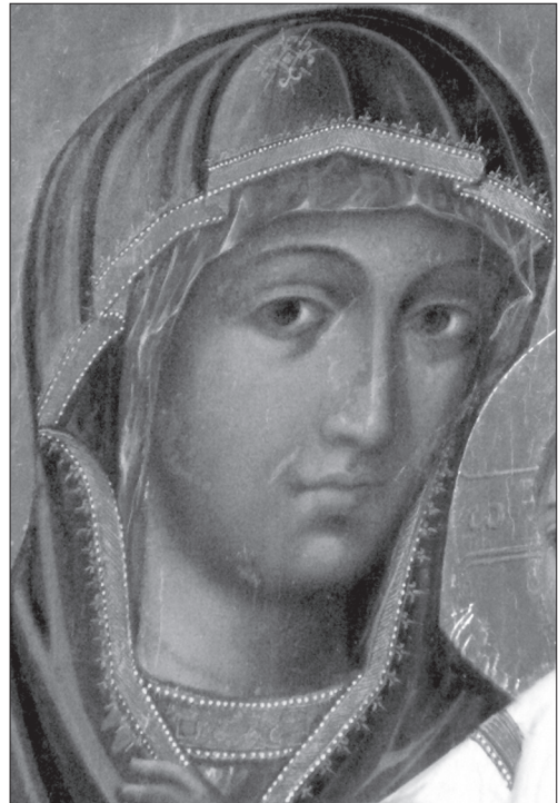
Іл. 5. Фрагмент ікони з м. Буська Львівської обл.

гаємо яскраво виражену однотипність основних авторських ознак ікон. Особливо зближеними є фрагменти монастирської і буської ікон. Найперше зауважуємо образну однотипність погляду Богородиці, створеного авторським розміщенням і пропорціями основних деталей лику та м'яким світлотіньовим прописуванням — охрінням. Порівнюючи форму прорізу очей, розміщення і форму перенісся, носа, уст — спостерігаємо авторську наближеність. Ідентично проходить у трьох іконах середня лінія та кутики уст, прописи підборіддя, овал лиця. Графіка драперій мафорію перегукується в іконах з Ріпнева і з Буська. Зображення оздоблюючої облямівки мафорію у трьох іконах вирішено однаково. На жаль рентгенограма монастирської ікони не подає чіткої графіки складок мафорію Богородиці. Припускаємо, що ми бачимо запис пізнішого часу, оскільки перше зображення з певних причин не збереглося. В даному випадку мафорій лягає м'якше, з більшою схильністю до натуралізму у відображенні.