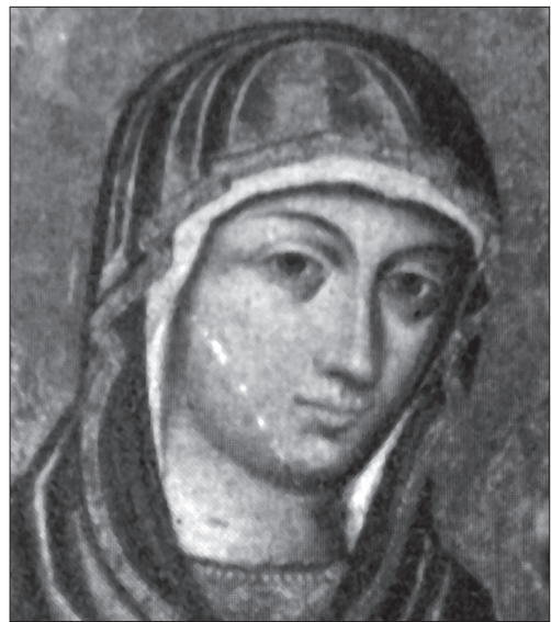
Іл. 6. Фрагмент неіснуючої ікони з с. Ріпнів Буського р-ну Львівської обл.

Цікавим моментом для порівняння є поясне зображення Дитяти Христа на трьох іконах — буській (Іл. 7), ріпнівській (Іл. 8) і монастирській (Іл. 9). На нашу думку, цей фрагмент ще яскравіше вказує, що всі три ікони належать одному майстру.