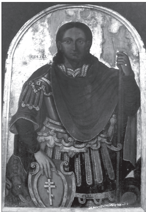
Іл. 3. Ікона Св. Муч. Юрія (знаходиться в ЛНМ ім. А. Шептицького)