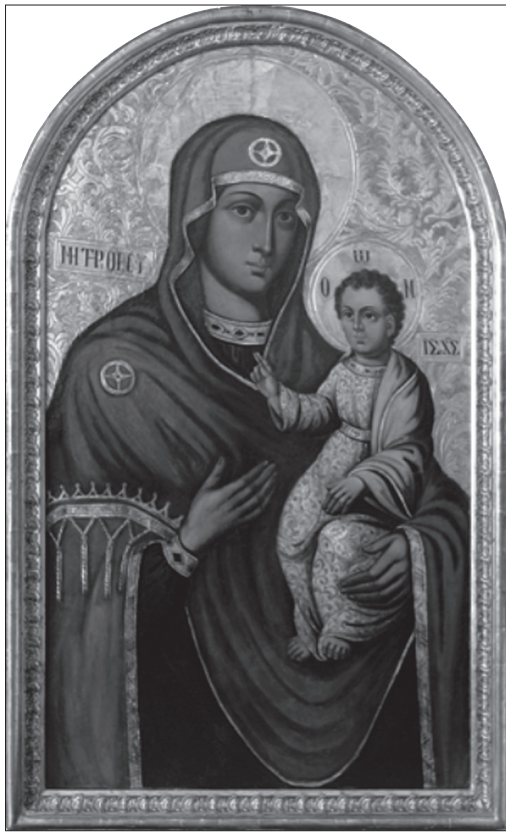
Іл. 1. Ікона Богородиці Одиґітрії з монастиря сестер ЧСВВ у Львові