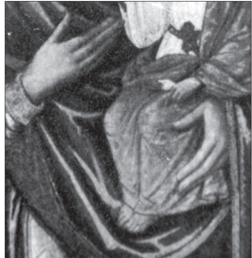
Іл. 11. Фрагмент неіснуючої ікони з с. Ріпнів Буського р-ну Львівської обл.

Фрагментарне порівняння основних моментів авторського почерку трьох згаданих ікон підводять до висновку, що вони створені тим самим малярем у невеликому проміжку часу. Тобто автору ріпнівської ікони, що залишив підпис — «ВО ЛЬВОВІ Р.Б. АФЧО (1599) ФЕДОР» [26, с. 346] належать ще дві вперше досліджувані ікони Богородиці Одигітрії: з м. Буська Львівської області, та з монастир-