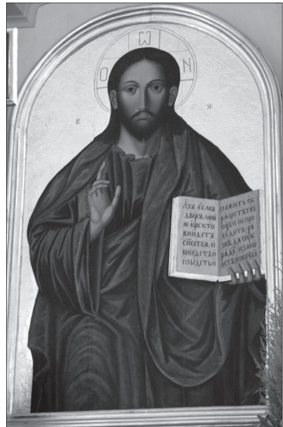
Іл. 2. Ікона Спаса з ц. Івана Богослова в с. Зимна Вода біля Львова