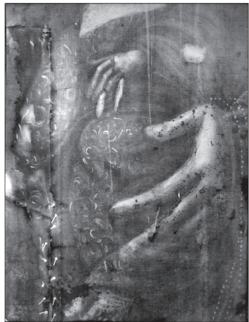
Іл. 12. Фрагмент ікони з Львівського монастиря сестер ЧСВВ (відбитка рентгеновського знімка)

ської каплиці Сестер Василянок у Львові, що належала до іконостасу собору Святого Юра у Львові.