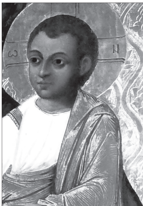
Іл. 7. Фрагмент ікони з м. Буська Львівської обл.