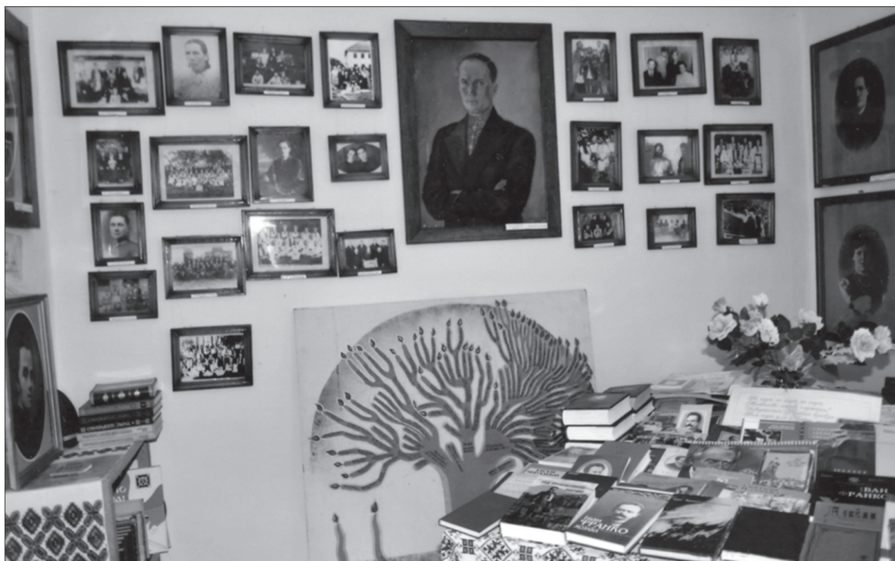
Інтер'єр музею (внизу художньо-графічне зображення генеалогічного дерева Івана Франка, яке налічує бл. 360 осіб)