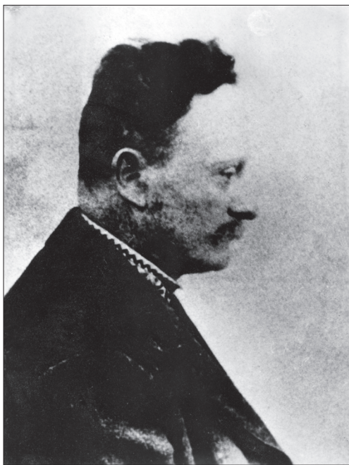
Іван Франко. 1904. Маловідома фотографія роботи Ф. Вовка