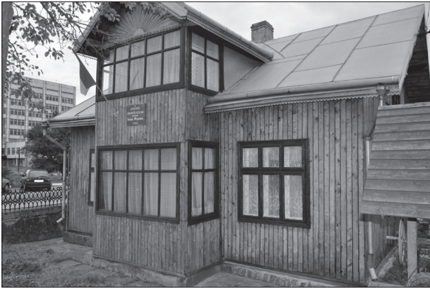
Музей Івана Франка в Калуші. 2012