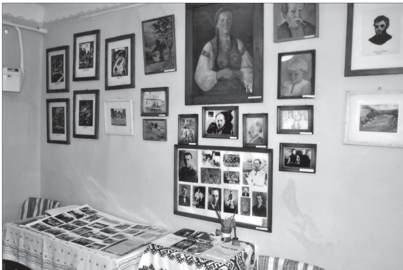
Картини Григорія Смольського в Музеї