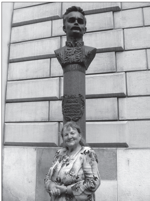
Пам'ятник Іванові Франку у Відні. 2010 р. Публікується вперше