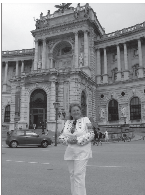
Центральна наукова бібліотека у Відні, де готувався до захисту дисертації Іван Франко (фото 2010 р.)

«Іван Франко» «збороздив» моря й океани світу, а після відправлення судна на заслужений відпочинок портрет був подарований до Музею [9, с. 5].