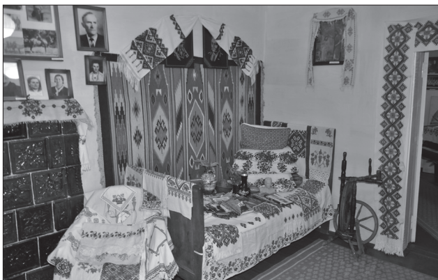
Інтер'єр Музею. Родинні етнографічні речі. 2012 р.