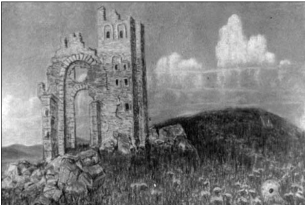
Іл. 4. Золоті ворота. 1920 рік. Пастель 17, 5 x 25, 5

кувались у журналі «Шлях», у видавництві «Грунт», він був членом Товариства діячів українського мистецтва, Всеукраїнського комітету охорони пам'яток мистецтва та старовини. Згодом Юхим Михайлів став головою Київської філії Асоціації художників Червоної України (АХЧУ). Працював у художньо-промисловому відділі при комісаріаті мистецтв, а згодом став членом колегії Всеукраїнського відділу мистецтв Народного комісаріату освіти (Наркомосу). З 1920 року Михайлів став членом мистецької ради Київської Художньої Академії, викладав у Київському вищому інституті народної освіти ім. М. Драгоманова (тепер Київський університет). В 1921-му очолив Комітет пам'яті Миколи Леонтовича, до якого також входили Гнат Хоткевич, Лесь Курбас, Борис Лятошинський та інші видатні діячі. Митець багато працював і на мистецтвознавчій ниві. Упродовж 1920—1930-х Михайлів друкував свої статті та рецензії у «Бібліологічних вістях», «Житті й революції». Виходять друком