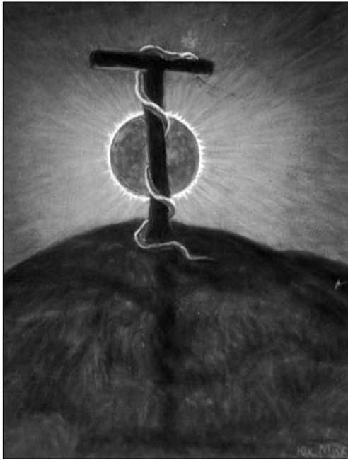
Іл. 7. Мій сон. 1921 рік. Пастель 18 x 22