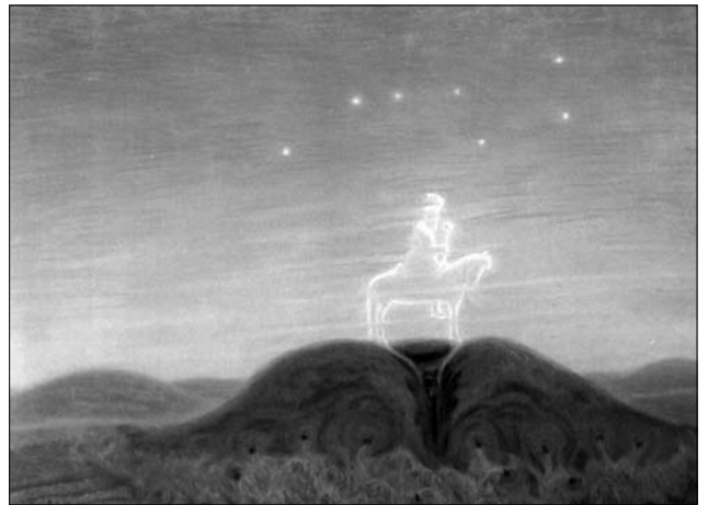
Іл. 2. Зруйнований спокій. 1916 рік. Пастель 18 x 23,5

музика, малярство немов проростають одні в одних, являючи неповторні взірці тісної взаємодії різних його видів, що дає підстави говорити про певні явища синкретизму [7, с. 25].