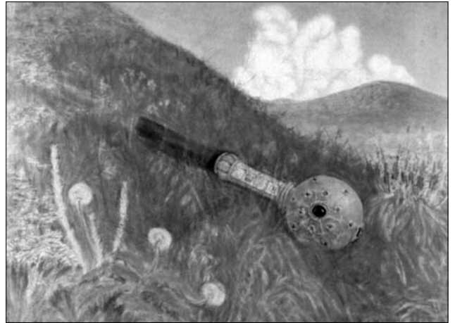
Іл. 5. Загублена слава (Булава). 1920 рік. Пастель 17 x 25

Творче обличчя Михайліва як символіста найповніше виявляється в трьох темах, що заволоділи увагою художника. Першу з них можна назвати темою національного відродження. Тема ця розкривається в