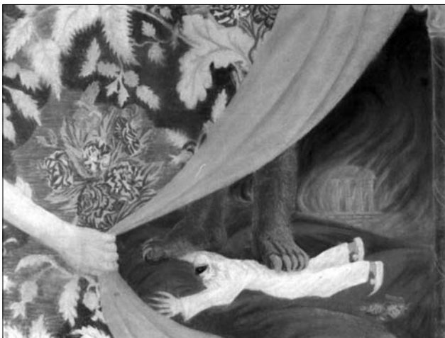
Іл. 8. За завісою життя. 1923 рік. Пастель 18,5 x 24

на переплетенні реального і фантастичного, що є органічним для традиції символізму, яка уособлює єднання уявного і реального світів. Конкретний природний мотив у кожній з частин триптиху трансформується в узагальнену картину — образ минулого, реальний час якого проникнутий явищами нереальними, позачасовими — присутністю Духа, персоніфікованого в образі юнака-ангела [7, с. 43].