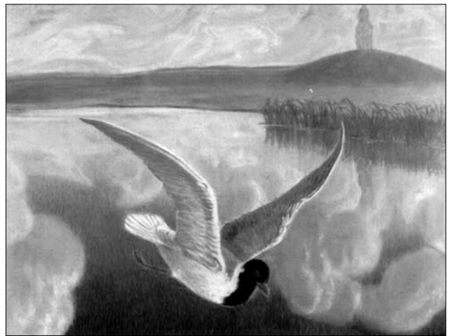
Іл. 6. Чайка. 1923 рік. Пастель 17,5 x 23

характерних для художника рисах музичного символізму.