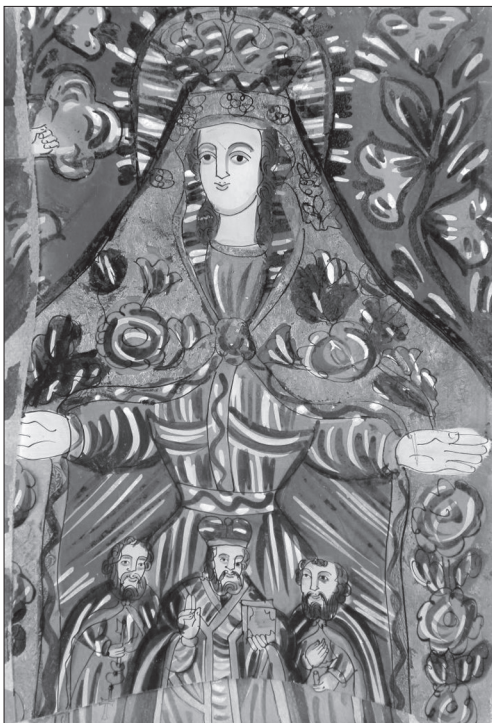
Іл. 5. Покров Пресвятої Богородиці (фрагмент), НМЛ І-3927, 50625. Третя чверть ХІХ ст., 30х19,5 см, скло, розпис, позолота. Гуцульщина

ставлено чотири групи карпатських ікон: ранні твори, богородчанські, група «чорних і білих штрихів», «червоні образи» (за вже існуючим розподілом ікон на склі на часові та стилістичні групи [8, с. 22]).