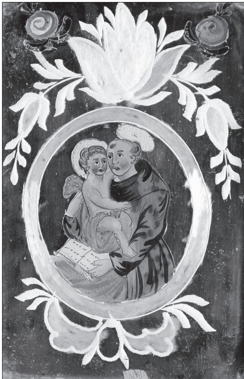
Іл. 12. Св. Антоній Падуанський, НМЛ І-723, № 17094, поч. ХІХ ст., Північно-чеська склярська обл., 24,5х18 см, скло, розпис, позолота, подзеркалення. Походить з с. Ар-тасів Жовківського р-ну Львівської обл.