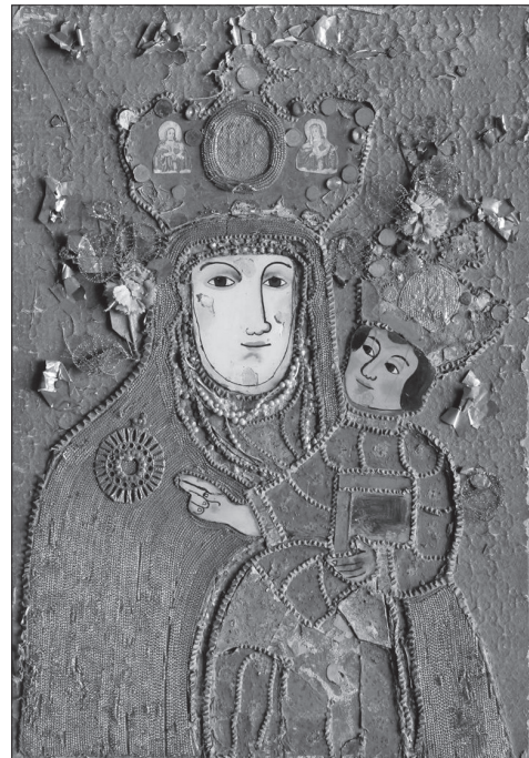
Іл. 15. Богородиця Одигітрія Лежайська, НМЛ І-582,15511, кін. XIX ст., Лежайськ (?), Польща, 51x35,5 см (6/р), дошка, комбінована техніка. Походить з с. Терло Самбірського р-ну Львівської обл.

Богородиці Лежайської , декоративні підвіски ( Пієта ), одяг Ісуса ( Св. Антоній , НМЛ І-2748, іл. 9), корони Богородиці та Ісуса ( Богородиця з Дитям ).