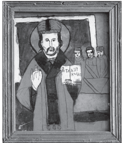
Іл. 17. Св. Миколай, НМЛ І-590, № 15599, друга пол. XIX ст., с. Нікула (?), Румунія, 35,5x25 см, скло, розпис, позолота. Походить з Закарпаття

Ще одним прикладом ремісничо-народного виробництва другої половини XIX — початку XX ст. є дзеркальні «ченстоховські» образи. На всіх іконах представлена Богородиця Ченстоховська — на двох відтворений чудотворний образ (НМЛ І-526, іл. 14, НМЛ І-527), на третьому — Богородиця Ченстоховська і двоє святих (НМЛ І-548). Невеликі за розміром, у декоративній рамці, ці твори, очевидно, були вишуканими пам'ятками з прощі на Святу Гору. Вони відрізняються від продукції інших осередків складною поетапною технікою виготовлення: зі звороту за трафаретом посріблене тло, потім старанно вимальовані лики і руки. Після цього — нанесений