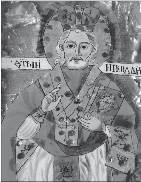
Іл. 18. Св. Миколай, НМЛ І-581, 15421/4, друга пол. ХІХ ст., Румунія, 30х24х1,5 см, скло, розпис, позолота. Походить з с. Новосілки Передні (Рава-Руська) Жовківського р-ну Львівської обл.

самі лики мають різний інкарнат та легко промодельовані світлотінню. У Сяноцькому музеї зберігається артефакт, виконаний з аналогічних матеріалів [15, с. 75, іл. 42]. Старанність, трудомісткість і складність роботи вказує на те, що ікона, ймовірно, створена в майстернях Лежайського монастиря.