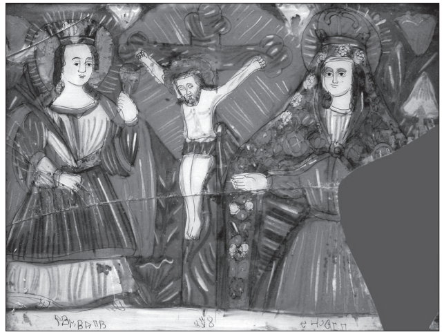
Іл. 3. Св. Варвара, Розп'яття, Покров Пресвятої Богородиці, НМЛ І-3925, 50623. 1872?/1876? р., 40x50,5 см, скло, розпис, позолота. Походження невідоме

Взірцем були графічні видруки — за ними рисували шаблони-прориси, які підкладали під скло. Прозорість скла уможлиблювала легко скопіювати зображення — його розмальовували, вкінці потрібні площини золотили. Малярі повторювали підклад з більшою або меншою точністю, тому ікони на склі — це, по суті, різні іконографічні інтерпретації вибраних сюжетів, доповнені орнаментами та іншими допоміжними елементами. Завдяки технологічним особливостям такі твори завжди ефектні — їм притаманний поверхневий блиск, глибина кольору,