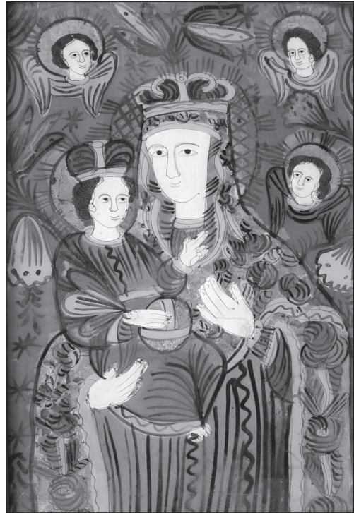
Іл. 6. Богородиця Одигітрія, НМЛ І-864, 30632, ост. чверть XIX ст., 76x53,5 см, скло, розпис, позолота. Походить з с. Криворівня Верховинського р-ну Івано-Франківської обл.

Унікальним є зображення св. Миколая у повний зріст (іл. 2) — це єдиний твір на склі, виконаний за