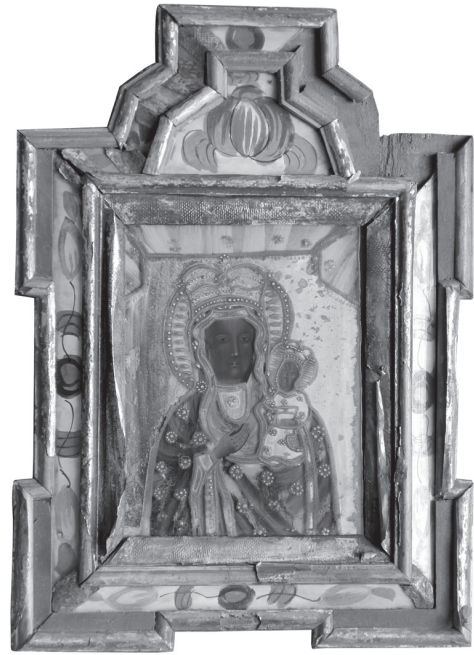
Іл. 14. Богородиця Ченстоховська, НМЛ І-526, 14536/1, перша пол. XIX ст.?, Ченстохова (?), Польща. 25,6x18,7 см, скло, розпис, подзеркалення. Походить з Кам'янка Бузька, Львівська обл.

У деяких творах використане біле та кольорове «крапкування», яким позначені разки намиста на шії