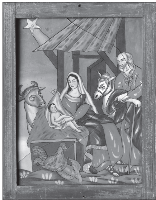
Іл. 7. Різдво Христове, НМЛ І-542, 14804, друга пол. XIX ст., 46x36 см, скло, розпис, золота фольга. Походить з с. Залуччя (Яворів) Львівської обл.

іконографією, близькою до церковних ікон на дереві. Образ написаний за лемківським дереворитом, з якого маляр запозичив основну схему — відтворив