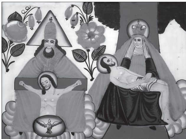
Іл. 13. Св. Трійця, Пієта, НМЛ І-399, 12315, третя чверть ХІХ ст., с. Погоржі-Сандл, Південна Чехія / Австрія, 29х40 см (б/р), 35,5х45,5 см, скло, розпис, позолота. Походження невідоме

що за своєю суттю нагадує штрихи різця на народних дереворитах. Друга причина полягає у декоративному використанні кольору — оперуючи п'ятьма-шістьма барвами, їх використовували за принципом контрастного співставлення: червоний поєднували із зеленим, блакитним, жовтим, білим, позолотою. На-