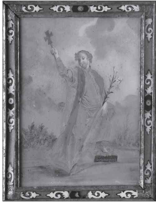
Іл. 10. Св. Станіслав (Костка), НМЛ І-547, 14989/3, 1780—1800 рр., Аугсбург, Баварія, 25,5x18 см (б/р), скло, розпис. Походить з с. Вислобоки Кам'яно-Бузького р-ну Львівської обл.

ISSN 1028-5091. Серія мистецтвознавча. № 6 (120), 2014