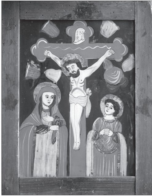
Іл. 1. Розп'яття з Присяжними, НМЛ І-3462, 49065, сер. ХІХ ст., 37х29,5 см, скло, розпис, посріблення. Походить з с. Нижній Березів Коломийського р-ну Івано-Франківської обл.