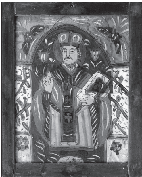
Іл. 2. Родина Німчиків (?). Св. Миколай, НМЛ І-578, 15420/1, середина — третя чверть ХІХ ст., м. Богородчани (?), Івано-Франківської обл., 54х43,5 см, скло, розпис, позолота. Походить з Калуського р-ну Івано-Франківської обл.

ри подаровані владикою образи на склі походять з Калущини на Львівщині.