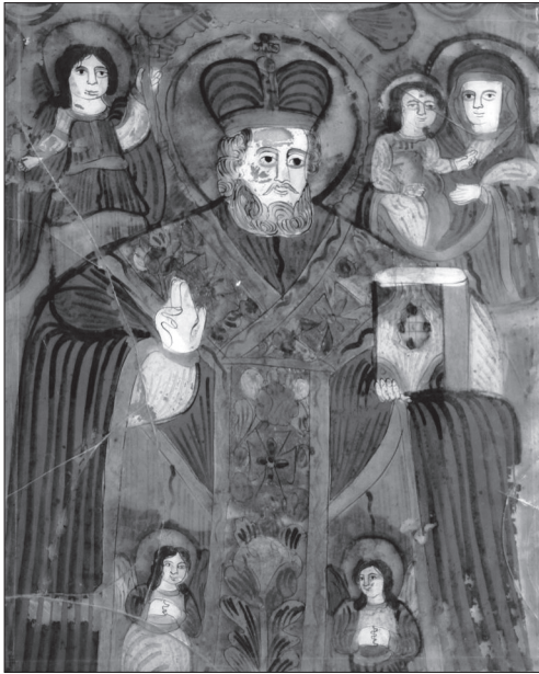
Іл. 4. Св. Миколай, Іван Хреститель, Богородиця Одигітрія, НМЛ, І-862, 30630, остання чверть ХІХ ст., 58х48 см, скло, розпис, позолота. Походить з с. Краснотавець Снятинського р-ну Івано-Франківської обл.