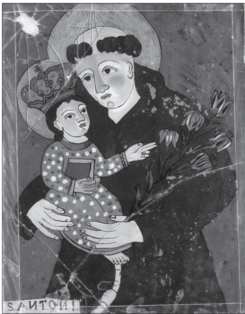
Іл. 9. Св. Антоній Падуанський, НМЛ І-2748, № 39677, друга пол. ХІХ ст., 36,5х29 см, скло, розпис. Походження невідоме

святого в арковому обрамленні, проте знехтував окремими деталями [8, с. 22]: випустив з уваги єпископський жезл, орнамент облачення тощо.