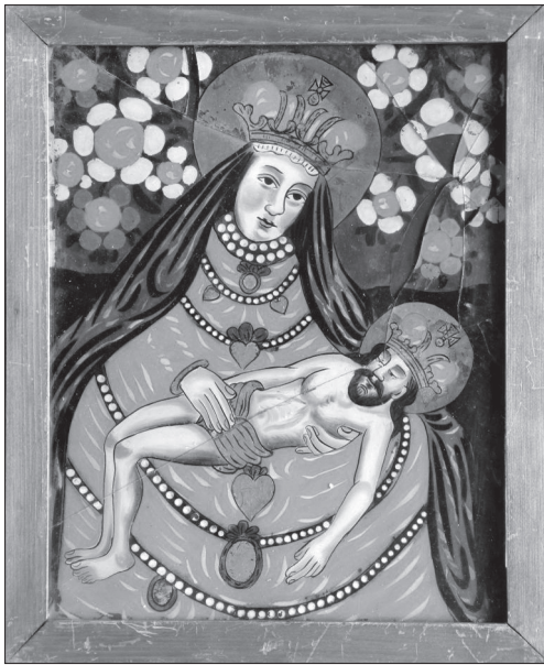
Іл. 8. Пієта, НМЛ І-524, 14407, ХІХ ст., 44,5х36,5 см, скло, розпис, позолота. Походить з с. Березів (Хирів) Самбірського р-ну Львівської обл.