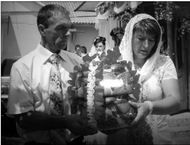
Випроводження молодої до шлюбу, с. Ганьківці Снятинського р-ну Івано-Франківської обл. 2015 р.

у білу хустку один на одному, приходили кожен дружба та дружка (с. Рожнів) [7, с. 431].