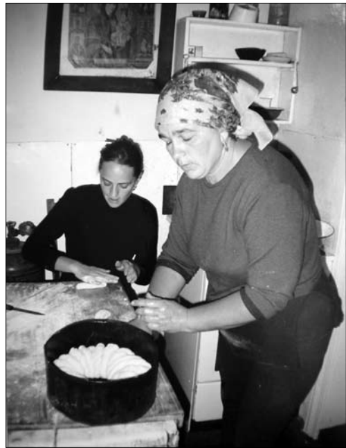
Приготування «колача», с. Прутівка Снятинського р-ну Івано-Франківської обл. 2015 р.

Порядок компоновання елементів з тіста зумовлюється формою калача. На кільцеподібних «колачах» використовується вінкоподібна композиція, в