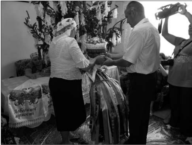
Благословення молодої «колачами», с. Підвисоке Снятинського р-ну Івано-Франківської обл. 2015 р.