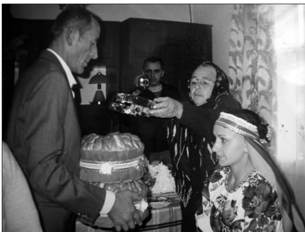
Вінок на «колачеві». 1. Село Підвисоке Снятинського р-ну Івано-Франківської обл. 2015 р. 2. Село Прутівка Снятинського р-ну Івано-Франківської обл. 2015 р.

дяка, батьтя та матки (осіб, які вінчають — тримають свічку під час шлюбної церемонії, матка також шие вінок) (сс. Ілліці, Орелець) [6, с. 182; 21, с. 198]. В окремих місцевостях після запрошення всіх гостей, зібравшись в умовленому місці, з жартами та сміхом «колачі», з якими ходили, дружки розривали та частували ними всіх зустрічних (с. Рожнів Косівського р-ну Івано-Франківської обл.) [7, с. 432].