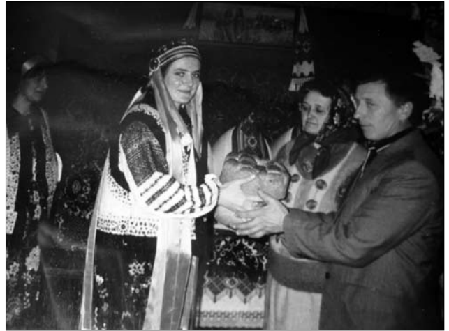
Зустріч молодої після шлюбу, с. Орелець Снятинського р-ну Івано-Франківської обл. 2015 р.

На Покутті двома «колачами» і топкою солі зустрічали молодих у домі молодого; дотулялися хлібом та сіллю до їхніх схилених голів, після цього молода брала хліб та сіль і клала до своєї скрині (сс. Городниця, Ясенів Пільний Городенківського р-ну Івано-Франківської обл.) [27, с. 268, 284].