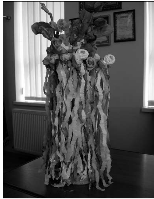
«Теренки», с. Острівець Городенківського р-ну Івано-Франківської обл. 2016 р.