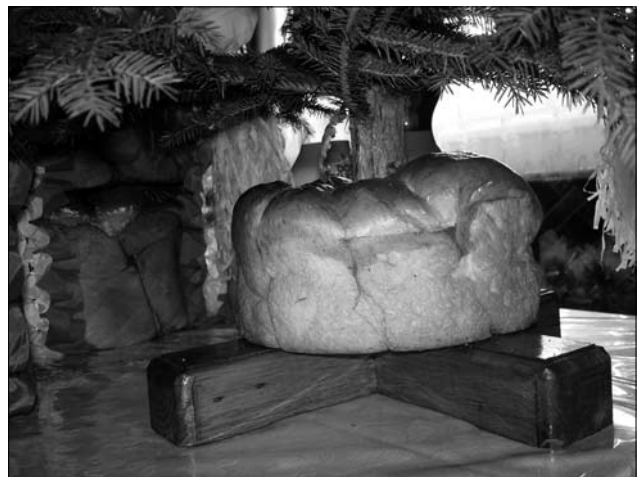
«Деревице», с. Долішне Залуччя Снятинського р-ну Івано-Франківської обл. 2015 р.

панну молоду на колач»; молода клала «дивун» перед себе на стіл, бояри просили молоду, щоби вона віддала дар молодому так, як він їй дав; молода брала свій «дивун» з клинка з-під образів і давала їм, а «дивун» від молодого вішала на клинок (с. Іллінци) [6, с. 186—187]. «Колач», перев'язаний упліткою (стрічка для кіс) і заплхненими у нього срібними «шустками» (австрійські десять центів), та хусткою від молодого давав молодій староста, навзаєм отримував «колач» від молодої (с. Спас) [27, с. 306—307].