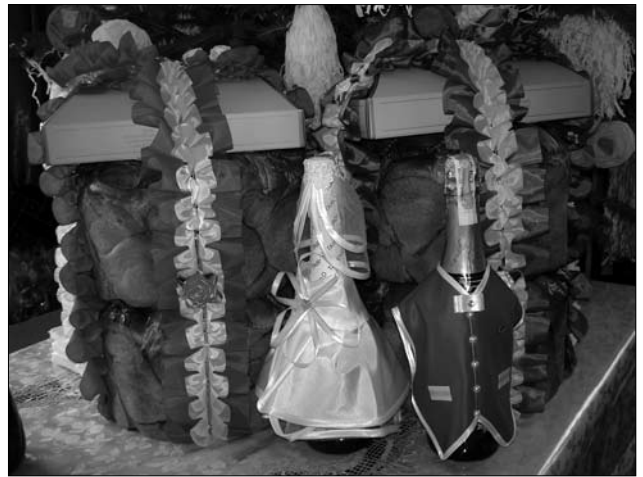
«Колачі», с. Долішне Залуччя Снятинського р-ну Івано-Франківської обл. 2015 р.