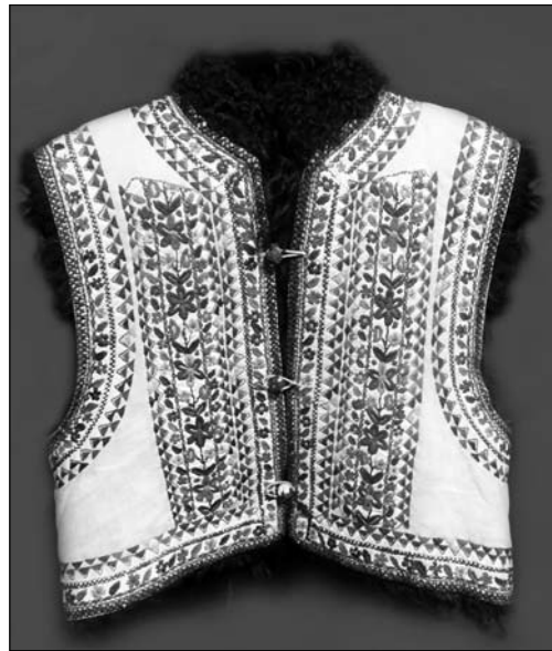
Киптар, с. Торговиця Городенківського району. Коломийський музей ім. Йосафа Кобринського. Інв. № 14750

Багатшим було оформлення киптарів: нашивання шнурів, гудзиків, китиць. Один із домінуючих на Покутті способів декорування — аплікація білим, зеленим, червоним, синім сап'яном та вишивка. Наприклад, киптар із с. Торговиця Городенківського району вишитий гладдю квітковим орнаментом [1, арк. 160]. Вишивка спереду складається із 16 рядів з кожного боку розрізу, розміщена на білому сап'яні, відтак нашита на киптар. Аплікація прикріплена зеленою бавовняною ниткою. Окрім того, на шов накладений тоненький шнурок з вовняної нитки. Вишивка дивовижна: кожна пелюстка квітки вишита різними кольорами. Однак попри багатобарвність вишивка не створює враження крикливості, навпа-