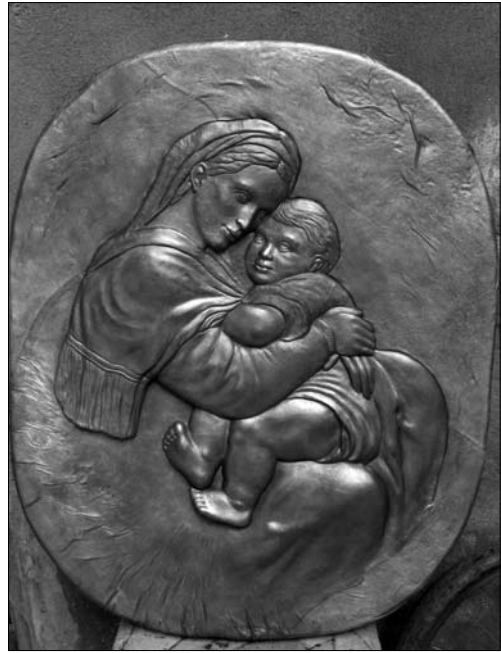
Материнство. Автор Дідорак Валерій. Коломия

Технологія обробки шкіри, зняття праці на Покутті — загальноукраїнські і ширше — загальноєвропейські. Розвиток шкіряних промислів відбувався аналогічно до інших країн Європи. Тобто від дрібного виробництва в селах та містечках, де переважали невеликі майстерні, коли ремесло поєднувалося із рільництвом і носило сезонний характер, до галузевих промислових підприємств. Відповідно збут виробів пройшов шлях від відхожих промислів, виготовлення товарів на замовлення місцевих мешканців до міжнародної торгівлі.