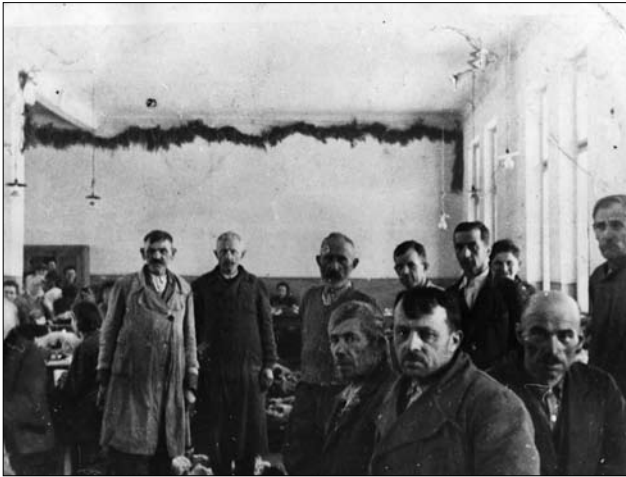
Кушнірський цех. Тисмениця. 20-ті рр. XX ст.