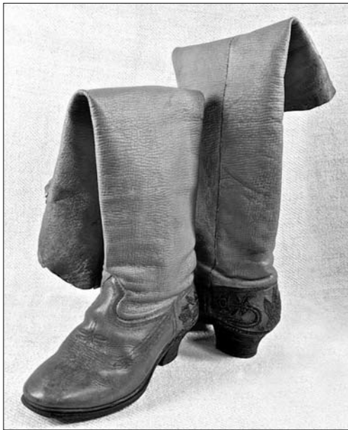
Покутські жіночі чоботи. Коломийський музей ім. Йосафата Кобринського. Інв. № 3408