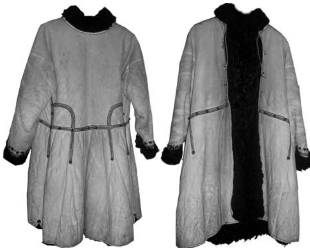
Кожух. Коломийський музей ім. Йосафата Кобринського

ший центр білошкірництва в регіоні — Тисмениця. У 30-х рр. XX ст. тут працювало понад 300 білошкірників [6, с. 17].