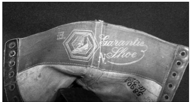
Жіночі черевички. Коломийський музей і Йосафата Кобринського. Інв. № 5890