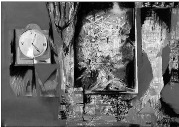
Іл. 6. Ніч в майстерні, 80 x 100, полотно, олія, 1998 р.

Студентське життя проходило бурхливо. Було велике бажання вчитися, опанувати щось нове. Спудей розмаїтих вікових категорій, здебільшого старші, з життєвим досвідом, представляли мистецькі школи різних регіонів України — центральних, зі сходу, закарпатську. Особливо цікавою стала тріада навчальних предметів — рисунок, живопис та композиція, яким Олександр приділяв багато часу та зусиль. Це дало свої плоди згодом.