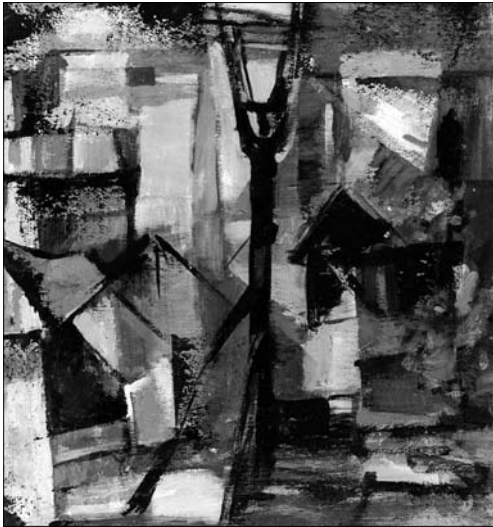
Іл. 5. Монок, 70 x 60, полотно, олія, 1997 р.