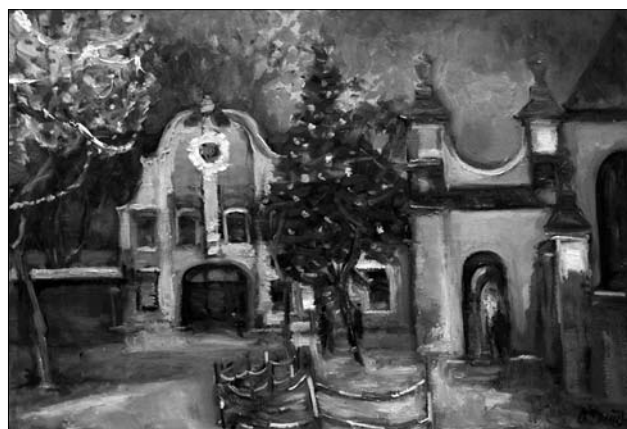
Іл. 8. Ніч перед різдвом, 40 x 60, полотно, олія, 2012 р.

го чимось несамовитим. Це була свобода. Свобода через призму американської школи Д. Поллака з отим відчуттям волі, нової естетики, отого вільного абстракційного малювання, емоційності та насиченості кольору. На тлі повсюдної стагнації ці закордонні пленери стали для Олександра Івановича ковтком свіжого повітря, давали відчуття сміливості та новизни. Не існувало жодних канонів, художніх рад. Лише свобода, тільки вільний вибір, що імпонувало тому романтичному сприйняттю дійсності.