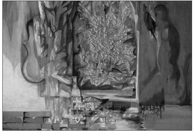
Іл. 3. Вікно, 80 x 100, полотно, олія, 1996 р.