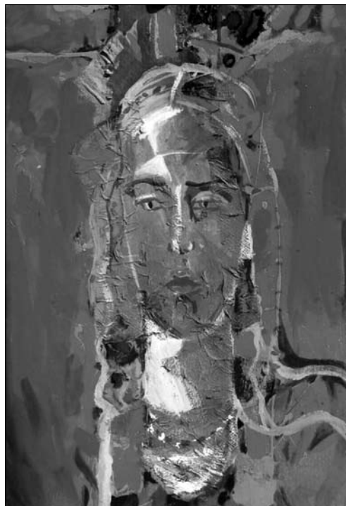
Іл. 7. Портрет дівчини, 70 x 50, полотно, олія, 2000 р.

У Польщі нуртувало абсолютно інше середовище, яке, знову ж таки, спонукало до переоцінки певних речей. Під час польських пленерів митець відкрив для себе акрилові фарби, що виявились для нього