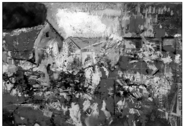
Іл. 4. Літній пейзаж, 70 x 100, полотно, олія, 1997 р.

Розговорились на мистецькі теми, і саме тоді Григорій запропонував ознайомитися з книгою Джона Ревалда «Постімпресіонізм». Олександра надзвичайно вразили яскраві кольори: це було те, що вже віддавна десь підсвідомо хвилювало його, не давало спокою. Отримавши книгу, він цілу ніч гортав її сторінки, маючи можливість розкривати для себе новий світ барв. На той час, час тотального браку будь-якої мистецької «нестандартної» інформації, це стало відкриттям.