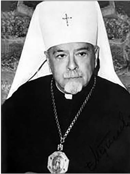
Степан Скрипник (патріарх Мстислав)