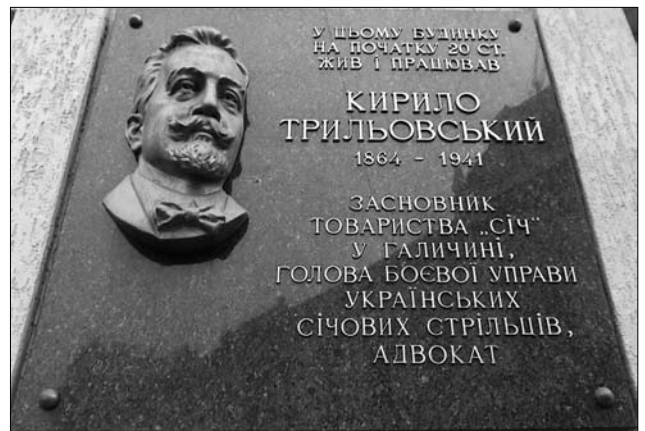
Меморіальна дошка Кирилові Трильовському у Львові