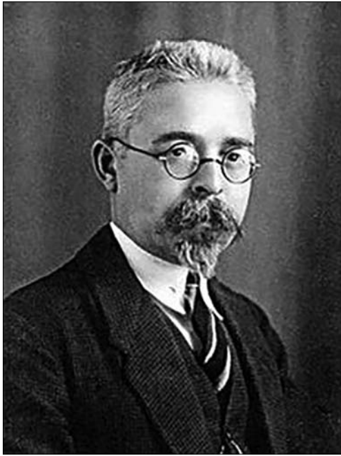
Професор Іван Огієнко (Митрополит Іларіон)

Наступні військові з'їзди, які відбулися протягом 1917—1918 років у Києві, ставили на одне з перших місць питання мови, української церкви. На цих з'їздах «прийшли до думки скликати Всеукраїнський церковний собор і обрали для цього військовий комітет із своїх священників і вояків у складі близько 30 чоловік», — згадував митрополит В. Липківський [15, с. 8]. На початку листопада передсоборова комісія, обрана єпархіальним з'їздом, злилася з військовим комітетом і утворилася перша «Всеукраїнська Православна Церковна Рада» — як тимчасовий керівний орган української церкви до скликання Всеукраїнського Церковного Собору. Саме тому Всеукраїнська Православна Церковна Рада (далі — ВПЦР) жваво, чисто повійськовому, повела підготовку із скликання Собору; по всіх Консисторіях навіть послано було вояків-інструкторів, щоб на місцях підштовхували справу.