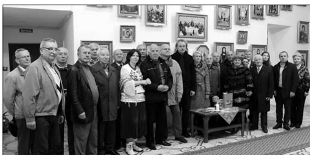
Загальне фото на пам'ять