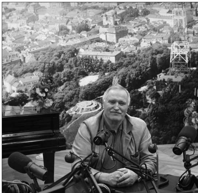
Академік Степан Павлюк