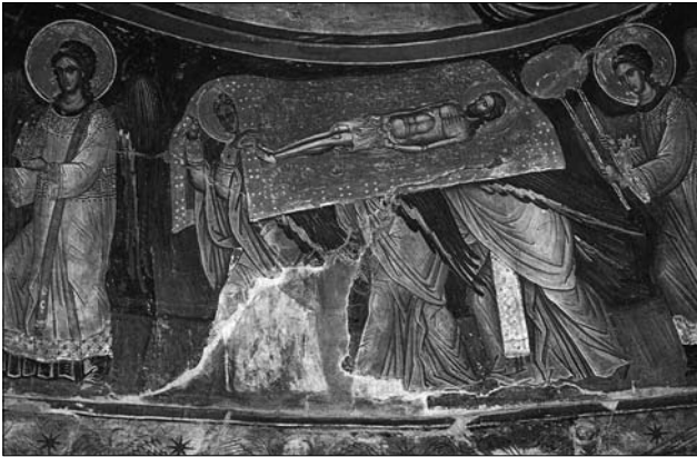
Іл. 3. Небесна літургія. Фреска. XV—XVI ст. Монастир Ставронікіта. Афон, Греція