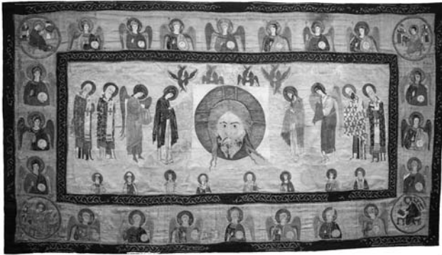
Іл. 5. Воздух «Спас Нерукотворний», 1389 р. Дар великої княгині Марії Олександрівни. ГІМ (Москва)