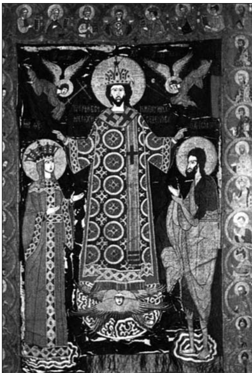
Іл. 4. Катапетасма «Предста Цариця одернуто Тебе», 1556 г. Дар царя Івана Грозного та його першої дружини цариці Анастасії Романівни для Хіландарського монастиря, Афон, Греція

Одна з давніх таких згадок відноситься до 360 р. Це запис про дари до храму св. Софії Константинопольської імператором Констанцієм II [21, col. 737]. Можна навести ще цілий ряд згадок, серед них завіси, подаровані Юстиніаном Великим [20, col. 2.119—2.158], завіси, подаровані до св. Софії Михайлом I Рангаве на честь його коронації [22, col. 993], завіси, що були подаровані імператорами Андроніком і Романом [7, с. 248]. Пізніше традицію дарувати завіси в наслідування візантійських