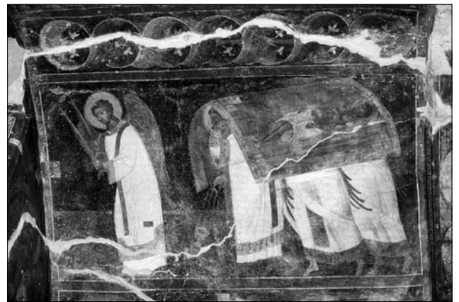
Іл. 2. Небесна літургія. Фреска. 1425—1450 рр. Церков св. Антонія. Крит, Греція

тих, що був відділений завісами на чотирьох стовпах, передавався як киворій із завісами (також на чотирьох стовпах) над престолом, причому киворій у цій паралелі відповідав Ковчегу Завіту [1, с. 45]. Тому завіси престолу мали важливе ієрархічне значення, і в низці імператорських подарунків або інших згадках у текстах вони зазвичай вказувалися відразу ж після літургійних посудин — потиру й дискосу, які завжди стоять на першому місці.