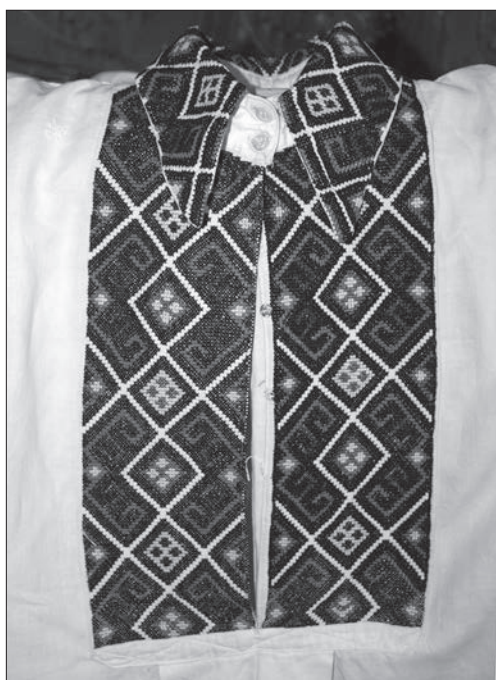
Іл. 5. Чоловіча сорочка. Перша пол. XX ст. Жовківський р-н, Львівська обл. Промислове бавовняне полотно, бавовняні нитки, хрестик. Експонат з виставки «Барвисті історії нашого краю»