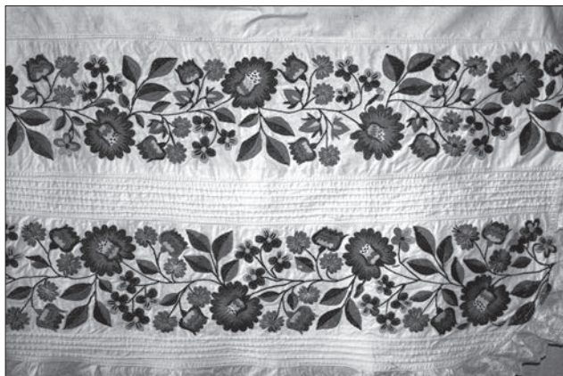
Іл. 3. Фрагмент вишитої запаски. Поч. XX ст. Жовківський р-н, Львівська обл. Промислове бавовняне полотно, промислове мереживо, бавовняні нитки, контурна лиштва. Експонат з виставки «Барвисті історії нашого краю»