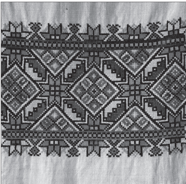
Іл. 7. Фрагменти рушників. 20—30-ті рр. ХХ ст. Жовківський р-н, Львівська обл. Ляне полотно, бавовняні нитки, хрестик. Експонати з виставки «Барвисті історії нашого краю»

Опілля. Основним у вишивці був хрестик. Смуги орнаменту із доволі великими рапортами розміщували на пазусі, комірі та манжетах. Поширеними були геометричні візерунки із ромбами та вписаними у них дрібнішими елементами — трикутниками, квадратами, хрестиками тощо. Їхній колорит суттєво відрізнявся від притаманного жіночим