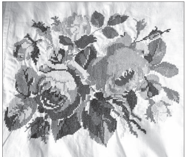
Іл. 8. а. Фрагмент вишивки на рукаві жіночої сорочки. 70—80-ті рр. ХХ ст. Жовківський р-н, Львівська обл. Промислове бавовняне полотно, бавовняні нитки, хрестик. б. Фрагмент вишивки скатертини. 70—80-ті рр. ХХ ст. Жовківський р-н, Львівська обл. Промислове бавовняне полотно, бавовняні нитки, хрестик. Експонати з виставки «Барвисті історії нашого краю»

Перспективи подальших досліджень жовківської вишивки можливі у двох напрямках: у вертикальному, поглиблюючи знання про особливості цього осередку, властиві йому технічні, композиційні та колористичні прийоми, із можливістю виділення окремих локальних рис, притаманних селам цього району; у горизонтальному, порівнюючи її з іншими осередками народної вишивки Опілля, виявляючи універсальні та унікальні параметри кожного з них.