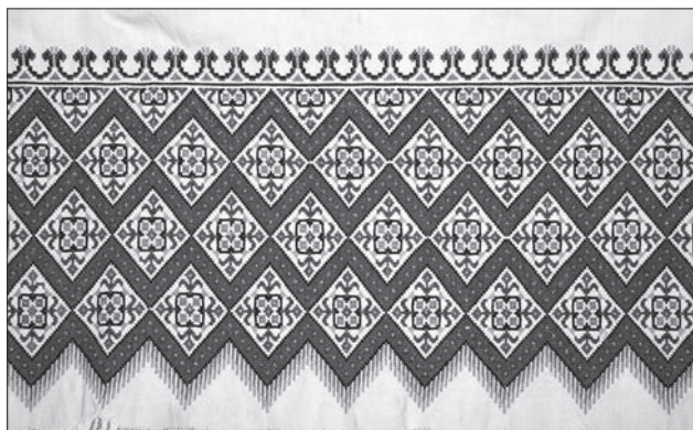
Іл. 4. Жіноча запаска. 20—30 рр. XX ст. Жовківський р-н, Львівська обл. Ляне полотно, бавовняні нитки, хрестик. ЛІМ (26560 ТК-4072)