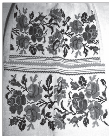
Іл. 2. Фрагменти вишивок жіночих сорочок, розміщених на уставках, рукавах, стійках, пазухах. Поч. ХХ ст. Жовківський р-н, Львівська обл. Ляне полотно, бавовняні нитки, хрестик, стебнівка, штапівка, «бавовняний шов», змережування. а, б. Фрагменти сорочок із виставки «Барвисті історії нашого краю»; в, г. Фрагменти сорочок з ЛІМ (8754, ТК-2847; 2608, ТК-4059)