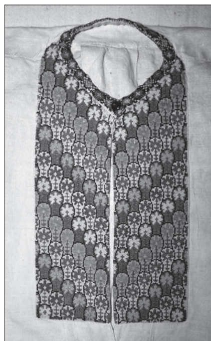
Іл. 6. Чоловіча сорочка. Перша пол. XX ст. Жовківський р-н, Львівська обл. Промислове бавовняне полотно, бавовняні нитки, хрестик. ЛІМ (2322 ТК 754)

ки. Вишивка на цій запасці хоча і виконана контурної лиштвою, за накресленням мотивів та поєднанням їх між собою дуже близька до візерунків хрестиком, які оздоблювали жіночі сорочки (іл. 3).