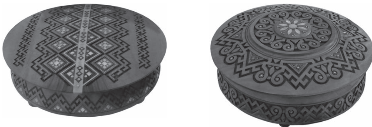
Іл. 5. П. Корпанюк. Рахва «Вишиванка». 2018 р. Дерево, точіння, різьблення, інкрустація деревом, перламутром, металом. Власність автора