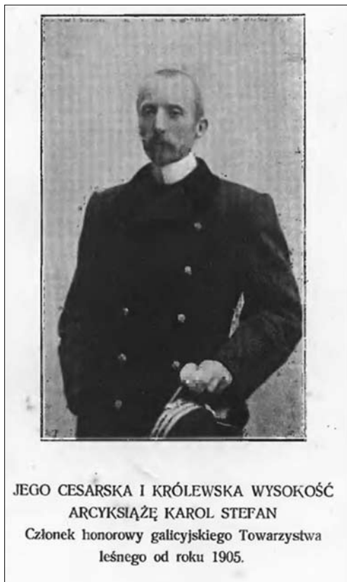
Іл. 1. Фото почесного члена Галицького лісового товариства — архикнязя Кароля Стефана

Відомо, що він брав участь у зборах як заступник голови Товариства 2 червня 1906 року [10, с. 438]. Ширше представлена його діяльність на засіданні, яке відбулось 14 серпня 1906 року. К. Шептицький, аналізуючи діяльність Лісової школи у Львові, сказав: