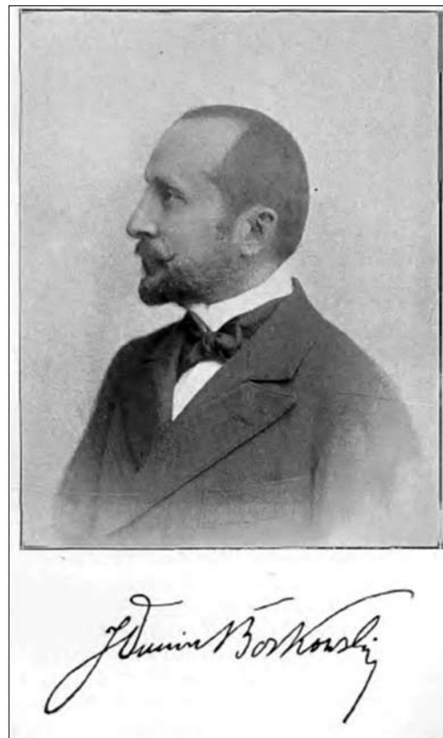
Лл. 4. Фото графа Єжи Дуніна-Борковського

ISSN 1028-5091. Народознавчі зошити. № 3 (147), 2019