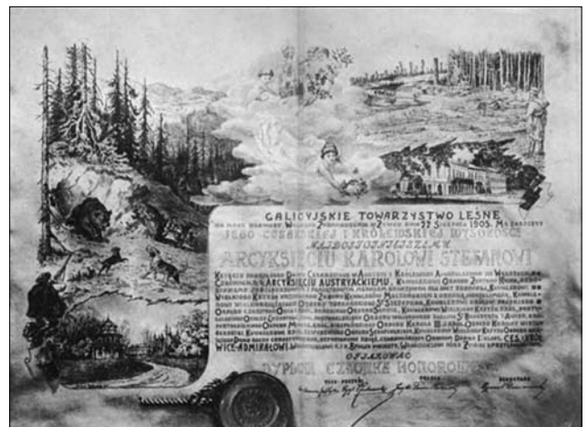
Іл. 2. Диплом почесного члена Галицького лісового товариства, вручений Карлу Стефану архикнязеві Габсбург-Лотаринзькому в Живці 22 серпня 1907 р. Диплом опубліковано у часописі «Сильван» («Sylwan») у 1907 р. (серпень-вересень) [4, с. 345—346]

дидатів на посаду заступника голови Товариства. З 91 особи в залі 89 проголосували за Казимира Шептицького. Всього з'їзд, в якому взяли участь делегації поляків з трьох імперій — Австро-Угорської, Пруської та Російської (всього — 300 делегатів), тривав чотири дні [15, с. 5]. З'їзд був ювілейним — минуло 25 років з часу заснування організації. Віце-голови Товариства Казимиру Шептицькому було доручено виголосити промову. «Результат праці нашого Товариства, — зазначив промовець, — можна назвати великим і малим. Великим він буде здаватись, коли порівняємо сучасний стан лісівництва зі станом давнім і сумним. Малим — коли візьмемо до уваги, як