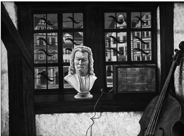
Іл. 2. «Мелодія Баха» (к., темп., 1975 р., НМЛ ім. А. Шептицького)