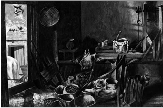
Іл. 5. «Полудень» (к., темп., лак, 1974 р., ЛНГМ ім. Б.Г. Возницького)