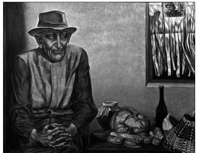
Іл. 4. «Бабине літо» (к., темп., 1977 р., ЛНГМ ім. Б.Г. Возницького)

він інтерпретує у творі «Баркас із жовтою штормівкою» (ДВП, темп., 1978 р., НМЛ ім. А. Шептицького) (іл. 3).