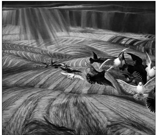
Іл. 7. «Поділля. Жнива» (к., темп., 1977 р.)

У «Натюрморті з металевим посудом» (п. на ДВП, темп., о., 1981 р., ЛНГМ ім. Б.Г. Возницького) автор спрямовує наш погляд від землі у небо — від вузького кута з господарським начинням у загразоване вікно в даху, крізь яке лється світло, яке все освічує, проясняє, надає нового змісту. Від приземлених речей ми переходимо до трактування небес як символу вічності. А на фоні неба висить риба, зачеплена гаком за решітку — вона не належить ні до світу речей, ні до небес, а знаходиться між ними, поєднуючи їх. Риба здавна використовувалась як монограма імені Ісуса Христа (з грецької перекладається як Ісус Христос Божий Син Спаситель) та символ християнства. Автор використовує градації від