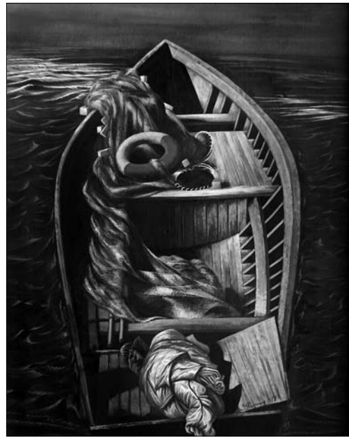
Іл. 3. «Баркас із жовтою штормівкою» (ДВП, темп., 1978 р., НМЛ ім. А. Шептицького)

Алегорії життєвої подорожі та її мети, швидкоплинності життя та шляху який повинна кожна людина пройти сама у хвилях бурхливого моря життя,