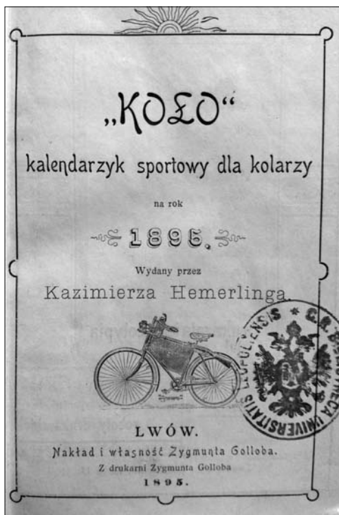
Іл. 3. «Коло», спортивний календарик для велосипедистів». 1895 р. Титульний аркуш

Був членом польського спортивного товариства «Сокіл-Матір» у Львові. У 1895—1899 рр. — видавець і редактор органу львівського та краківського клубу велосипедистів «Колю» («Велоси-