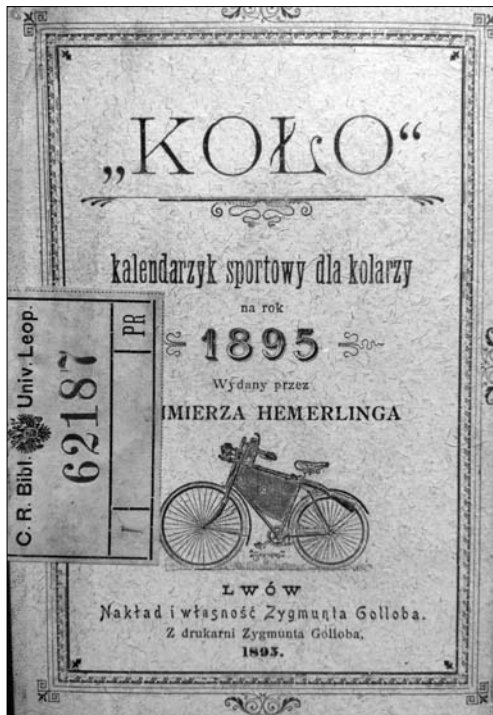
Іл. 2. «Коло», спортивний календарик для велосипедистів». 1895 р. Обкладинка