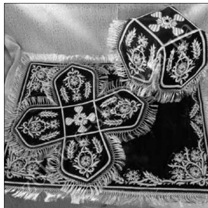
Іл. 8. Покрівці. 2010-ті рр. ПП «Золоте шитво». Кропивницький. Ручне гаптування золотою канителлю і трунцалом

До виробничих майстерень належить передусім швейний цех Художньо-промислового підприємства при Свято-Успенській Києво-Печерській Лаврі — беззаперечний монополіст галузі в Україні ще з радянських часів. Створений як дублер відомих російських виробництв православного церковного начиння («Софріно» та інших), він до певної міри наслідує їхні художні ідеї та традиції. Від 1994 р. це сучасне текстильно-швейне підприємство під назвою «Православний текстиль» [6] працює у Київській Ми-