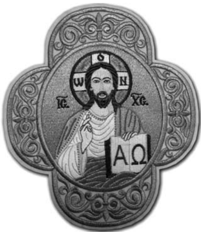
Іл. 11. Оплічний хрест. 2010-ті рр. ПП «Риза». Львів. Машинна і ручна вишивка