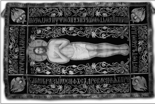
Іл. 10. Плащаниця. 2010-ті рр. ПП «Риза». Львів. Машинна і ручна вишивка