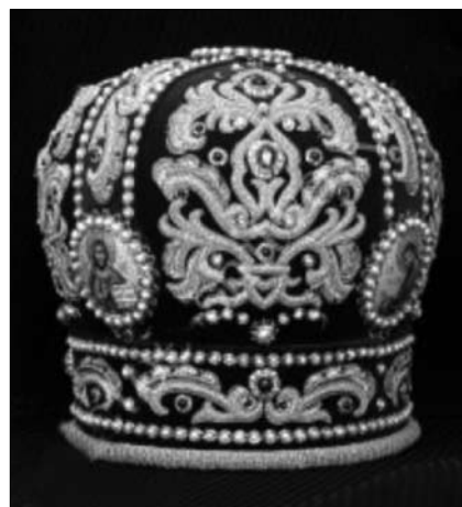
Іл. 9. Митра. 2010-ті рр. ПП «Золоте шитво». Кропивницький. Ручне гаптування золотою канителлю і трунцалом

трополії (УПЦ МП). В асортименті підприємства священні облачення та різноманітні церковні тканинні вироби для облаштування храму — плащаниці, покрівці, скатертини, облачення престолу, хоругви і катапетасми, оздоблені візерунками машинної вишивки.