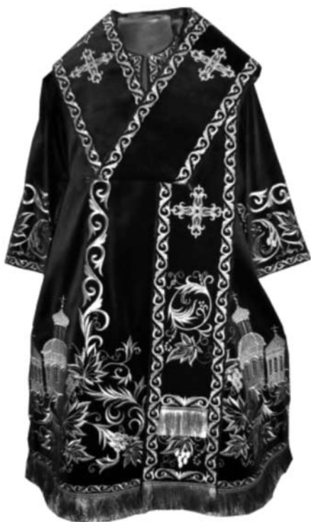
Іл. 6. Облачення архієрейське. 2016 р. ПП «Православний текстиль». Київ. Машинна вишивка, ручний гапт канителю, інкрустація камінням

Дивовижне багатство художньо-емоційних рішень сучасних церковних тканин зумовлене різноманітністю матеріалів, технік виконання декору. Вишивка як традиційний вид мистецтва виділяється своїм багатством, використанням різних технічних прийомів.