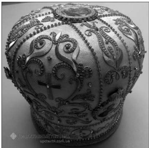
Іл. 5. Митра. 2016 р. ПП. «Православний текстиль». Київ. Машинна вишивка, ручний гапт «по карті» канителю