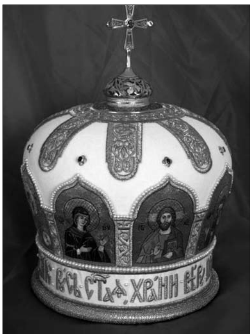
Іл. 2. Митра митр. Одеського та Ізмаїльського УПЦ МП Агатагела, 2004 р. Відділення художнього церковного шитва Одеської Духовної семінарії. Лицеве шитво

ту підміняють спорадичні аматорські роботи, часто на межі примітиву, наїву та кітчу. Основними тканинами та оздоблювальною фурнітурою для церковно-