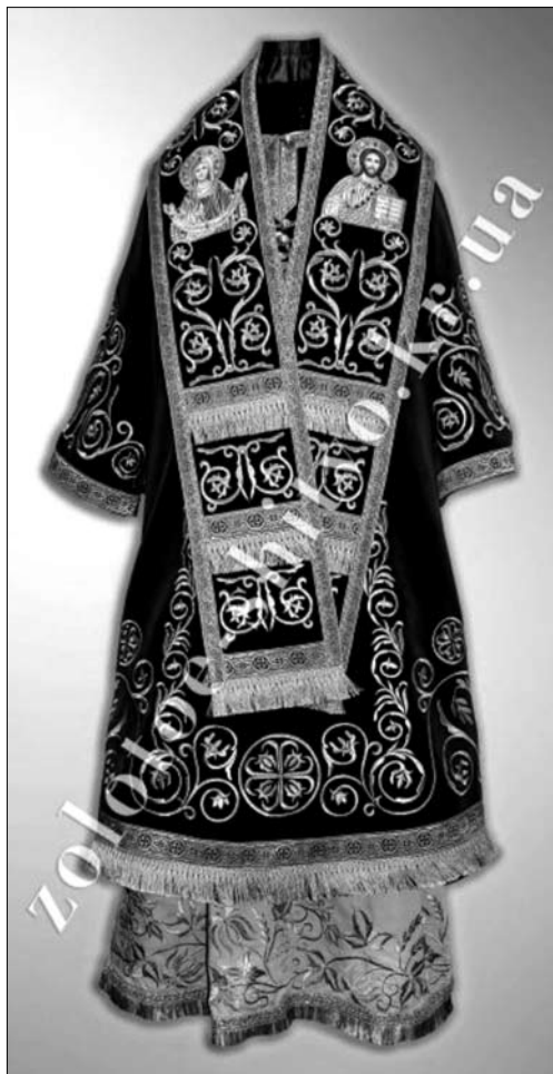
Іл. 7. Облачення архієрейське. 2010-ті рр. ПП «Золоте шитво». Кропивницький. Машинна вишивка металітом, ручний гапт канителлю, інкрустація камінням

В цілому для декору літургійних тканин характерне перенасичення деталями. У виробках майстерень під патронатом Московського патріархату домінує гаптування металевими нитками, надмірна кількість оздоб (бісеру, леліток, штучних перлів, стразів, кольорового скла, позументної фурнітури). Загалом, необмежене тиражування продукції позбавляє її оригінальності, унікальності та художньої вартості.