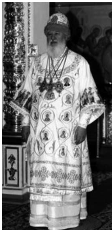
Іл. 1. Сакос митр. Одеського та Ізмаїльського УПЦ МП Агатагела, 2005 р. Відділення художнього церковного шитва Одеської Духовної семінарії. Лицеве і орнаментальне шитво