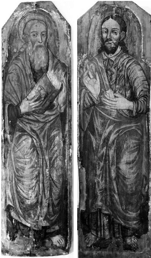
Іл. 8. Апостоли Петро та Яків (?). Кінець XVII ст. З чину Моління іконостасу церкви у Войнилові. НМЛ

З церков Войнилова зберігся також комплекс ікон апостолів (окрім однієї з правої частини ярусу) (іл. 8) з чину Моління іконостасу, та комплекс ікон пророків, також з іконостасу (іл. 9). Вони нижчого фахового рівня, ніж описані намісні ікони. Ікони апостолів надійшли без обрамлення. Вони виконані спільним майстром орієнтовно наприкінці XVII ст. Його манера малярства відрізняється від тієї, що її представляють інші згадані ікони з Войнилова. З цього чину Моління бракує центральної ікони (чи ікон) Христа на престолі, Богородиці та Івана Хрестителя. Підписів до ікон апостолів немає, очевидно, вони були на карнизі іконостасу, більшість із них можна ідентифікувати на підставі іконографії.