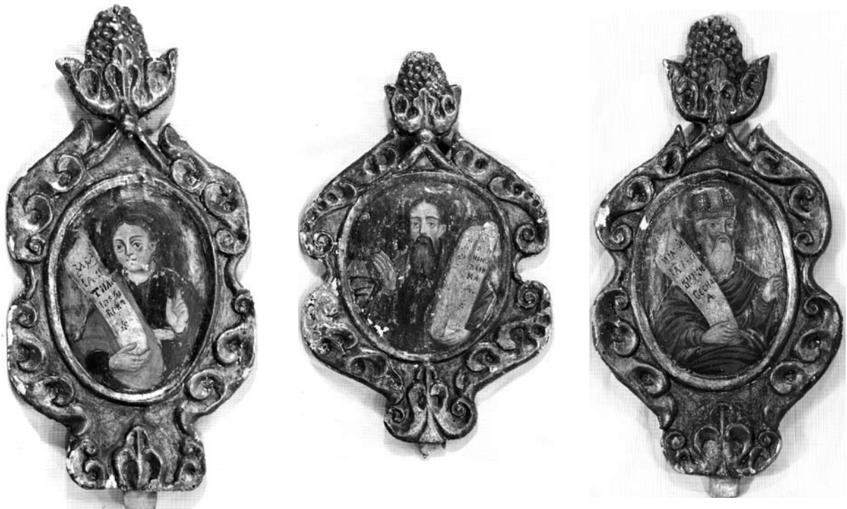
Іл. 9. Ікони пророків Захарії, Мойсея та Якова. Друга половина XVII ст. З пророчого ярусу іконостасу церкви у Войнилові. НМЛ

Можливо також з церквою св. Миколая у Войнилові слід пов'язати велике полотнище зі Страстями Господніми, яке налічує 27 сцен, закомпонованих у чотири яруси навколо більшого за розміром Розп'яття з пристоячими, що в центрі. Полотнище видовженого горизонтального формату розміром 163 x 395 см (НМЛ і-3243), на жаль також має значні втрати малярства [8].