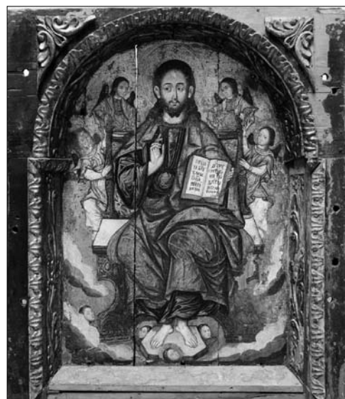
Іл. 4. Ікона Христа на престолі. 1650—1670-ті рр. З чину Моління іконостасу церкви Різдва Богородиці (?) у Войнилові. НМЛ

ляє експресивна манера малярства. З церкви у Войнилові походить також ікона Тайної вечері (НМЛ і-2438) (іл. 3), однак не відомо, чи вона входила до того ж іконостасу що й згадані празничкові ікони. На нашу думку, вона намальована іншим автором, аніж празники. З автором ікони Тайної вечері можна пов'язати малярство шести медальйонів на Царських вратах з Войнилова (НМЛ д-1282)