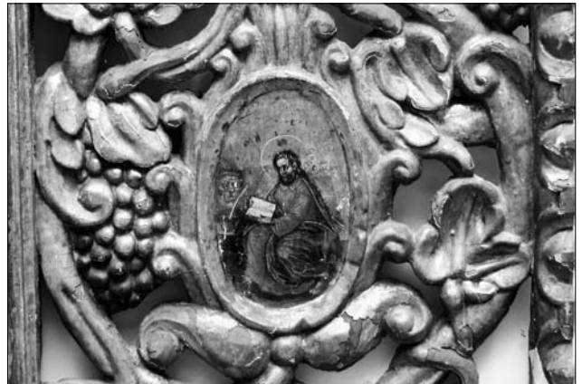
Іл. 3. Ікона Тайної вечері та фрагмент Царських врат. Середина — друга половина XVII ст. З іконостасу церкви у Войнилові. НМЛ

ляє експресивна манера малярства. З церкви у Войнилові походить також ікона Тайної вечері (НМЛ і-2438) (іл. 3), однак не відомо, чи вона входила до того ж іконостасу що й згадані празничкові ікони. На нашу думку, вона намальована іншим автором, аніж празники. З автором ікони Тайної вечері можна пов'язати малярство шести медальйонів на Царських вратах з Войнилова (НМЛ д-1282)