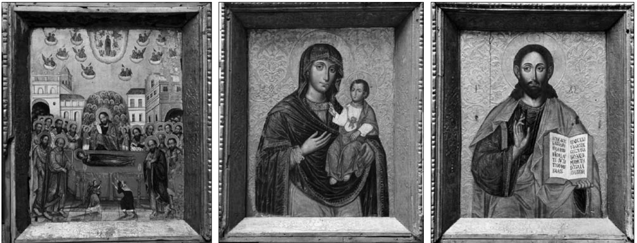
Іл. 2. Ікони Успіння Богородиці, Богородиці Одигітрії, Христа Пантократора. Середина XVII ст. З намісного ярусу церкви Різдва Богородиці у Войниліві. НМЛ