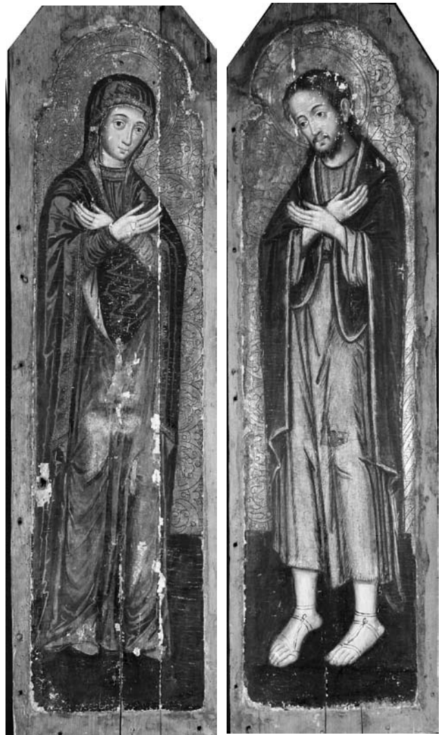
Іл. 7. Ікони Богородиці та св. Івана Хрестителя. Кінець XVII ст. З чину Моління іконостасу церкви св. Миколая (?) у Войнилові. НМЛ

З церкви св. Миколая у Войнилові походить ікона св. Миколая (НМЛ і-1013) (іл. 6). Про це свідчить напис на її звороті: «Войнилѡв / I / зъ / церкви С. / Николая». Очевидно, це була намісна храмова ікона в іконостасі цієї церкви. До цього намісного ярусу відносимо також ікону Христа Пантократора, яка ще потребує комплексної реставрації (НМЛ і-2666) та ікону Благовіщення Богородиці (НМЛ і-2561) (іл. 6). Ці ікони мають подібну до ікони св. Миколая манеру малярства, обрамлення та розмір тому, припускаємо, вони виконані одним автором. Трактування ликів на іконі Благовіщення має виразно барокові риси, то ж цю групу ікон відно-