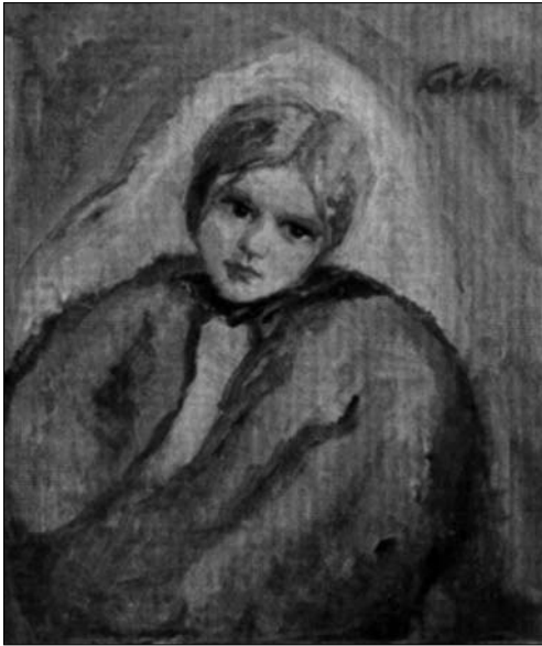
Іл. 1. Дівчина зі с. Тихий

психологічного ставлення художника до своїх моделей. Автор досліджує портрети від раних 1930-х рр. до живописних полотен 1970-х рр. та зазначає, що А. Коцці, як портретисту, вдалося вирішити одне зі складних питань художньої творчості — «створення узагальненого, типового, національного характеру» [3, с. 129]. Цінні відомості про творчість майстра 1930—1940-х рр. надає Б. Кузьма в своїй статті «Життя і творчість художника А.А. Коцки в період Підкарпатської Русі 1919—1946 рр.» [4], автор дає короткі, але влучні характеристики деяким портретам А. Коцки, зокрема «Жіночий портрет. Ганна» та «Дівчина в бордовій сукні». У загальному огляді закарпатського живопису в книзі «Українське радянське мистецтво 1941—1960 років» [5, с. 80] Г. Юхимець, зауважує, що прикметною рисою відомого жіночого портрету А. Коцки «Верховинка» є прагнення віднайти вдале узагальнення народного образу.