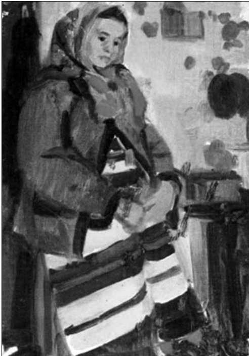
Л. 11. Верховинка в інтер'єрі