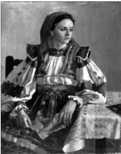
Іл. 5. Дівчина з Колочави»

майже ахроматичний фон, акцент — смугляве обличчя обрамлене чорним хвилястим волоссям та виразні коричневі очі. Композиція статична, інколи помітний легкий поворот обличчя. Погляд жінки зосереджений, глибокий. Одяг хоч і кольоровий, однак не прописаний детально і ніби доповнює образ жінки.