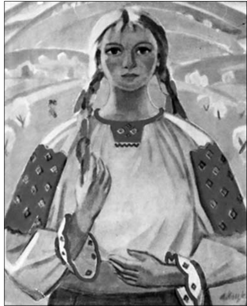
Іл. 9. Веснянка

Художник вдало і сміливо komponує як великі полотна із зображеннями гуцулок-верховинок, що поєднані загальним мажорним колоритом, так і невеликі за форматом портрети міських красунь. Фігури показані здебільшого в погрудному або в поясному обрізі, присутній легкий розворот тіла та іноді нахил голови, що додає потенційної динаміки композиції. В роботах «Жіночий портрет Е. Банаті» (1970-ті рр.), «Жіночий портрет» (1984 р.) (іл. 12) увага митця головним чином зосереджена на обличчях портретованих, оскільки фон майже завжди глибоко затемнений. Риси обличчя делікатно пророблені,