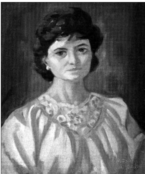
Л. 12. Жіночий портрет

точністю гаптування, прикраси, мережива — вбрання було для нього більше плямою в колористичній побудові, ніж важливим атрибутом моделі. «Кольорові плями утворюють складний мелодійний ритм, м'які фарби мерехтять і переливаються під променями сонця, контури тануть і розчиняються» — підмітив Б. Ворон на сторінках мистецького альманаху «Артес» [16]. Діапазон емоційних характеристик в портретах А. Коцки досить великий. Художник передає найтонші порухи душі, відтінки настроїв, ду-