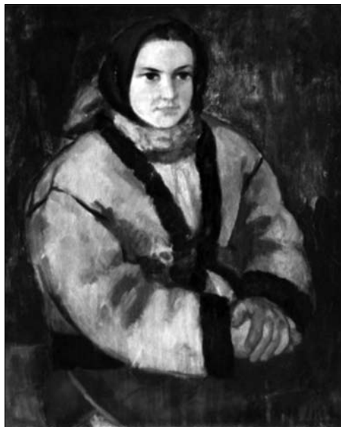
Іл. 2. Дівчина-верховинка

Після Всеугорської виставки 1939 р. в м. Будапешті А. Коцку нагороджують стипендією на навчання до Римської Академії образотворчих мистецтв, за серію робіт «Жителі Турянської долини». Із 1940 р. молодий художник навчається у професора Феруччо Феррацці, а через рік на звітній виставці, яку відкрив король Італії Віктор-Емануїл III, А. Коцка посідає перше місце і, як нагороду, отримує стипендію на навчання в Римській Академії Святого Луки до 1942 року. Вивчаючи спадщину майстрів минулих століть у відомих музеях Італії, митець здобуває нові знання, збагачується новими враженнями. Він відточує академічний малюнок, а відтак створює низку камерних портретів та фігуральних композицій. Центром ідейнотематичної спрямованості його робіт залишається образ жінки. Художник трактує цей образ в дусі майстрів Італії як ідеал, як морально-прекрасну особистість, у якій в гармонії перебувають раціональне і чуттєве, духо-