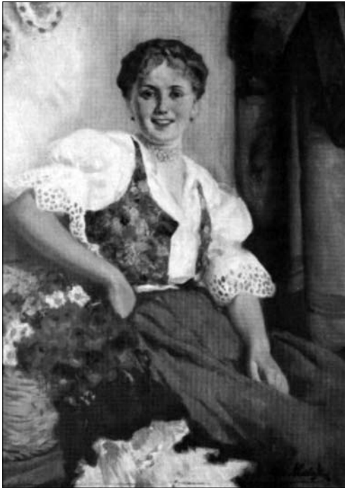
Іл. 4. Дівчина в угорському костюмі