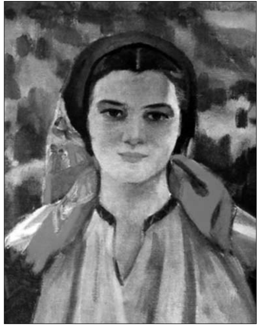
Іл. 6. Верховинка

думав я, — будувати свої роботи теж на зіставленні двох-трьох основних кольорів?», — пояснював свою «кухню» художник [11].