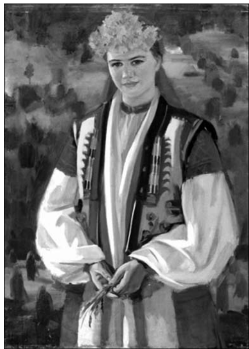
Іл. 10. Гуцульська молода

але волосся й одяг ліпляться здебільшого широкими, більш умовними площинами. Вони в міру узагальнені, щоб органічно вписуватись у цілісний образ. Їх виконання не суперечить зображенню обличчя, а ненав'язливо обрамляє його та акцентує увагу саме на обличчі моделі. Жінки одягнені в світських одягах, з мінімальною кількістю аксесуарів, що також не прописані детально. Художник передавав характер світського одягу, але не випишував із натуралістичною