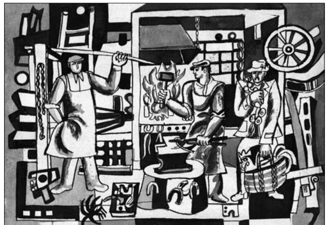
Іл. 2. Дарій Грабар. Батькова кухня. 1972. Туш