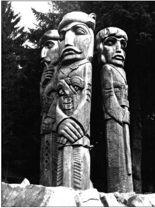
Іл. 4. Дарій Грабар. Україна — ХХ століття. 2005. Кераміка, поливи