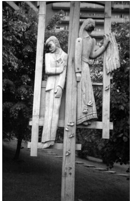
Іл. 6. Дарій Грабар. Поет і Муза. За мотивами поезій І. Франка. Санаторій «Карпати» у м. Трускавці. 2006. Дерево, різьба

Можливо, що саме під час цього тривалого творчого процесу відбулися і загальні зміни авторської методології, в тому числі поглиблення ліричного вектора мистецького світогляду Дарія Івановича. Так, у його графіці 2000—2010-х років з'являються витончені за своєю пластичною мовою цикли, що передають індивідуальні рефлексії на ті чи інші суспільні прояви з позиції авторської етики. Цікаво, що в окремих композиціях відбувається «зустріч» давніх образних ідей художника з розвиненою за останні роки пластичною мовою. «Больові точки» в житті родини художника інтегрувалися в ці твори з особливою моральною чистотою. Іл. 8., Іл. 9.