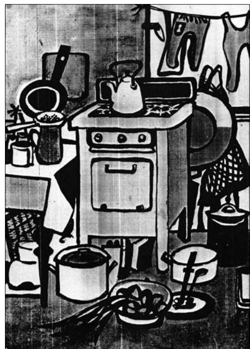
Іл. 3. Дарій Грабар. Студентська кухня. 1972. Туш, аплікація