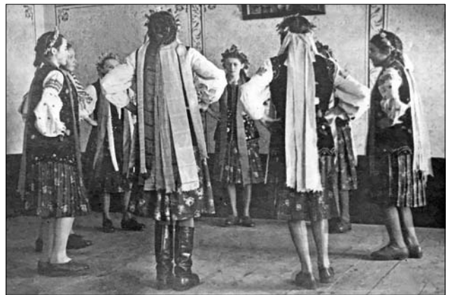
Іл. 10. Дівчата-луговички в танці.