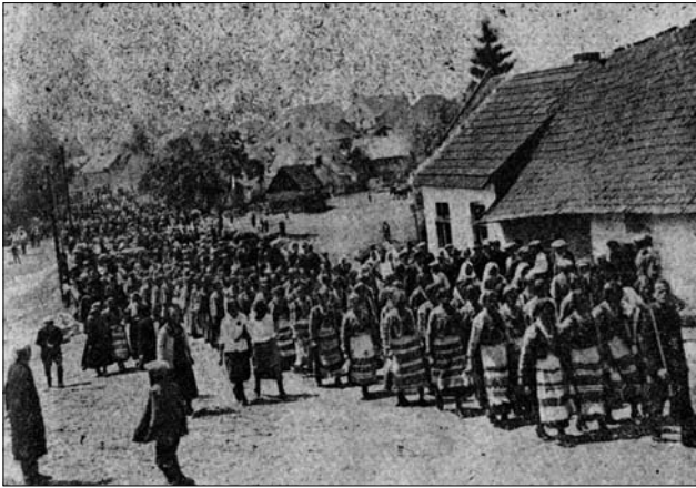
Іл. 11. Похід «Лугів» на святі І.Франка в Бібрці. Фот. Янушевич. Фото з журналу «Вісти з Лугу». Львів, 1930. Серпень. Ч. 8