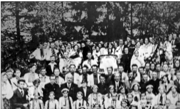
Іл. 5. Лугове свято в с. Селисько, приурочене до 95-ї річниці від дня смерті Маркіяна Шашкевича, 1938 р.

Струнками рядами. Хто не ворог нам, а брат — Стань враз з нами в лави.. В нас нема брехні ні зрад, В нас нема неслави. Збираймося юнаки Гей, гей, тай на Лузі. Єднаймося, як брати, В сердечній послузі Гей, на волю, гей, на Луг Сестриськи і браття, Хай гартується наш дух, Молоде завзяття. Всі ви з хат, і всі з палат Встаньмо враз у лави. Луговик — то сонця брат, Він стремить до слави. Жар-огонь в нас не поник, Зов наш — «Все для люду!». Луговик до жертви звик, До борні, до туду!