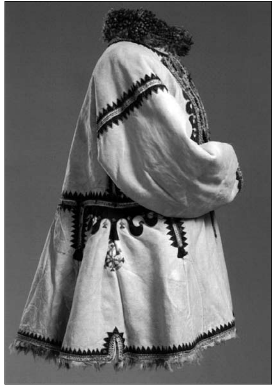
Іл. 18. Кожух, Буковина. Поч. XX ст. НМЛ Т-3027.