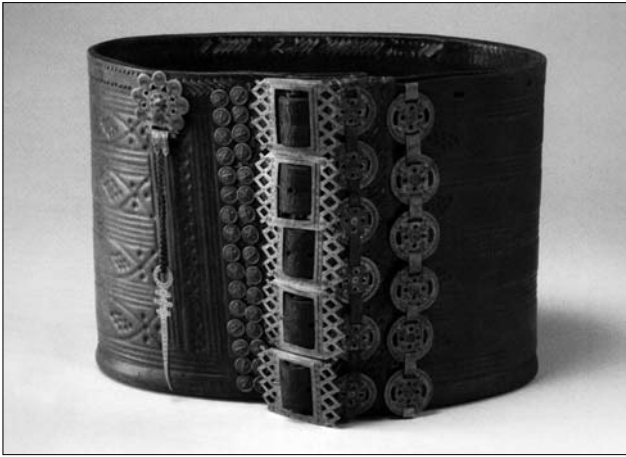
Іл. 23. Пояс «черес», Гуцульщина. Кін. XIX ст. МЕХП ЕП-16561.