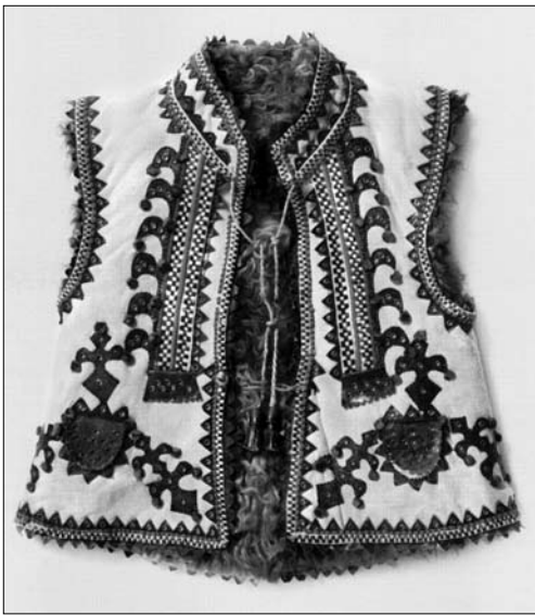
Іл. 11. Кептар дитячий, м. Косів Івано-Франківської обл. Поч. ХХ ст. МЕХП ЕП-20222.