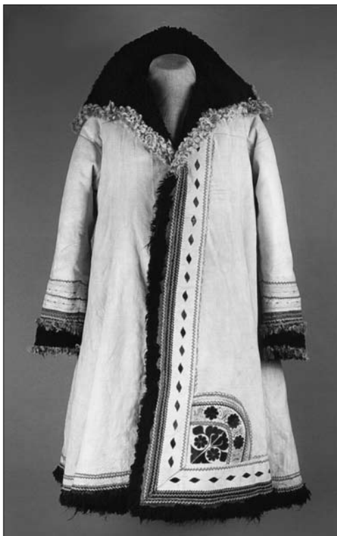
Іл. 19. Кожух, с. Дирдин Городищенського р-ну Черкаської обл. Поч. XX ст. МІГ КН.-11466.