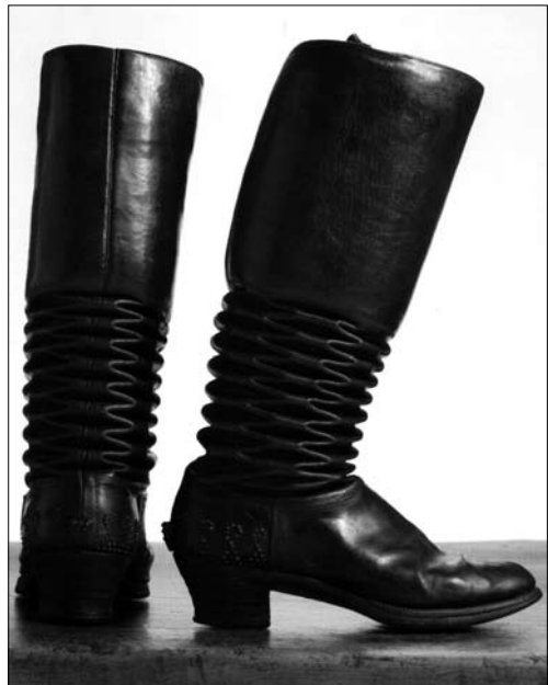
Іл. 6. Чоботи «рісовані», с. Річка Косівського р-ну Івано-Франківської обл. Поч. ХХ ст. МЕХП ЕП-72879.

Подністров'я — чоботи з козячої шкіри, дослідниця відзначила не лише особливості крою, а й «оригінальність оздоблення: на передах і зап'ятках тисненні дрібні крапки, які творять «кучері» та смужки кольорової шкіри (зелено-червоної або чорно-червоної),