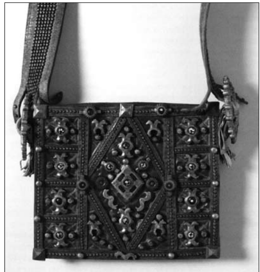
Іл. 26. Сумка «ташка», м. Косів Івано-Франківської обл. Кін. ХІХ ст. МЕХП ЕП-16637.

всього комплексу національного вбрання посилювалося в поліетнічному середовищі або за межами етнічної території». Не менш важливим досягненням авторки є висвітлення смислового значення кольору, матеріалу, з якого виготовлені різні вироби зі шкіри. Власні спостереження вона підкріплює також цінними відомостями з фахової літератури. Висловлює аргументовані думки, щодо статусу шкіряних виробів, який іноді кардинально змінювався, коли вони включалися в обрядові дії.