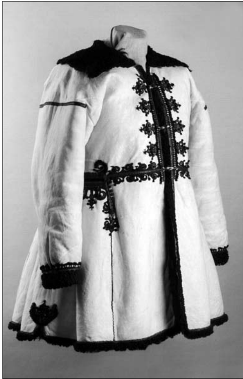
Іл. 17. Кожух жіночий, смт Мельниця Подільська Тернопільської обл. Поч. XX ст. МІГ КН.-12448.