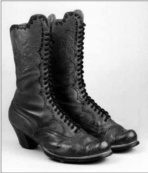
Іл. 7. Чоботи жіночі «сап'янці», Борщівський р-н Тернопільської обл. I пол. XX ст. МІГ КН-9978.