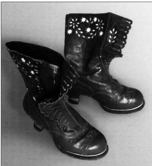
Іл. 8. Черевики жіночі, с. Черганівка Косівського р-ну Івано-Франківської обл. Сер. XX ст. СКМС ВЗ-002.

яка прикривала шов по лінії вишивання передів і закінчувалася з обох боків кутасиками».