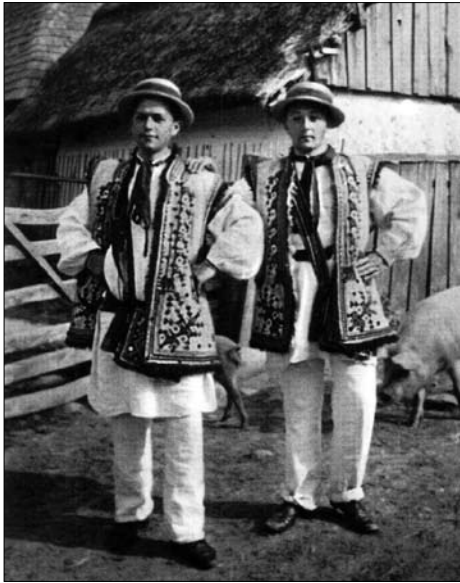
Іл. 9. Хлопці в кептарях і чоботах, с. Делятин Надвірнянського р-ну Івано-Франківської обл. Поч. ХХ ст. Фото-тека ІН НАН України. № 11070