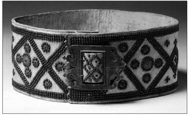
Іл. 22. Пояс «черес», Гуцульщина. II пол. XIX ст. МЕХП ЕП-16528.

Серед давніх технік оздоблення шкіряних виробів без хутра авторка вказала на візерункове тиснення дерев'яними і металевими штампами, що підтверджено виявленими археологами зразками таких «побутових виробів, як футляри для ножів, порохівниць, ложок, взуття, які відносять до періоду Київської Русі». Ймовірно, схожі пам'ятки «XVI ст.