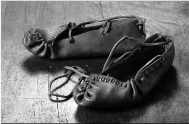
Іл. 4. Постоли «ходаки», Бойківщина. Кін. ХІХ ст. МЕХП ЕП-21705.

вироби українців, зокрема проаналізовані компоненти одягового призначення й доповнення до нього.