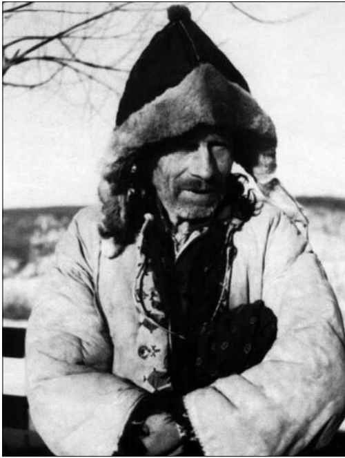
Іл. 21. Чоловік у шапці «клепані» та кожусі, с. Раковець Городенківського р-ну Івано-Франківської обл. 1936 р. Фототека ІН НАНУ № 11264. Фото Ю. Дороша

ми») від пояса до низу поли, сягали до колін або трохи нижче.