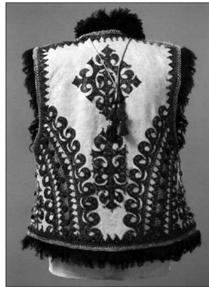
Іл. 12. Кептар, Путильський р-н Чернівецької обл. Поч. ХХ ст. МЕХП ЕП-20223.

Докладно висвітлила вчена еволюційний шлях хутряних безрукавок, які до ХХ ст. зберегли значну варіативність кроїв та мають різні назви. Аналоги таких виробів відомі різним народам Європи. В Україні вони найпоширеніші в Карпатах, на Покутті, Західному Поділлі, Буковині. За кроєм розрізняють давнішого типу суцільно кроєні прямоспинні безрукавки, та похідні від них, розширені від лінії пройм. Короткі прямоспинні «кептарі», типові для Гуцульщини, Західного Поділля, Буковини й рів-