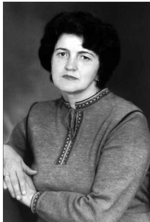
Іл. 1. Ганна Йосипівна Горинь (1941—2007)

Ганна Горинь зробила вагомий і цінний внесок у вітчизняну та світову науку. Вона — авторка трьох фундаментальних монографій: «Шкіряні промисли західних областей України (друга половина XIX — початок XX ст.)» (Київ, 1986); «Громадський побут сільського населення Українських Карпат (XIX — 30-ті роки XX ст.)» (Київ, 1993); «Народні шкі-