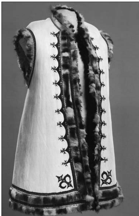
Іл. 15. Кептар «цурканя», Заставнівський р-н Чернівецької обл. Кін. XIX ст. МЕХП ЕП-20206.

кілька найхарактерніших силуетів: прямий; розширений до низу від лінії рукавів; розширений від лінії талії. Охарактеризовано два найпоширеніших крої кожухів: «кожух тулуб'ястий» і «кожушина» (поширені в центральних і східних регіонах України); довгі та «чемеркові», «кубіцькі», «прості» (типові для західних районів). Учена відстежила еволю-