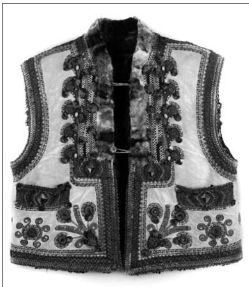
Іл. 13. Кептар жіночий, Рахівський р-н Закарпатської обл. Поч. XX ст. МІГ КН-7656.