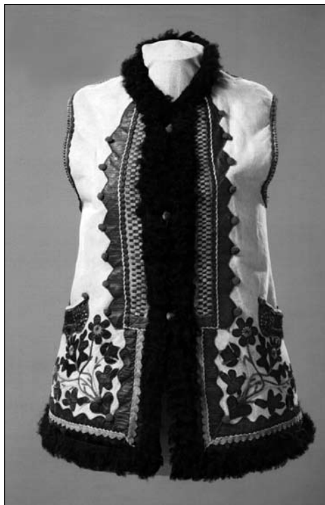
Іл. 14. Кептар «бунда», с. Волосянка Сколівського р-ну Львівської обл. Поч. XX ст. МЕХП ЕП-74771.