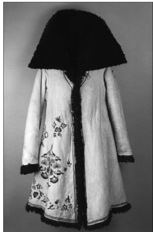
Іл. 20. Кожух, смт Котельва Полтавської обл. I пол. XX ст. МІГ КН.-10249.