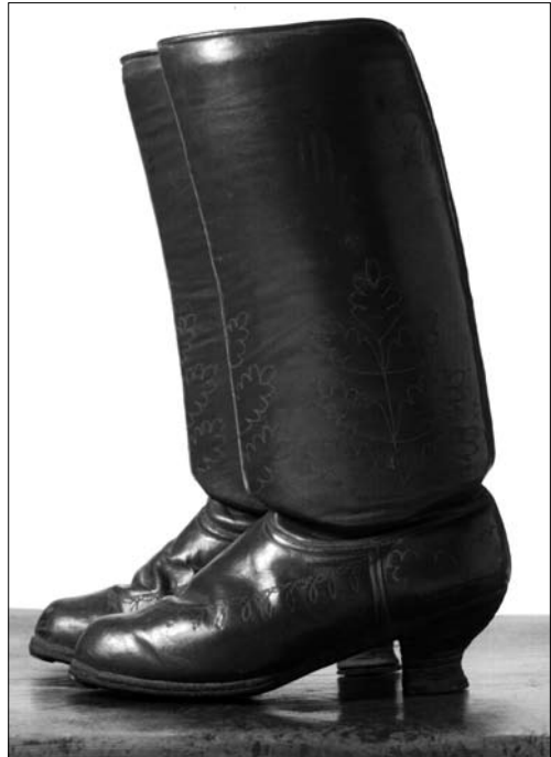
Іл. 5. Чоботи, с. Баламутівка Сторожинецького р-ну Чернівецької обл. Поч. ХХ ст. МЕХП ЕП-72145.

З 60-х рр. ХХ ст. зменшився попит на такі чоботи навіть у сільських мешканців, що зумовлено передусім соціально-економічними чинниками. Поява кращих гатунків шкіри промислового виробництва певною мірою сприяла удосконаленню форм взуття, кроїв, появи рантового взуття — чобіт і черевичок. На Буковині їх називали «калавирі» — це було святкове взуття селян, яке вже на початку ХХ ст. траплялося рідко. Аналізуючи інший тип взуття