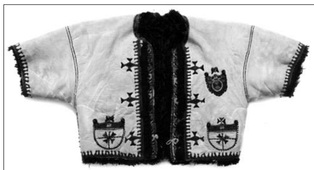
Іл. 16. Кожушок «лейбик», с. Вовківці Борщівського р-ну Тернопільської обл. 1920-ті рр. НМЛ Т-2807. Фото Т. Гіппа

кілька найхарактерніших силуетів: прямий; розширений до низу від лінії рукавів; розширений від лінії талії. Охарактеризовано два найпоширеніших крої кожухів: «кожух тулуб'ястий» і «кожушина» (поширені в центральних і східних регіонах України); довгі та «чемеркові», «кубіцькі», «прості» (типові для західних районів). Учена відстежила еволю-