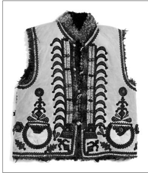
Іл. 10. Кептар, с. Корнич Коломийського р-ну Івано-Франківської обл. 1920—1930-ті рр. НМЛ Т-2114.