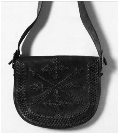
Іл. 24. Сумка «тобівка», м. Косів Івано-Франківської обл. Сер. XIX ст. МЕХП ЕП-16628.

найбагатше проявилася в кушнірстві, у пошитті кожухів і безрукавок. В арсеналі засобів оздоблення були нитки, тасьми, вовняні шнурки, сап'ян, тканина, металеві капслі, хутро. У декорюванні цих виробів майстри різних регіонів України органічно поєднували ті чи інші техніки. Найчастіше це аплікація сап'яном і сукном. Вчена підкреслила, що «високу майстерність і невичерпну фантазію у розробці мотивів, їх організації на площині засвідчили гуцульські й бойківські майстри». У кушнірських осередках Київщини, Чернігівщини, а особливо, Прикарпаття і Карпат, на переконання авторки, традиційні, оздоблені аплікаціями кожухи з кінця XIX ст. поступилися місцем вишиванням. Провідні узори виконували гладдю, козликом, стебнівкою, ланцюжковим швом.