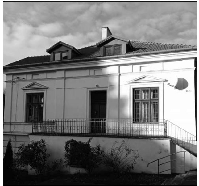
Іл. 2. Плебанія Греко-католицької церкви в Сяноку (сучасний вигляд)

На плебанії греко-католицької церкви св. Трійці у Сяноку було виділено кімнату, в якій представлено малочисельну експозицію давніх пам'яток, що стали добрим початком нової справи: «З гарячим бажанням, щоб цінні предмети старовини, музейної вартості, які для грядущих поколінь сталиб виразником розвою і культури нашої Лемківщини, не пропадали по наших дзвіницях і стрихах, рішили ми на взір Товариства «Бойківщина» в Самборі заснувати