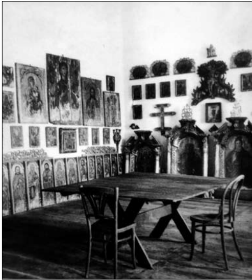
Лл. 4. Експозиція музею, кінець 1930-х рр.

реставраційної справи, пройшов навчання у Львові в М. Драгана та Я. Музикової [4, арк. 66]. Завдяки плідній праці Геца музей щорічно поповнювався новими експонатами, причому не лише мистецькими. Для прикладу: 1934 року збірка «Лемківщини» збагатилася 55-ма фрагментами ранньосередньовічної кераміки з укріпленого поселення Ступниця (зараз Дрогобицький р-н Львівської обл.), що стало помітною подією в історії археології цілого краю [5, с. 390—403].