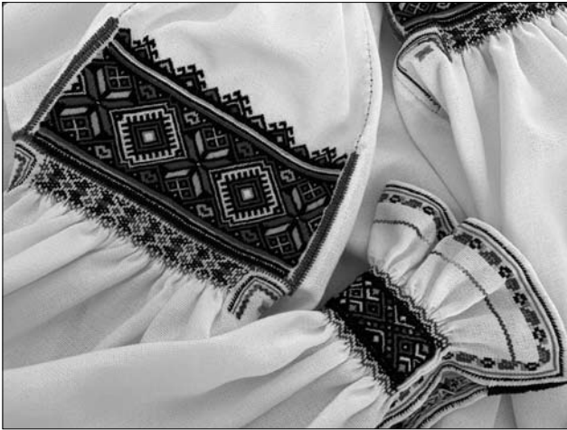
Іл. 6. Виконала М. Мулява. Рукав жіночої сорочки. Фрагмент. 2019 р. Фабрична тканина, низинка, стебловий шов, кривулька, шов позад голку, вишивка по брижах, підгин прутиком, змережування, хрестик.