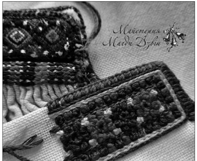
Іл. 10. Виконала Г. Рогатинська. Рукави жіночих сорочок. Фрагменти. 2018 р. Фабрична тканина, кучерявий шов, ланцюжок, стебловий шов, обробка краю на додаткову нитку. Фото опубл.: https://www.facebook.com/majsterniamagdydzvin/photos

щороку налічував від 7 до 12 учнів у межах однієї навчальної групи. Кількість таких груп збільшувалась, і в 2016 році їх було вже три, а в 2017, 2018, 2019 та 2021 рр. — п'ять. А доволі популярний курс «Нерахункові види гладі» спонукав до оголошення аж 6-ти наборів уже впродовж першого року його впровадження.