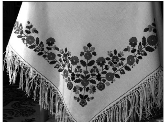
Іл. 5. Виконала Т. Смольська. Хустка. 2018 р. Фабрична тканина, двобічна гладь, стебловий шов, підгин прутиком, тороки.

тіння в українській народній традиції», у межах якого вивчають особливості оздоблення деталей сорочки технікою гачкування, виготовлення декоративних елементів (китиці, тороки) та мережив тощо.