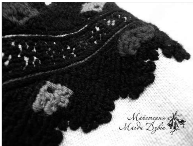
Іл. 2. Виконала Г. Рогатинська. Жіноча сорочка. Фрагмент. 2018 р. Домоткане полотно, верхоплут, колодки, пряма гладь, стебловий шов, ланцюжок, морщення.