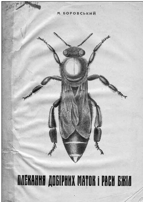
Іл. 2. Боровський М. «Плекання добрих маток і раси бджіл». 1932 р. Обкладинка