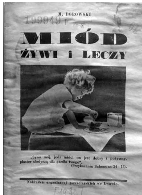
Іл. 1. Боровський М. «Мід як відживчий і лічний середник». Титульний аркуш польського видання 1937 р.

Книжка « Мід як відживчий і лічний середник » (1932) [15] отримала порядковий номер 84 у серії «Бібліотека «Сільського Господаря»». Тут у сконденсованому вигляді охоплено широке коло питань, пов'язаних з медом як споживчим та лікувальним засобом. Подається хімічний аналіз меду, перелічуються види солодкого продукту та їх лікувальні властивості, наводяться думки відомих вчених, бджолярів та лікарів з цього приводу (Теофіла Цесельського, Себастьяна Кнейпа, Сергія Шелухина, Мар'яна Панчишина), а також основні засади