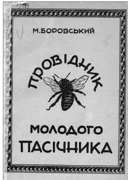
Іл. 7. Боровський М. «Провідник молодого пасічника». 1939 р. Обкладинка

ISSN 1028-5091. Народознавчі зошити. № 1 (169), 2023