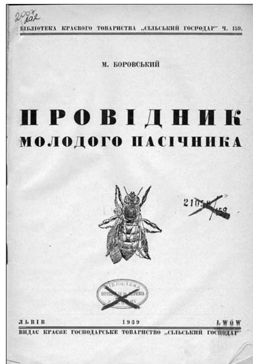
Іл. 8. Боровський М. «Провідник молодого пасічника». 1939 р. Титульний аркуш

вників вбивання маток задля збільшення медозбору. Цього ж року у часописі «Український Пасічник» з'явилася прихильна рецензія на видання двох авторів [39]. Рецензент, докладно проаналізувавши