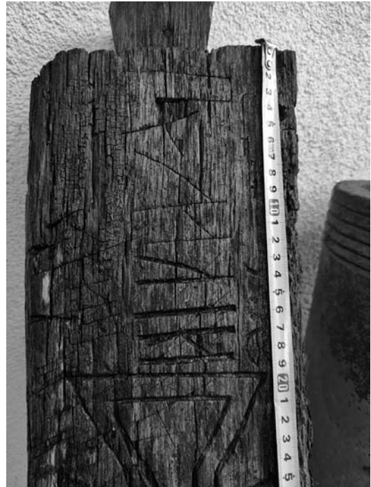
Іл. 3. Фрагмент дошки

Після закінчення зведення стін та стелі майстер прибивав до сволока хрест із квітами. Господар, у свою чергу, прив'язував до нього кожух («щоб у домі було тепло»), скатертину та хустку із хлібом і сіллю (їх потім дарували майстрові) [13, с. 246]. З апотропейною метою, за сволок клали часник і полин [14, с. 180]. Також повсюдно в українців зафіксовано вирізьблювання на ньому знаку хреста, різноманітних символів (розети, ріжок місяця, орнаментовані смуги тощо), написів (здебільшого це було ім'я господаря, який ставив хату, дата спорудження