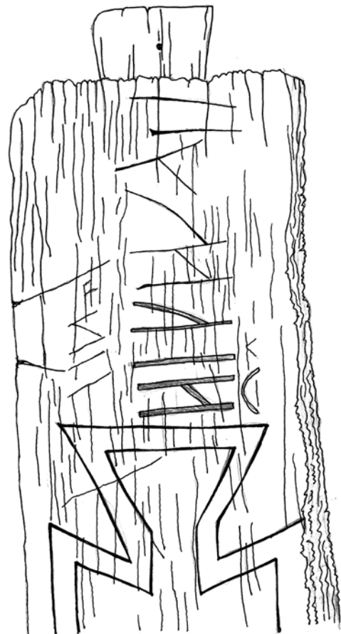
Іл. 4. Фрагмент дошки (прорисовка Т. Наконечної (Гощіцької))