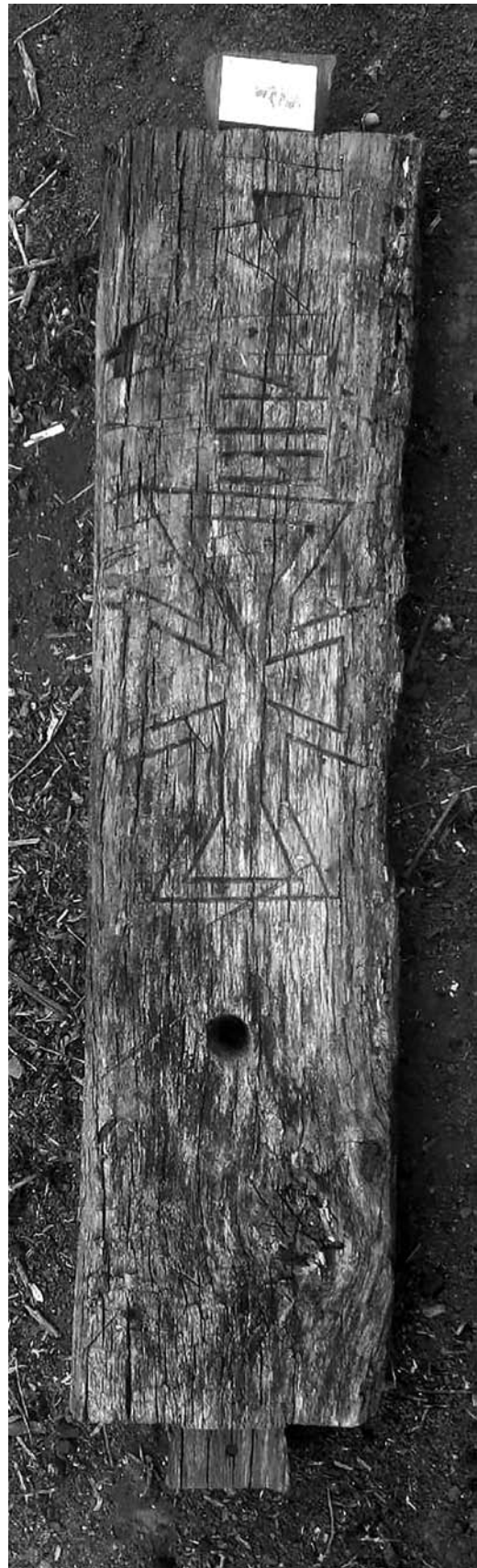
Іл. 1. Дошка із різьбленням із с. Суржа Хмельницької обл.

Хрест та напис кириличними літерами були нанесені з того боку балки, який лежав на цегляній стіні. Це чотириконечний хрест із трикутними раменами (в який вписано аналогічний за формою менший хрест), або ж можна описати його як виконаний по-