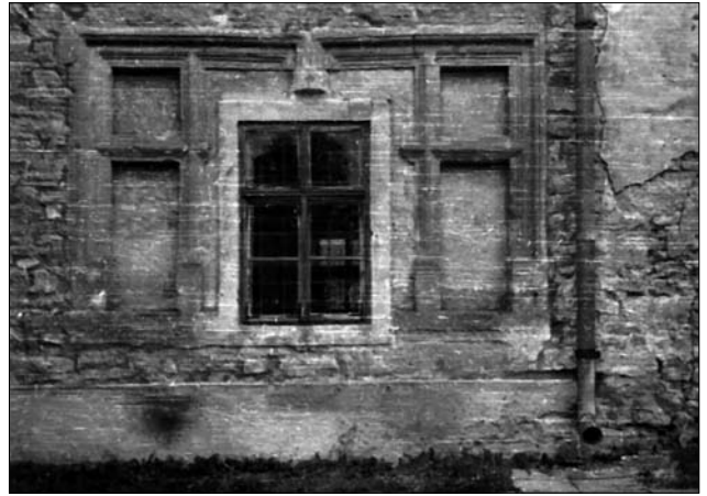
Іл. 5. Відновлені вікна фасаду Сяноцького замку

Інтенсивна праця йшла не лише над побудовою нової експозиції: «Відвідав наш музей старкомісар Maerkel (Меркель), тому пару день і праця наша на замку йому так сподобалася, що він зафірував нам 2000 зл. на віднову фасада замку — під услівем