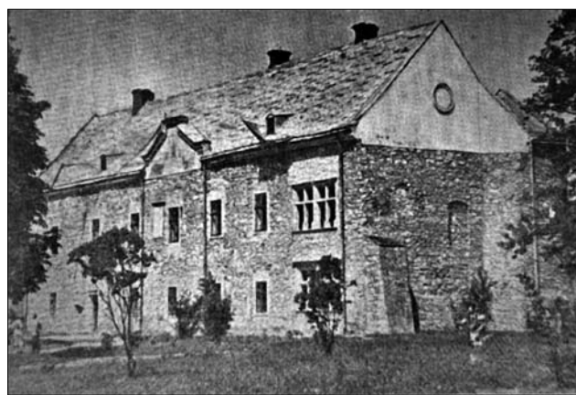
Іл. 3. Сяноцький замок в період окупації

таврується і дві кімнати малюються і приводяться до порядку. Вже завтра перейду з направою на перший поверх. По реставрації — приступаю до упорядкування музею» [2, с. 193].