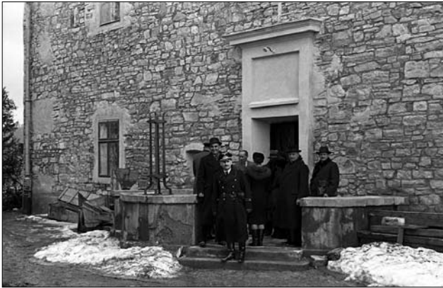
Іл. 4. Після зустрічі з представниками німецького уряду, квітень 1940

до противників німецьких. Було дуже небезпечно. В такий час Губер прислав мені понад 100 кольорових портретів Гітлера до роздачі по лемківських селах. Використовування музею до такої роботи вважав я невідповідним і разом із помічною силою С. Стефанським, при зачинених дверях музею спалив я 100 портретів Гітлера в печі музею. Дуже боявся Стефанський — але разом зі мною виконали ми сей смілий крок. Портрети Гітлера на наших землях вважав я невідповідною образою...» [4, 3/8, арк. 94].