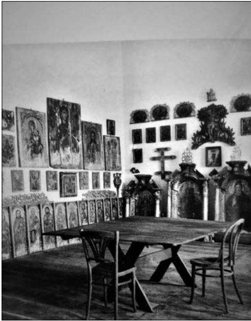
Іл. 6. Експозиція лемківського музею в приміщеннях Сяноцького замку. 1941

на пам'яток з Бахіра була відправлена до Кракова, інші — залишилися в збірці музею.