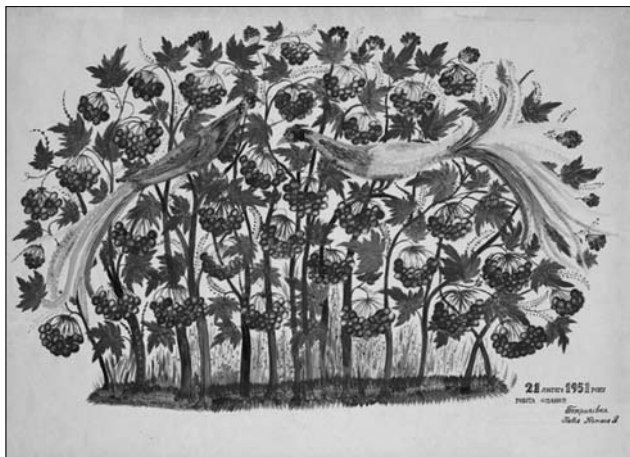
Іл. 4. Т. Пата. Декоративне панно