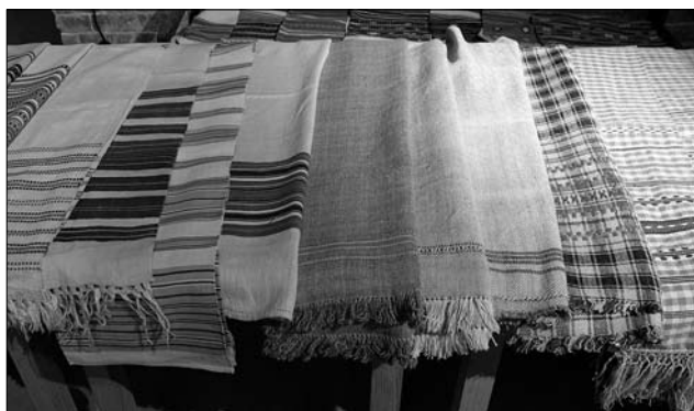
Іл. 1. Підготовка експонатів Музею народної архітектури та побуту ім. К. Шептицького (м. Львів) до виставки «Тчи, сестричко, рушники»

Обмін досвідом, вивчення можливостей збереження й відновлення унікальних технологій етнографічного текстилю українців та литовців у межах заявлених проектів спрямоване на виявлення найбільш доцільних й ефективних його параметрів для застосування в сучасних творчих практиках. Наукове осмислення, опрацювання і фіксація основних етапів виконання, з'ясування художніх особливостей і можливостей застосування в сучасному побуті на сьогодні вкрай необхідне, оскільки чимало регіональних технологій виготовлення етнографічного текстилю Західної України і Литви перебуває під загрозою зникнення, головним чином через відсутність і зміну сировинної бази, недостатність ринку збуту, модні тенденції тощо. Актуальність проектів набула децю іншого значення у зв'язку з повномасш-