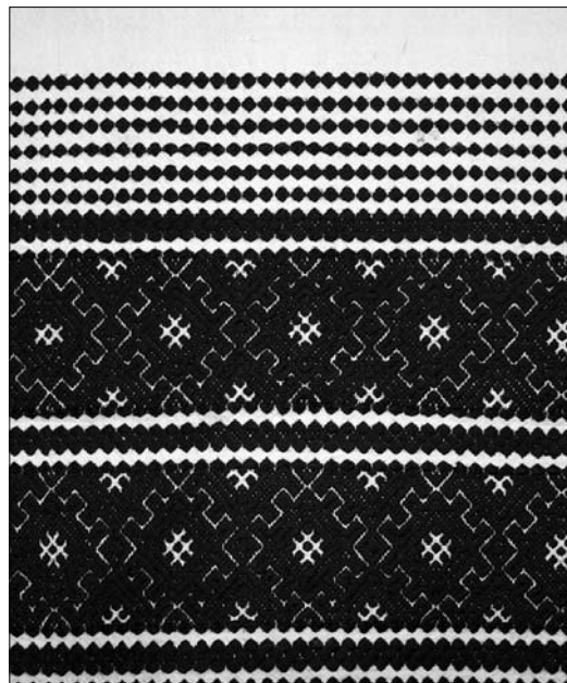
Іл. 8. Рушник «на гредку», с. Стеблівка Хустського р-ну Закарпатської обл. Бавовна, вовна; ткання перебором. Музей етнографії та художнього промислу ІН НАН України, ЕП-81678