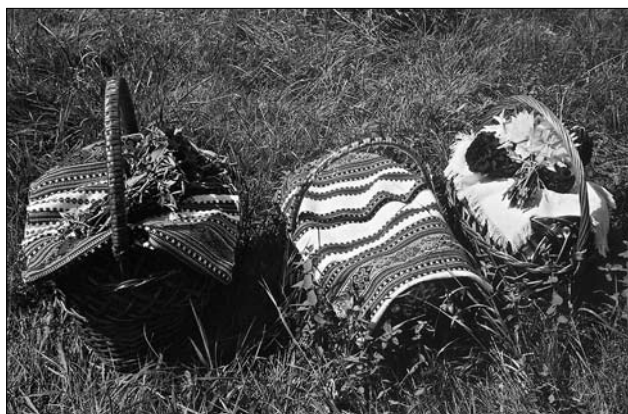
Іл. 12. Фото з виставки «Тчи, сестричко, рушники». Кошик із садовиною на Спаса, с. Космач Косівського р-ну Івано-Франківської обл. Світлина О. Никорак, 2003

виробів для одягу й інтер'єру житла поступово еволюціонувало від ощадливих мінімальних до дедалі складніших і вишуканіших засобів мистецької виразності. Розроблялися нові мотиви орнаменту, відшліфовувалася їхня форма, збільшувалася їхня чисельність, розширювалася і увиразнювалася кількість схем композиції. Ці принципи з плином часу модифікувалися, збагачувалися новими надбаннями і теж ставали основою для наслідування та створення нових орнаментальних композицій.