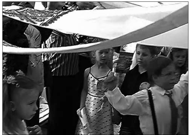
Іл. 5. Випуск у дитячому садку. м. Львів. 2008.