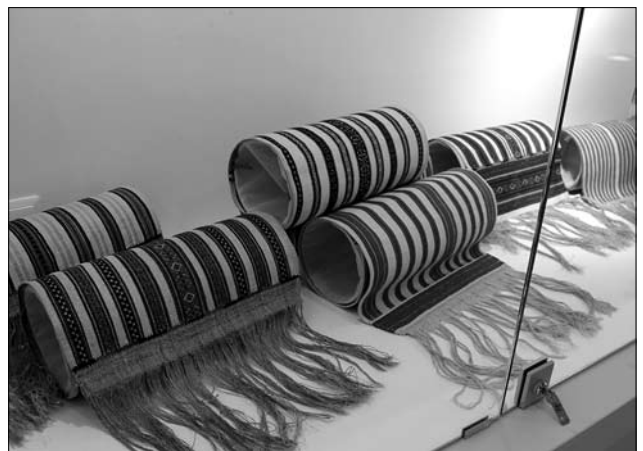
Іл. 9. Експозиція українських рушників на виставці «Тчи, сестричко, рушники»