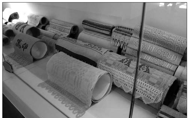
Іл. 10. Експозиція литовських рушників на виставці «Тчи, сестричко, рушники»

шик, писанки, а також колекція різноманітних поличок для завішування рушників, традиційних для литовських інтер'єрів.