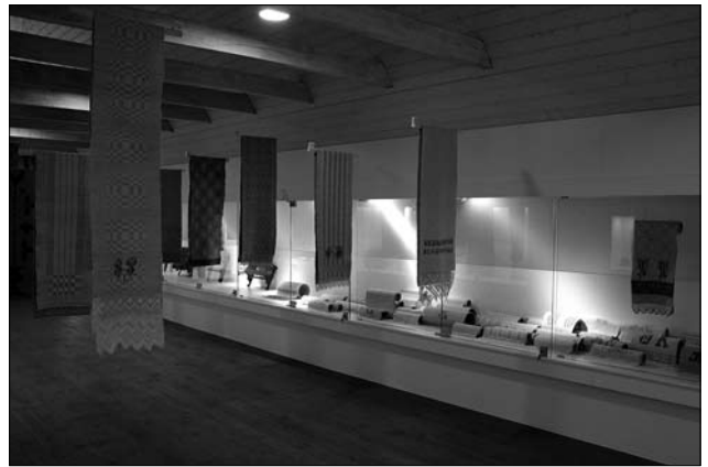
Іл. 8. Експозиція литовських рушників на виставці «Тчи, сестричко, рушники»