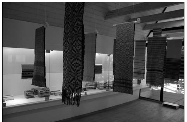
Іл. 7. Експозиція українських рушників на виставці «Тчи, сестричко, рушники»