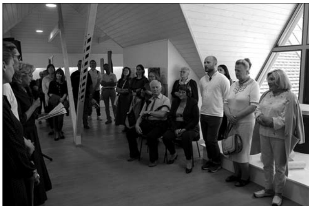
Іл. 11. На відкритті виставки