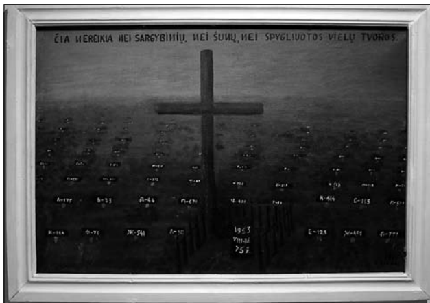
Іл. 19. Александрас Косткус-Косткевічюс. «Тут не потрібна охорона чи собаки» (Цвинтар 29-ї шахти Воркути). 1988. Картон, олія

ноподільські дещо коротші. Прикметною ознакою таких виробів Західного Поділля, зокрема Тернопільщини, є те, що крім названих «скосіків», «клинців», «пальців» у них трапляються й скісні зубці та S-подібні мотиви «качечки». Техніку закладного ткацтва поєднували із полотняним, саржевим, репсовим та перебірним тканням.