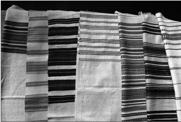
Іл. 2. Поліські рушники МНАП, відібрані для виставки «Тчи, сестричко, рушники»