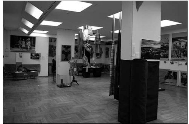
Іл. 20. Фрагмент експозиції виставки «Бавовняний код»

Оригінальністю відзначаються і орнаментальні композиції, створені технікою перебору, в рушни-