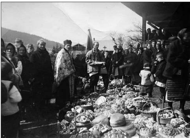
Іл. 4. Гуцульщина. Свячення пасок у Космачі. Косівський р-н Івано-Франківської обл., Україна. Перша половина ХХ ст.