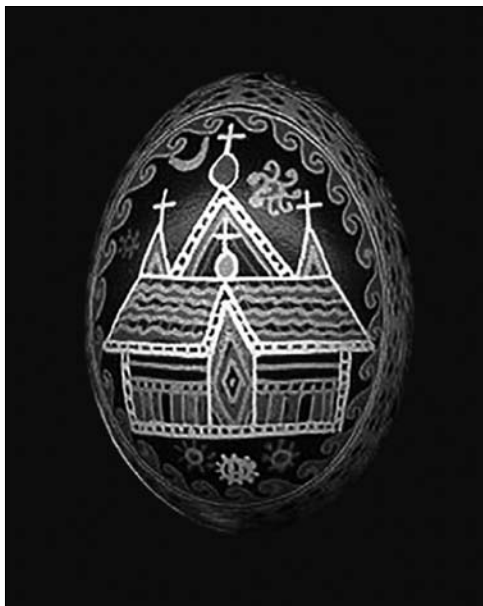
Іл. 1. Никорак О. Писанка «Церква». Восковий розпис по курячому яйці. 1982