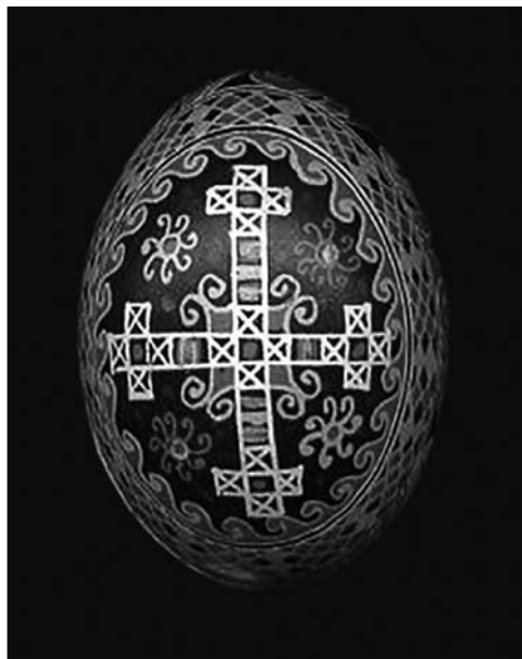
Іл. 3. Никорак О. Писанка «Хрест з сонечками». Восковий розпис по курячому яйці. 1989