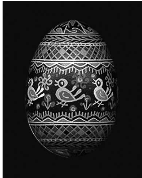
Іл. 6. Никорак О. Писанка «Пташки». Восковий розпис по курячому яйці. 1998

Спираючись на традицію свого регіону, майстриня писанкового розпису Олена Никорак виважено використовує дрібні геометричні мотиви у поєднанні зі стилізованими рослинними та зооморфними формами, мотивами космацької вишивки і ткацтва. Глибоке знання народного мистецтва Гуцульщини дозволило художниці широко залучити традиційні елементи і мотиви, притаманні для писанок і вишивки Космача: «безконечник», «хрест», «княгинькове» («княгинькове»), «ріцькі», «вічка», «сонечко», «грабельки», «деревце», «раховане», «церковця», «олень», «коник», «баранчик», «пташка», «рибка» і, разом з тим, — збагатити традицію власним творчим внеском (створення авторських композиційних схем писанок, нова інтерпретація мотивів, вишуканий рисунок фігуративних зображень — улюблених «оленів», «коників», «пташок», «рибок»). Для писанкового розпису Олени Никорак характерна жива й емоцій-