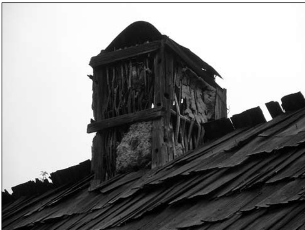
Іл. 7. Головка комина-вивода; с. Витвиця Долинського р-ну Івано-Франківської обл.

комини траплялись тут уже у першому десятилітті ХХ ст. Зокрема, як відзначав М. Зубрицький, з існуючих у с. Мшанець (Стар.) станом на 1909 р. дев'ятнадцяти коминів-виводів, більшість була цегляними [4, с. 486].