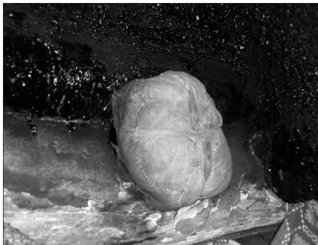
Іл. 1. «Каглянка»; с. Брагівка Богородчанського р-ну Івано-Франківської обл.

У тому разі, коли дим з коми́на-димозбірника крізь вертикальний димоволок виводили безпосередньо на горище, на «поді» над отвором з глини, каміння чи цегли вимуровували іскрогасник («бабу», «бовдур») [39, с. 312] — своєрідний ящик без однієї з бокових стінок. Місцями, передовсім на прибойківському Підгір'ї (де напівкурна система опалення поширилась швидше, ніж на основній частині Бойківщини), такий іскрогасник виплітали з прутів по каблуках, надаючи йому форми склепіння печі, і з двох боків обмащували глиною (с. Уріж Дрог.). Ін-