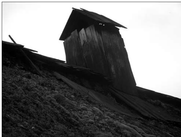
Іл. 5. Головка комина-виводу; с. Брагівка Богородчанського р-ну Івано-Франківської обл.