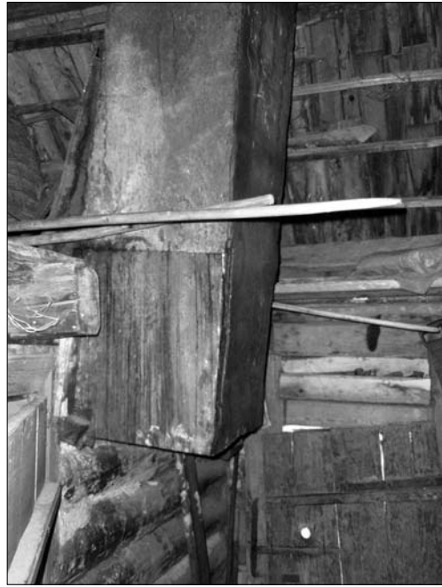
Іл. 3. Короб з дощок (з дверцятами для чищення сажі); с. Пороги Богородчанського р-ну Івано-Франківської обл.