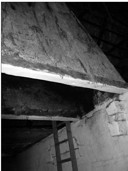
Іл. 4. Комин-вивід (на всю ширину сіней) у будівлях з двома житловими приміщеннями; с. Витвиця Долинського р-ну Івано-Франківської обл.

плетені лозовим пруттям, а потім усе те поліплене глиною» (с. Нагуєвичі Дрог.) [25, с. 245]. Проте тут могли використовувати й глиносолом'яні вальки: «Комин... Чотиригранна драбина, збита з палок; драбину обплітали довгими, як рука вальками з довгої соломи й глини» (с. Дорожів Дрог.)