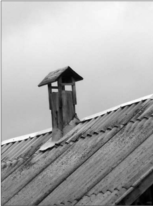
Іл. 6. Головка комина-вивода; с. Завадка Сколівського р-ну Львівської обл.