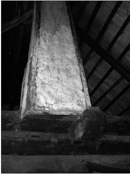
Іл. 2. Комин-вивід при пороговій стіні житлового приміщення; с. Лужки Долинського р-ну Івано-Франківської обл.