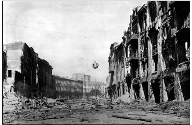
Іл. 6. Хрещатик у руїнах, вересень 1941 р. Більшовики застосували в центрі Києва тактику «спаленої землі» перед наступом нацистів.

Перша світова війна стала поштовхом до відновлення незалежності України, УНР — на землях колишньої окупованої російською імперією, та ЗУНР в результаті розпаду Австро-Угорської імперії. І хоча УНР та ЗУНР 22 січня 1919 р. оголосили про акт воз'єднання, це не допомогло втримати єдність під час збройної агресії як зі сторони більшовиків, так і зі сторони Польщі, Румунії. Таким чином, УНР захопили російські більшовики, а частини ЗУНР — анексовано Польщею, Королівством Румунія і Чехословацькою Республікою. Попри це ми бачимо ріст національної самосвідомості серед українців, а передовсім в армії. Найбільшою мотивацією служити у війську було відновлення незалежності України, це ми спостерігаємо в арміях УСС, УГА та УНР. Також показовим є особовий склад, де більшість складала інтелігенція. Відновлення незалежності, прагнення до самостійності мотивували вояків захищати Україну зі зброєю в руках, вони відчували, що їм випав унікальний шанс творити власну державу. Го-