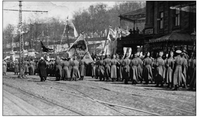
Іл. 4. Українізовані війська у Києві, 1917 р.

Велику увагу військове командування приділяло українізації полків. 18 липня 1917 р. командувач Південно-Західним фронтом Л. Корнілов видав на-