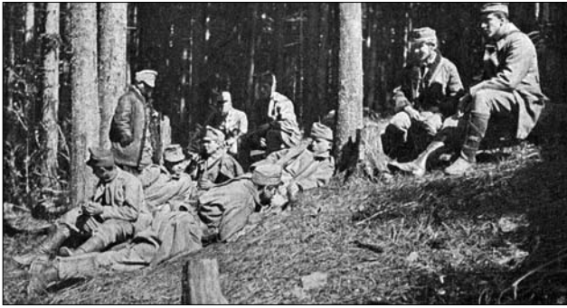
Іл. 5. Бійці УСС. Гора Маківка, квітень 1915 р. (Фондова збірка, Мейл-Арт Музей, місто Львів. Джерело: https://cutt.ly/IwzfmKrg )