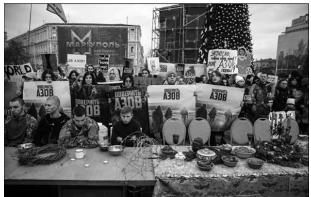
Іл. 17. Акція на Софійській площі в Києві, 24 грудня 2022 р.

ших оборонців Маріуполя. Найбільш поширеною в Інтернет-мережі є теза «Де Азов?». Акції для привертання уваги до полонених «азовців» часто влаштовують рідні та небайдужі громадяни на вулицях українських міст із плакатами «Де Азов?», «Поверніть Азов», «221 день полону», «Герої Азовсталі мають бути звільнені» [118] (іл. 17).