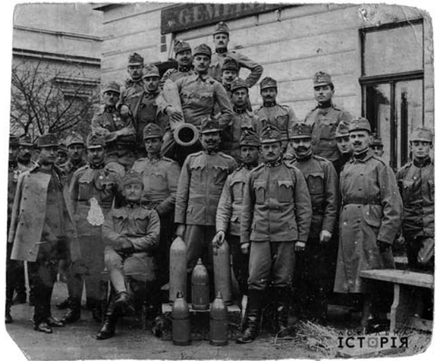
Іл. 2. Старшини артилерійського відділу австро-угорського війська, 1910-ті рр.

Наприкінці XIX — на початку XX ст. в Галичині та на Буковині почали організовуватися національні формування, їх утворенню передувала діяльність ряду легальних державних організацій спортивного і парамілітарного характеру, таких як «Соколи» (1894 р.). Напередодні Першої світової було сформовано близько 900 таких груп, які були об'єднані в єдиний центр «Сокіл-Батько». З 1909 р. при сокільських організаціях формуються напіввійськові групи — Стрілецькі курені. У 1900 р. з'являється нове українське об'єднання «Січ», яке мало пожежно-спортивний профіль, що дозволяло проводити тренувальні збори з холодною зброєю, а передовсім вправи з гуцульськими топірцями і списами. У 1911 р. утворився український аналог скаутського руху — «Пласт». У 1912 р. виникли перші легальні організації «Січових стрільців», які мали воєнізований характер і могли використовувати вогнепальну зброю [12, с. 208—209]. Австрійська влада прихильно ставилась до створення таких організацій, як «Пласт» і підтримували діяльність гуртка. Для українців ці об'єднання стали можливістю для молоді об'єднуватися навколо патріотичної ідеї, мали на меті виховувати в молоді єдність, народну силу і почуття честі та гідності шляхом вдосконалення фізичних якостей, витривалості, розумінні праці у спільному гурті та дисципліну. Саме ці поняття були