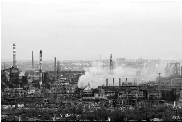
Іл. 15. «Азовсталь» у Маріуполі, який захищають українські бійці, 5 травня 2022 р.