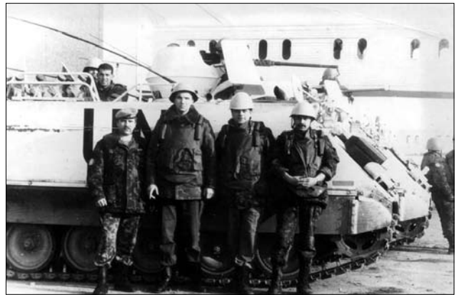
Іл. 11. Українські миротворці фотографуються на згадку біля БТР. Аеропорт Сараєво, 1992 р.

Єдиний варіант, де можна було здобути військового досвід на полі бою та проявити свою ініціативність, мужність, сміливість до 2014 р. була участь у миротворчих місіях. Близько 45 тисяч українських військовослужбовців отримали такий досвід виконання завдань у складних умовах і в зонах бойових дій, зокрема в Іраку, Афганістані, під егідою ООН на Балканах. Також українські добровольці, представники УНСО брали участь у бойових діях на боці Грузії у війні із росією, а також допомагали народу Чечні в боротьбі за свободу від російської окупації. Слід зазначити, що багато грузинів та чеченців сьогодні воюють на боці України проти російської оку-