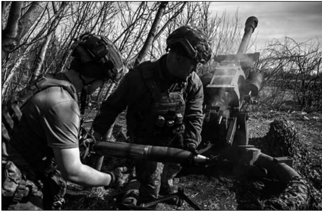
Іл. 22. Українські військові завантажують снаряд у 105-мм гаубицю М119.

рівень цинізму, коли мова заходить про згвалтування, адже в злочинців під час суду над ними виникає найбільше почуття несправедливості — як це за такий злочин дають більший строк покарання, ніж за вбивство [143, с. 54—66].