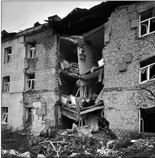
Іл. 13. Житлові будинки в Бахмуті часто напівзруйновані.