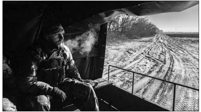
Іл. 19. Українські військові на дорозі поблизу Бахмута, 8 січня 2023 р.

16 січня 2023 р. ЗСУ були змушені відступити від м. Соледар, оборона якого тривала з серпня 2022 р.: «Задля збереження життя особового складу Сили оборони відійшли від Соледару і закріпилися на заздалегідь підготовлених рубежах оборони. Оборонці Соледара створили справжній подвиг не зважаючи на перевагу ворога у 3—5 ра-