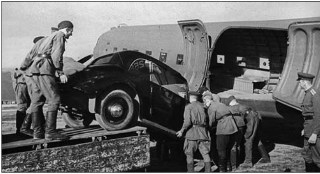
Іл. 7. Червоноармійці вивозять автомобіль Opel з Німеччини.