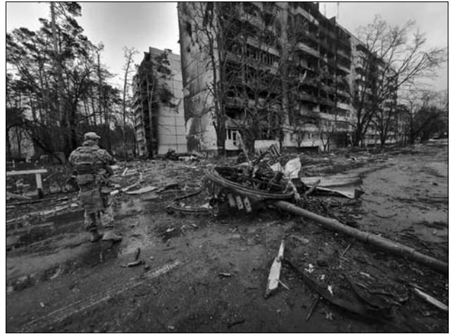
Іл. 14. Деокупація Київщини.

мійської авіації, повітряних сил такі бої не вели в АТО. В ООС повітряні сили, армійська авіація не застосовувались для ударної дії, для завдання ударів, але вони були на рівні готові». Воїни часто зустрічали вдячних мешканців населених пунктів, які вони звільнили: «Найголовніше, вони спочатку казали: «Чому ви нас кинули?»», кажу: «Ми вас не кинули», вони кажуть: «Ви нас не кидайте більше. Ми не хочем, щоб ви нас знов кинули», кажу: «Ну ми зробимо все, що від нас буде залежним». Приємно: стоять діти з прапорами: «Підпишіть нам прапор, ви наші визволителі». Згадуєш своїх дітей — щось так «йюкає»» [108]. З впевненістю можна сказати, що звільнення Київської, Чернігівської та Сумської областей стали ключовими факторами у подальшій боротьбі, а також стали додатковою мотивацією для українських воїнів боротися за свою землю.