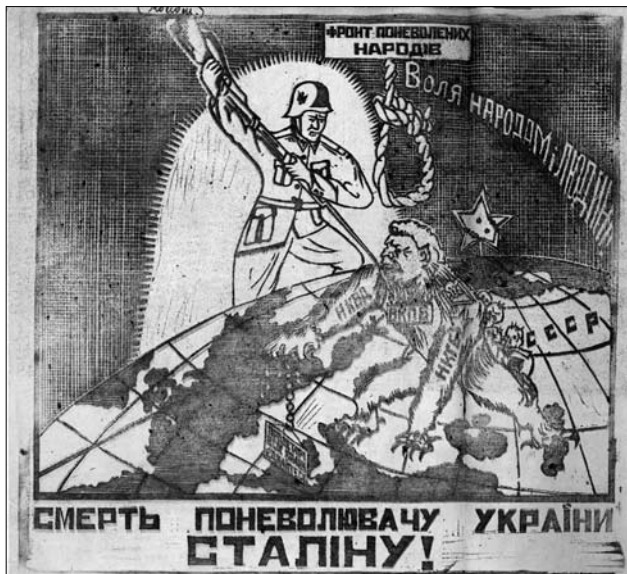
Іл. 9. Карикатура на Сталіна та радянську владу.

реному у 1949 р. Радянську армію залучали до знищення збройного опору окупаційного радянського режиму на заході України та в Балтійських країнах (опір чинили партизани УПА на заході України і «лісові брати» в країнах Балтії). Офіційною мовою Радянської армії була російська, призвані до служби військовозобов'язані відбували службу поза межами своїх республік. У війську були відсутні іншомовні культурні розваги, фактично радянська армія стала знаряддям русифікації народів СРСР. У політичному навчанні серед вояків поширювався російський шовінізм, у приклад ставили винятково російських «героїв» (М. Кутузов, О. Суворов, Ф. Ушаков, Р. Малиновський та ін.) [45, с. 115—118].