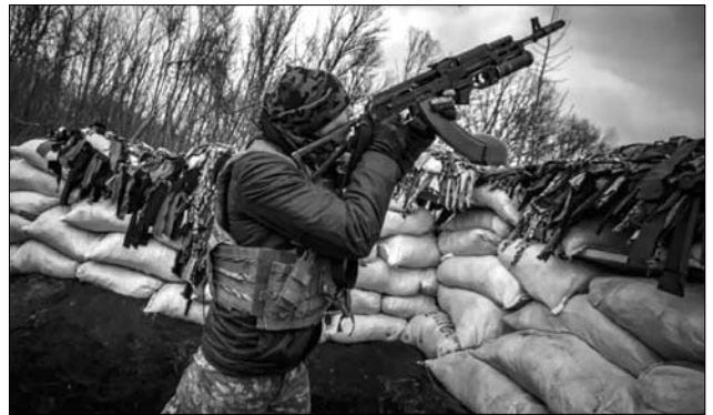
Іл. 20. Український солдат стріляє по безпілотнику з окопа під Харковом.

зів, потужно тримали свої позиції. Вони завдали ворогу величезні втрати в особовому складі, які можна порівняти з втратами агресора в двох чеченських війнах» — речник східного угруповання ЗСУ Сергій Череватий [125]. Українські війська завдали великих втрат противнику, підступи до позицій ЗСУ були «всіяні тілами» загиблих бійців противника [126]. Зима і початок весни стали справжнім випробуванням для українських сил оборони. Фактично фронт в деяких регіонах або не змінився, а в деяких районах загарбнику вдається його просунути на свою користь [127; 128] (іл. 20).