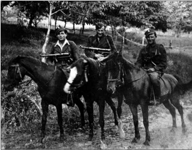
Іл. 8. Кінна розвідка УПА.

цій пісні проявом мужності є захист своєї країни зі зброєю в руках. А також бачимо прийняття сценарію загибелі за свою землю. Цей фаталізм можна прочитати в останніх рядках: «Українські повстанці боролись, як могли, останні набой для себе берегли». Тобто мужність — боротися до кінця, і не здаватися ворогу (іл. 8).