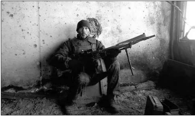
Іл. 17. Донецький аеропорт, листопад-грудень 2014 року

ми цими, нога синя, але вже міг надівати якесь взуття. (Іл. 16).