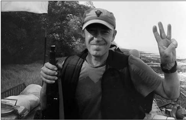
Іл. 2. Передали свої позиції 14-й ОМБр, дорога додому, кінець вересня 2015 року