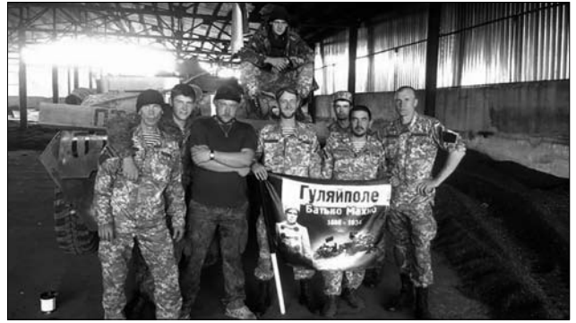
Іл. 18. Вийшли з оточення, під Маріуполем, 2014 рік

Це був січень місяць 2015 року. Завдання виконали, хлопці усі вийшли. І, до речі, про те, що всі різні. Був у нас підполковник один, який за посадою старшого лейтенанта. Може, це звичайно рано, але він