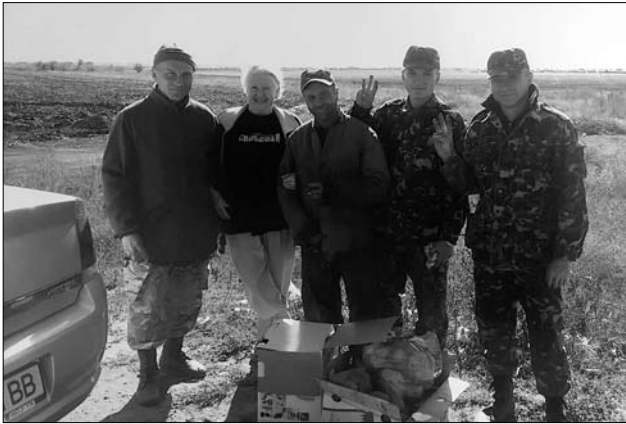
Іл. 9. Передача волонтерки для хлопців, які нас замінили на «Ширлані», листопад 2015 рік