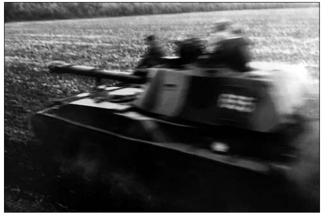
Іл. 15. «Швидкий постріл — швидкий переكات, з вітерцем», серпень 2015 рік

І я попав на госпіталь. Я думав, що це перелам такий, поставлять гіпс та і всьо, місяць-два, загоїться і піду знову на фронт. А там прийшлося операцію робити, я кажу: «Шо там операція, я не хочу ніяких операцій». Мені в госпіталі кажуть: «Ти дурний, у