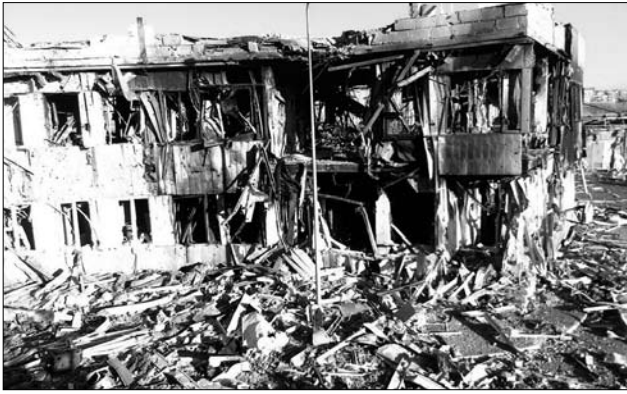
Іл. 13. Донецький аеропорт, листопад-грудень 2014 року