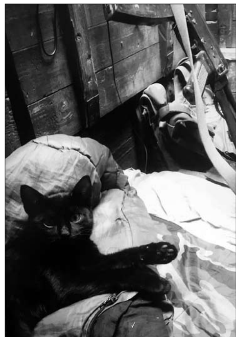
Іл. 16. «Наша киця в нашому куріні», серпень 2015 рік

тебе п'ята, вже на 1,5 см нога коротша. Ми не маєм права, по-перше, не зробити операцію. Ти військовий, в бойових умовах получив цю травму. Будемо різати, будемо ставити тобі железяки». І це от затягнулося десь на 4,5—5 місяців у мене пішло. А вже, як тільки вийшов з госпітала, хірурги, які там писали «придатний/не придатний», він каже: «Я можу так написати або так». «А що ти там можеш написати?». «Ну, якщо я напишу, що ти частково придатний, то дослужувати будеш в Чабанке — там наша 28-ма бригада, — а якщо придатний, значить, поїдеш на фронт». «Пиши, що я придатний». Коли вже госпіталь сказав «Всьо, ти готовий». І я з железяка-