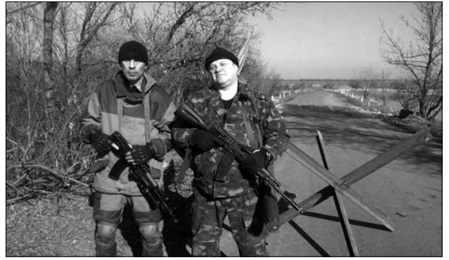
Іл. 21. Красногорівка, березень 2015 рік

Місцеве населення почало там бузити і заборонили нашим хлопцям зі зброєю виходити в село до крамниці. І от тоді почались випадки. І тоді сепарня зі зброєю почали викрадати наших хлопців. Ну ти ж без зброї, зайшов в магазин, виходиш з магазину, а сепарня в штатському тебе круте, пістолет, чи шо там. Доктора нашого, Дока викрали, я вже був у госпіталі тоді. Я точно не пам'ятаю. Він ще ногу мою оглядав, коли то трапилось. Високий такий, молодий, молодший за мене, може років 40. Не знаю, мені сказали, що його викрали, а що далі з ним сталося, я не знаю. Але от на останньому марші [на