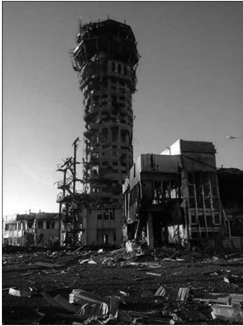
Іл. 22. Донецький аеропорт, листопад-грудень 2014 року

Усі хлопці підписувалися, кожен складав прапор і в рюкзаку носив. Побажання різні [писали на прапорах один одному]. «На довгу пам'ять». Серед побратимів були представники інших національностей. Ну, ось я громадянин росії. І чеченці є, росіян також дуже багато. Вони всі добровільно пішли захищати Україну».