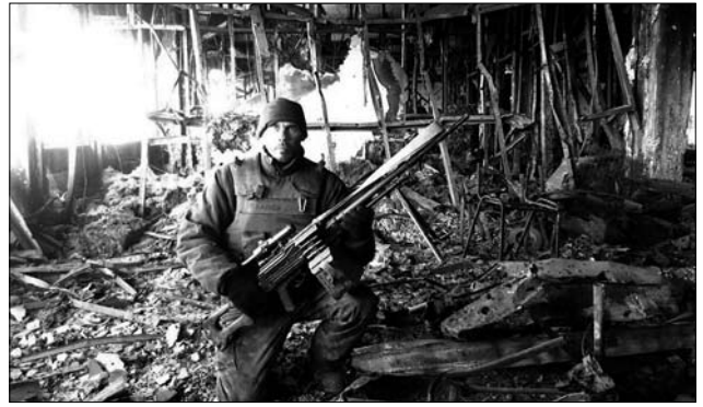
Іл. 7. Донецький аеропорт, листопад-грудень 2014 року

Перший раз я пішов в марті. То я пішов [у військкомат] перший, пробивався—пробивався, хер пробився. Потім ми з Фахрадом пішли в липні [2014-й рік], по-моєму, ми разом попали. 29-го, здається, призив був. Я приходив до того у військкомат і мене повертали, а потім вийшов закон, що до 60-ти років призив, бо до того було до 50-ти. А тут вийшов новий закон і я вже можу. Якось склалося так, я попав в 28-у бригаду, там був цирк, там посада у мене була — командир взводу радіорелейного і кабельного зв'язку в штабі бригади, ну якийсь отак. Ну і так спілкувалися з хлопцями і один мені сказав: «Я в руських стрелять не буду». «А чого?». Я тоді з ним розмовляв, він знає виключно москальську, короче москалі мене так мало хто розумів. І от я кажу: «Чого?». «А оні наші братя». «Чуєш, капітан, ти зі мною до передка не дойдеш». Ну і на раник «форму здати, всьо здати, навіть труси і носки, і