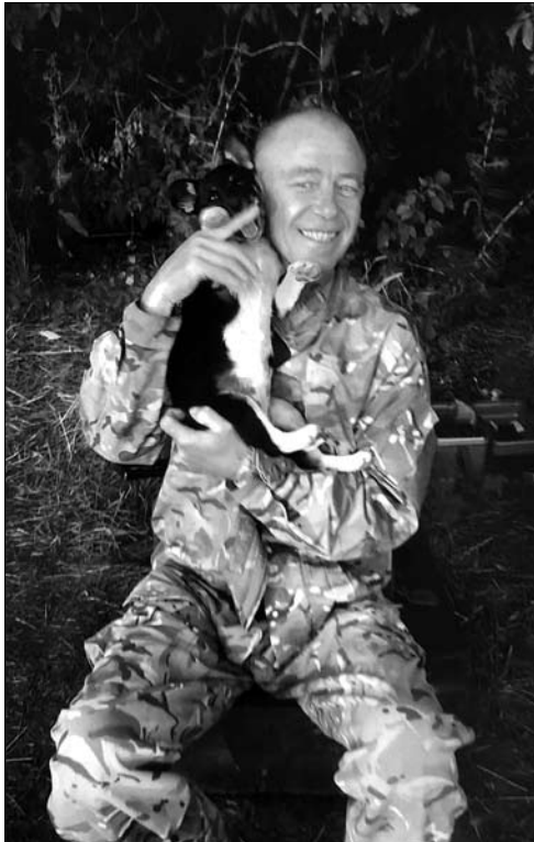
Іл. 19. «Друг», вересень 2015 рік (фото Кілара Юрія)