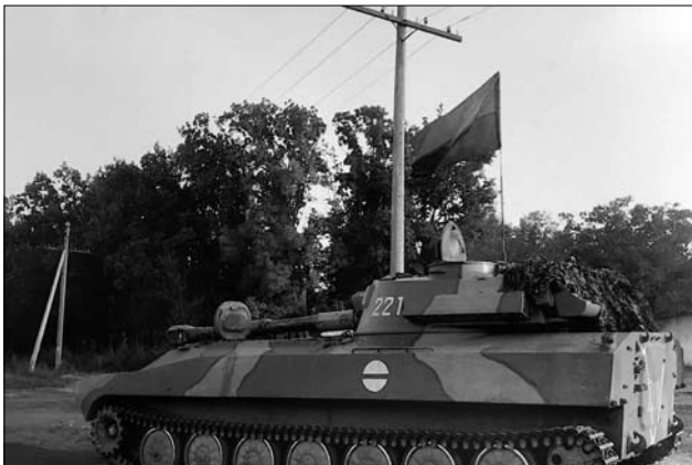
Іл. 20. «Червоно-чорні прапори хлопці берегли для деокупації Донецька. На жаль, деокупацію Донецька не пощастило здійснити», вересень 2015 рік (фото Кілара Юрія)

І вони починають дратися, сваритися, скажемо так. Щось той сказав, буркнув не так. І тут от дивися, тільки вони пішли, набуцькали один одного, так, по—хлопчачи, хто сильніший, скажемо так. В таких випадках ми старались так екіпажі робити, щоб вони дружили один з одним. А цей і екіпаж нормальний і всьо, щось той буркнув не то. (Іл. 19).