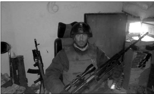
Іл. 10. Донецький аеропорт, листопад-грудень 2014 року

тини, інструмент, акумулятори. Я, як зампотех, сам їздив, відпрашувався в увольнительніє за свої гроші, там медні прокладки. От медні прокладки треба на двигатель, а їх там треба дуже багато. Приходиш в ремроту: «Давайте медні прокладки». «Я тобі можу дати дві штуки, і то китайські». «Та мені треба на кожне орудіє різних діаметров, і треба там по 40 прокладок. Ти чого? Як мені зараз ремонтувати?». «Не знаю». Я підходю до командіра дівізіона і кажу: «Так і так, полковник, давай пускай я поїду куплю хоть прокладки». Ну, короче, за свої гроші це всьо робили. (Іл. 9).