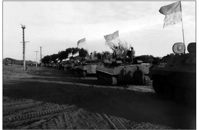
Іл. 23. «Після розвантаження з ешелона, вишикувались в колону, і почали рух на Ширлан», жовтень 2015

«Виїжджали ми вже не в повному складі, виїжджали тоді, коли вже молоді прийшли і досвідчені механіки-водітелі і офіцери. Ми практично вже виїжджали неповним комплектом, бо вже багато наших хлопців демобілізували походу. Вже до огневої приїжджала машина і грузились. Ми з ними прощались і вони вже їхали додому, а ми ще залишались. Офіцери і молоді, ми залишались, ми з ними залишались. Ми з ними до останнього пройшли знову на Ширлан, поставили машини, всьо, і вже тоді. Прапори [підписували один одному]. Це було перед виїздом, це нам волонтери передали через СБУ-шників чергову передачу і там в той передачі були прапори. Маленькі прапори кожному нашили і кожному дісталось по прапору. Я не підписував. Хлопці підписували один одному. Хто бажав, от він тобі підносив прапор. Я ставив знак сонячний. А писав «Слава Україні!» або «Героям Слава!». Привіз додому [свій прапор з підписом], тут лежить. На пам'ять. Так. Вже наші танкісти виїхали, міномьотчікі виїхали, поміняли їх оці 14-та бригада, а ми в самий останній момент. Чого, бо ми тримали. Якщо не дай Господь, нападуть на 14-ту, а вони ще по місцевості не дуже добре орієнтуються. А ми, як гармаші, якщо нападають на наші блокпости, то нам дають цілі і ми їх починаємо знищувати. Коли артилерія почи-