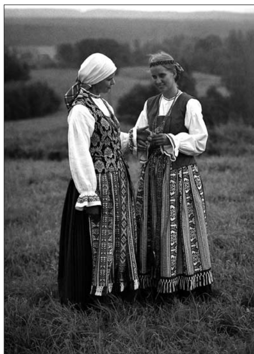
Іл. 9. Жіноче та дівоче вбрання. Занавикай Вілкавішкіського р-ну. Жемайтія. Перша половина ХІХ ст. Ілюстрація з Jurkuvienė T. Lietuvių tautinis kostiumas [12, р. 177]