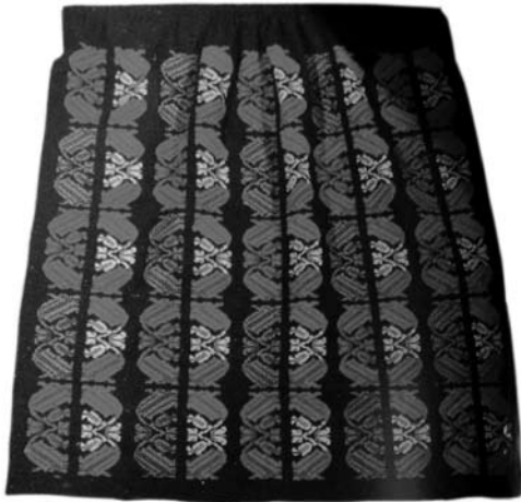
Іл. 14. Блажукене Я. Узорнотканий фартух Сувалкії. 2021 р. Виставка «Золотий віночок». 2022 р. Ілюстрація з Respublikinė konkursinė liaudies meno paroda. 2022. Katalogas [23, p. 12]