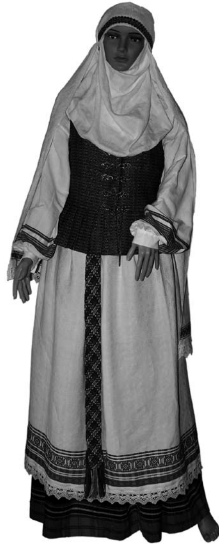
Іл. 5. Жіноче вбрання Аукштайтїї з узорнотканим фартухом. Кінець XIX ст. Музей народного побуту Литви (с. Румшішкес), постійна експозиція

Запаскам кожного історико-географічного району Литви притаманні свої характерні особливості, часто пов'язані із ткацькими техніками, які ретельно відтворює Я. Блажукєне. В Аукштайтїї носили переважно білі запаски, нижній край яких був оздоблений однією чи декількома смугами орнаменту, найскладніший з яких виконувався перебором, а простіші — дамаським чи сатиновим тканням [10, іл. 42; 12, р. 50] (іл. 5). Жемайтїйські запаски поділяють на декілька груп. Найдавніші з них виготовлені з льону полотняним переплетенням із орнаментальними смугами червоного кольору, який виконували технікою вибору з вивороту тканини. У другій половині XIX ст. запаски північної частини району ткали репсом, а червоний став у них домінуючим кольором. На півдні Жемайтїї білі запаски прикрашали вертикально-розташованими рядами червоних