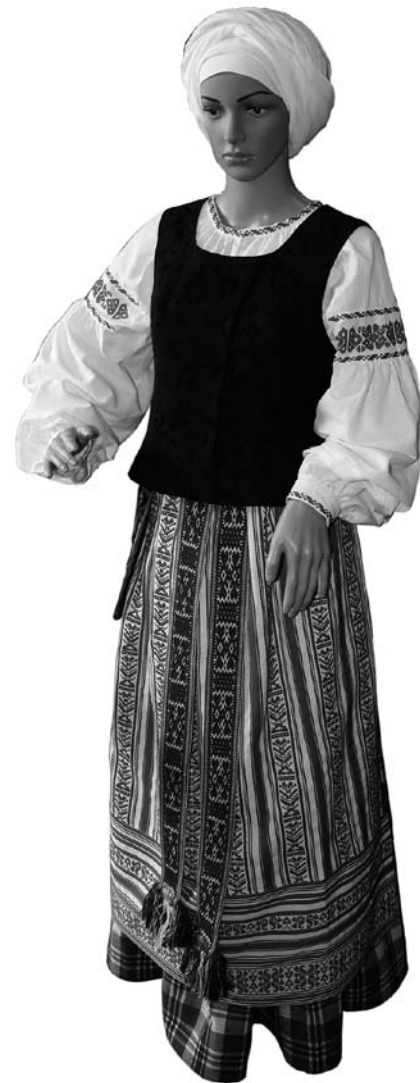
Іл. 7. Реконструкція жіночого вбрання з Малої Литви з узорнотканим фартухом. XIX ст. Майстерня національного костюму Муніципального центру етнічної культури м. Клайпеда. URL: https://www.etnocentras.lt/Event/Tautinio-kostiumo-dirbtuves/

Фартухи Малої Литви ткали з лляної пряжі поєднуючи в одному виробі орнаментальні смуги, виконані сатином, перебором та багаторемізним тканням червоною ниткою на білому тлі (іл. 7). Така тканина, ймовірно, імітувала шовкові полотна, які було заборонено носити литовцям-селянам [12, р. 103]. Ці обмеження були прийняті Сеймом Речі Посполитої у 1613 р. та введені в дію у 1620 р. і стосувалися також одягу українських селян та міщан. Зо-