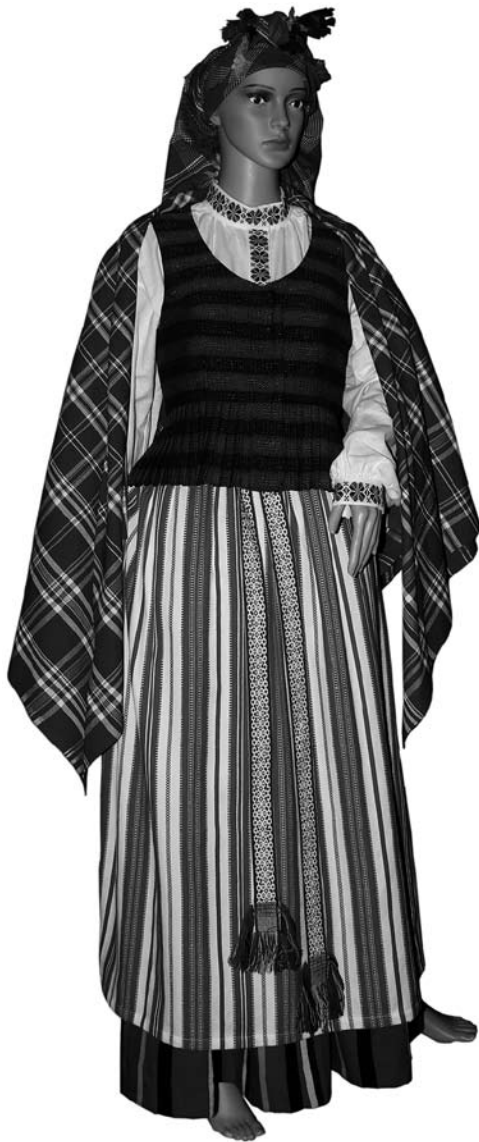
Іл. 6. Жіноче вбрання Жемайтії з узорнотканим фартухом. XIX ст. Музей народного побуту Литви (с. Румшішкес), постійна експозиція

рою. Ці вчені припускають, що крій жіночих спідниць був переосмислений на основі моди ренесансу, зразки якої частіше зустрічаються у південних країнах [12, р. 103].