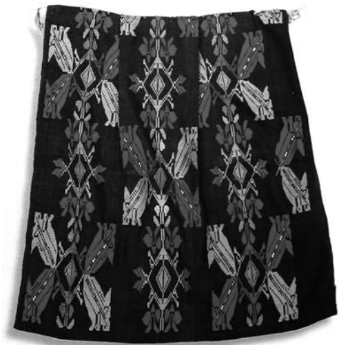
Іл. 11. Узорнотканий фартух, с. Будвечай Мар'ямпільського муніципалітету, Сувалкія. Початок ХХ ст. Ілюстрація Suvalkiečių prijuostės. Katalogas [17, р. 31]

ними візерунками, розділеними групами кольорових смуг. У кінці ХІХ ст. у комплексі традиційного жіночого вбрання їх поступово витіснили вироби із вовняними багатоколірними мотивами, що імітували візерунки шовкових парчевих тканин, ймовірно, французьких, значна частина яких у ХVІІІ ст. вироблялася у Ліоні і мала широкий ринок збуту [19, р. 53].