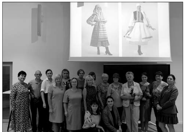
Іл. 20. Учасники наукового семінару «Універсальні й унікальні техніки ткацтва західної частини України та Литви» у КТУ