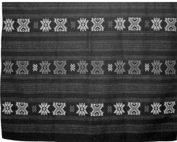
Іл. 17. Блажукене Я. Узорнотканий фартух. Виставка у Садибі Зипляй. 2023 р.

ташування яких надає легкості загальній композиції. Подібні орнаментальні мотиви та їх поєднання між собою використані у фартусі із села Бразюкай Каунаського району [11, p. 151].