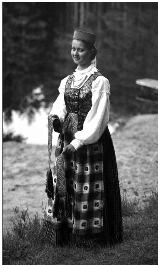
Іл. 8. Дівоче вбрання. Алітуський р-н, Дзукія. Друга половина ХІХ ст. Ілюстрація з Jurkuvienė T. Lietuvių tautinis kostiumas [12, р. 151]

У другій половині ХІХ ст. їм на зміну прийшли фартухи із чорним чи сіро-блакитним тлом та перебір-