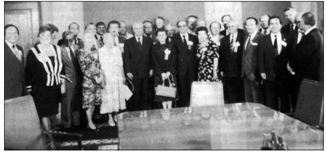
Іл. 3. Делегація СКВУ у президента України Леоніда Кравчука, 22 серпня 1992 р.

Протягом 1992—1993 рр. Ю. Шимко, В. Верига та інші представники СКВУ здійснили низку поїздок та зустрічей у різних містах України. Зокре-