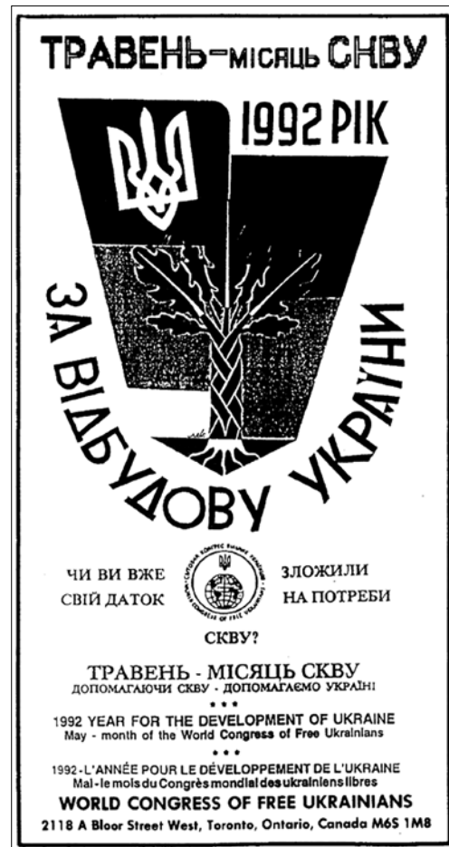
Іл. 2. Оголошення про збір коштів на Фонд «За відбудову України», травень 1992 р.