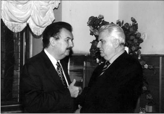
Іл. 1. Юрій Шимко та Леонід Кравчук

відвідала українське посольство в ООН, де провела зустріч з постійним представником України при ООН Геннадієм Удовенком [24].