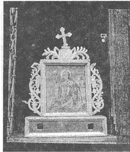
Процесійна ікона св. Варвари, кін. XVIII ст., с.Матисове. Скансен в м.Стара Любовня (Словаччина)

13 червня експедиція ознайомилася із збіркою лемківських ікон, виробів з дерева, графіки Никифора, які експонуються в Готичній кам'яниці, м. Новий Санч. Ввечері прибули в місто Стара Любовня, Словаччина. Наступного дня працювали в місцевому музеї народної архітектури. Зокрема, зафотографували дерев'яну церкву XVIII ст. з с. Матисова, бондарні і дротарські інструменти та вироби, тканини, вишивки тощо.