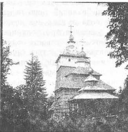
Дерев'яна церква в с. Воловець, XIX ст. (Польща)