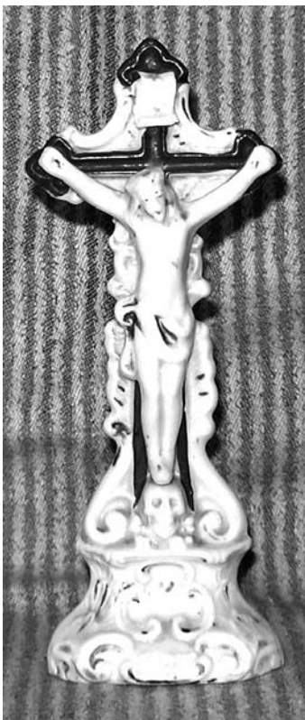
Хрест (напрестольний). Фаянсова маса, фарби, полива, відлив у формі, розпис. 1920-30-ті рр. Західна Україна (?). Збірка Г.Виноградської (Львів).

тольного хреста простежуємо чітку схему з ритованим хрестом на середохресті та трикутниками й "слізками" на кінцях. Легка схема розпису верхньої частини дещо дисонує зі щільним заповненням поверхні високої підставки різними елементами 44 .