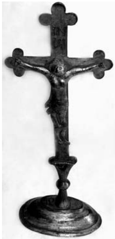
Хрест (напрестольний). Латунна бляха, посрібнення, карбування, гравірування. ХІХ ст. Гуцульщина (?). МЕХП. ЕП 42832.