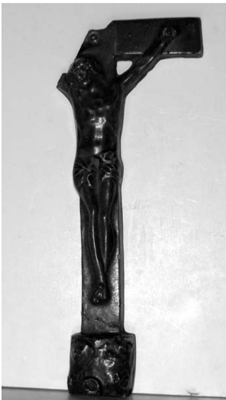
Хрест (ручний чи напостольний). Глина, полива, тиснення у формі, ліплення. 1920-ті рр. с. Глинсько Львівської обл. МЕХП. ЕП 44087.

вий з подовженою середньою поперечкою, семикінцевий з рівними раменами, восьмикінцевий з похилою нижньою поперечкою, трійчастий, антропоморфний, свастика. Такі хрести, призначені для церковного вжитку, лежать на престолі, стоять на різних підставках або є в руках священика під час проведення богослужіння 29 .