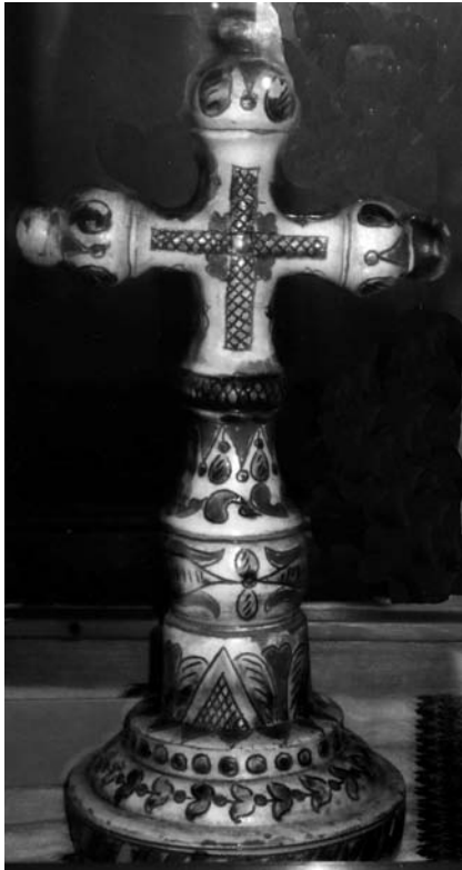
Петро Кошак. Хрест (напрестольний). Глина, ангоби, полива, формування на гончарному крузі, ліплення, риткування, розпис. 1912 р. с. Пістинь Івано-Франківської обл. НМЛ. 17504. НМК 279.