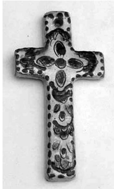
Григорій Цвілик. Хрест (настінний). Глина, ангоби, полива, тиснення у формі, риткування, розпис. 1930-ті рр. м. Косів Івано-Франківської обл. УЦНК “МІГ”. КН 7715. КС 647.

УЦНК “МІГ” – Український центр народної культури “Музей Івана Гончара”