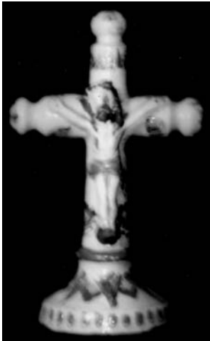
Григорій Цвілик. Хрест (напрестольний). Глина, ангоби, полива, формування на гончарному крузі, ліплення, розпис. 1930-ті рр. м. Косів Івано-Франківської обл. ЕМК. МЕК 44371.