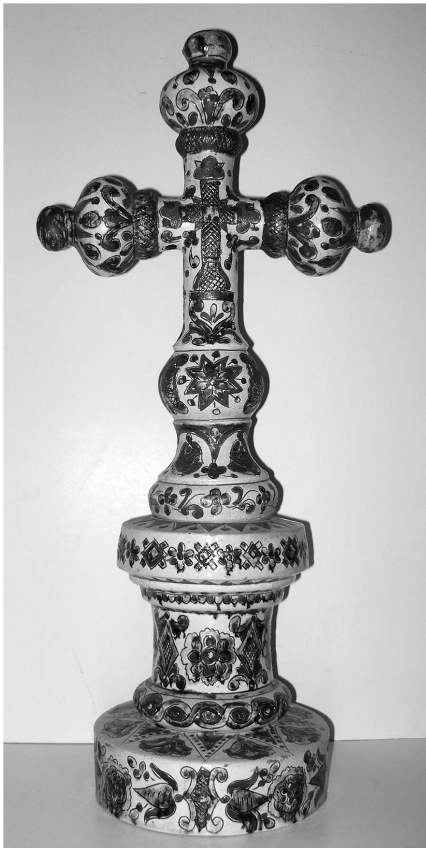
Петро Кошак. Хрест (напрестольний). Глина, ангоби, полива, формування на гончарному крузі, ліплення, риткування, розпис. 1912 р. с. Пістинь Івано-Франківської обл. МЕХП. К 5087.