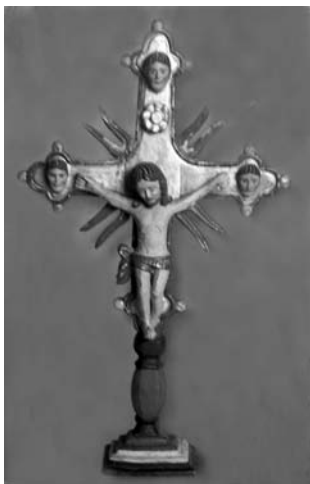
Хрест (напрестольний). Дерево, фарби, різьблення, розпис. Друга пол. ХІХ ст. Гуцульщина. Збірка І.Гречка (Львів).

виставку В.Шухевич зазначав, що “ручні трираменні хрести багато прикрашені народною орнаментикою” 34 .