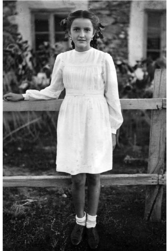
П’ятикласниця у білому. Село Мостове. 1952 р.

бік. На щастя, бика у стаді не було, а то, враховуючи колір наших прапорів, вийшла б корида. Мукання і мекання остаточно заглушили наш бравурний спів, який переливався у сміх, регіт. Потіха була люксова.