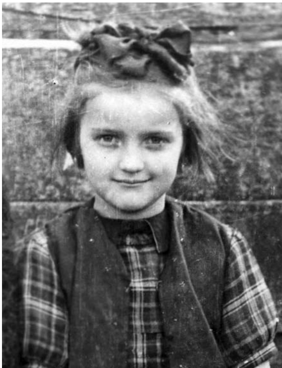
Ігри закінчилися, ідемо до школи. Село Городище на Ходорівщині. 1947 р.

і “відпекатись”. І так цілий день, у русі, у вигадках, у невтомній праці мозку, рук і ніг. Упав би ввечері у постіль і забутися до ранку, але ще треба помитись, повечеряти і, що особливо відповідало, засереджено помолитись. І стає, радше падає на коліна чемна дитина, складає рученята, зводить упокорені очі на Боженьку. Не зчулося – уже й сидить, напівсонно шепче молитву, і от уже ловить себе на тому, що замість “Отче наш” – рахує. Поривається розпочати все заново, і, нарешті, скінчивши молитву, засинає міцним дитячим сном.