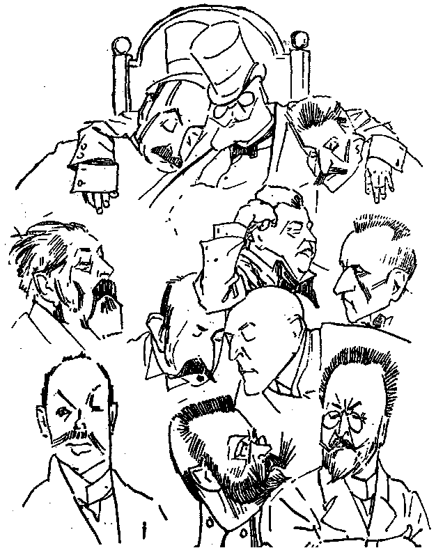
Іл. 2. О.Курилас. “Бойова Управа”. Ілюстрація до журналу “Самохотник”. – 1917. – Ч. 27-28. Папір, туш, перо.