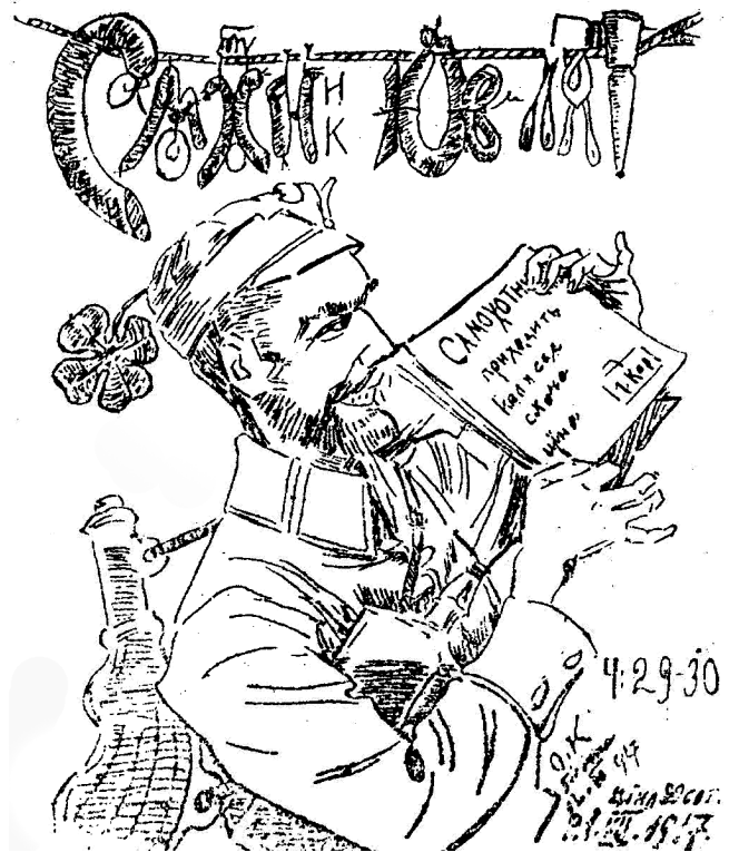
Іл. 1. Обкладинка до журналу “Самохотник”. – 1917. – Ч. 29-30. Папір, туш, перо.

У 25-26-му числі “Самохотника” були вміщені шаржі О.Куриласа на редактора іншого стрілецького часопису – “Червона Калина”, працівника і фотокореспондента Пресової Кватири М.Угриня-