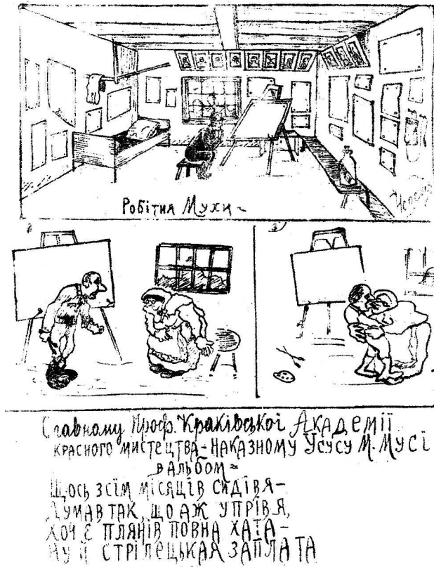
Іл. 4. “Робітня Мухи”. Ілюстрація до журналу “Самопал”. – 1916. – Вистріл 2. Папір, олівець.

Основним завданням видання був збір матеріалів до історії “Січового Війська”, в ньому, крім новин та інформаційних повідомлень публікувалися літературні твори та статті стрілецьких письменників.