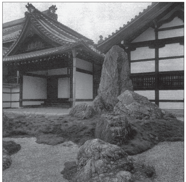
Композиція з каменів і мохів біля будинку

У фрагмент введений новий тип каменя — «кам'єнь вечірнього сонця», який знаходиться разом з «деревом призахідного сонця» на заході саду. «Кам'єнь місячної тіні» розташований на пагорбі, де він гармонійно співвідноситься з ліхтарем і деревами.