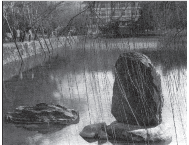
Композиція з каменів на воді

Головний елемент саду — «кам'єнь-охоронець» — займає центральне місце в композиції і разом з «кам'єм почесного сидіння» й іншими каменями, об'єднаними чагарником, домінує у всьому фрагменті. «Кам'єнь очікування» знаходиться біля води і відмічає її рівень, «кам'єнь пагорба» разом з іншим каменем і відстанями прикрашає східний схил пагорба; «кам'єнь шанування» займає місце навпроти «каменя-охоронця».