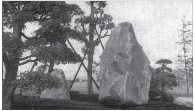
Композиція з двох каменів під деревами

• «дерево самотності» чи групу дерев з густим листям висаджують в глибині саду, створюючи тінь і враження самотнього місця;