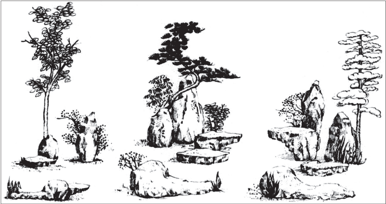
Композиції з п'яти каменів під деревами

Рівнинні сади влаштовують найбільш в містах на обмеженому просторі чи перед будинками другорядного значення. Більшу частину території засипають утрамбованим і розрівняним піском, на якому укладають камені, символізуючи острови серед води. Тут відсутні водяні поверхні — вода символічно представлена піском.